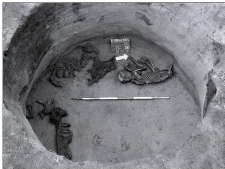
11. kép: Késő vaskori(?) kutyáldozat Fig. 11: Late Iron Age(?) dog sacrifice

Keleti szektor: REMÉNYI–ENDRŐDI–MARÁZ–VIRÁG 2006, 177.; III. Bp. Névtelen utca: BUDAI 2006, 83; Bp. XI. Skála áruház területe: ld. jelen kötet 141. oldalán) a késő vaskori keltezését valószínűsíti.