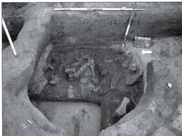
5. kép: Késő rézkori áldozati gödör bontás közben