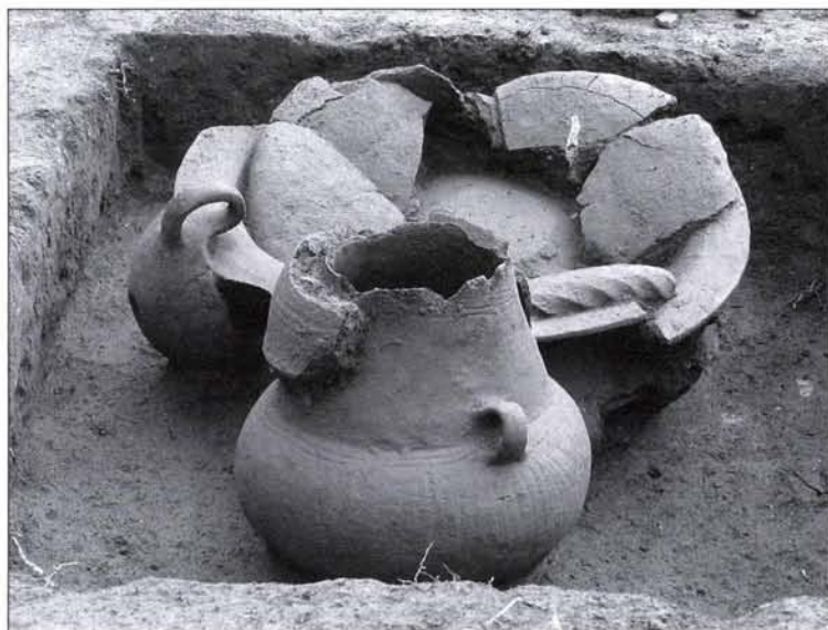
10. Késő bronzkori urnatemetkezés Fig. 10: Late Bronze Age urn grave

legzetes árkolt, síkozott, turbántekereses díszítésű hengeres, vagy csonkakúpos nyakú, gömbhasú urnáit, tállait, félgömbös csészéit tartalmazta. Leggyakrabban két-két szorosan egymás mellé helyeztek, nagyobb tállal borított edényt helyeztek a sírgödörbe. Az egyetlen urnaedényből álló temetkezések tipológiai elkülönítése ugyanakkor az újkori bolygatások miatt nem végezhető el megnyugtatóan. A 205. számú, épségben megőrződött sír egy borítótállal lefedett, csonkakúpos nyakú urnaedényt és egy behúzott peremű tállal letakart mélytálat tartalmazott, utóbbi peremére egy kis perem fölé húzott fülű csészét akasztottak. (10. kép) Az emberi hamvakat az urnák belsejébe vagy melléjük szórták egy kupacba (211. sír).