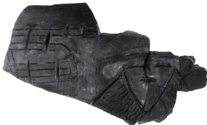
3. Újkőkori arcos edény töredéke Fig. 3: Fragment of a Neolithic anthropomorphic vessel

köszönhetően – meglehetősen kevés, zárt gödöranyagot szolgáltató objektumát tudtuk feltárni. Közülük kiemelkedik egy – minden bizonnyal a bőséges vadállomány biztosítása érdekében – gödörbe helyezett hatalmas, 13 cm széles, 80 cm hosszú őstulok-szarv (2. kép), valamint egy gödörbe dobott vörös-sárga sávosan festett, plasztikusan kidolgozott emberi arcot ábrázoló edény töredékei. (3. kép) A feltárt településrészlet az északról határos BUVÁTI vízisport-telep területéről is ismert neolitikus lelőhelyhez tartozik (CSÁNK 1964, 205–209.), ahonnan eddig a Püskösdűrdő környezetére lokalizált (TOMPA 1936, 5–7.), késő Zseliz településnél idősebb időszakot képviselő leletek kerültek elő (M. Virág Zsuzsanna szíves szóbeli közlése).