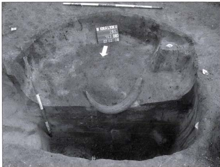
2. kép: Neolitikus őstulokszarv bontás közben Fig. 2: Neolithic aurochs horn during excavation

The holiday house of the Pénzjegynyomda Company formerly stood on the territory where Late Bronze Age urn graves were disturbed during the digging of the ditch for a pipe system in 1958 (NAGY 1959) and during the mechanic lifting of the concrete foundation blocks for the holiday house in the autumn of 2006 (archaeological observation by Orsolya T. Láng). The preventive excavation following the observation work extended over the entire territory of the lot where earth movement was planned including the surface of the future buildings, the deep parking lots and the internal road system. The 1660 m 2 excavation territory crossed the bank transversally along 150 m and offered an excellent general view of the contact system in its geomorphologic setting and permitted proper archaeological coverage of the site. These high expectations were justified during the work: 499 archaeological features were documented