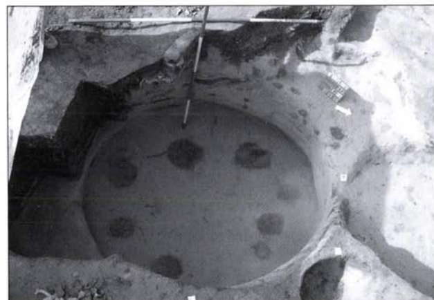
7. kép: Késő rézkori cölöpszerkezet nyoma egy áldozati gödör alján Fig. 7: Marks of Late Copper Age post- structure at the bottom of a sacrificial pit