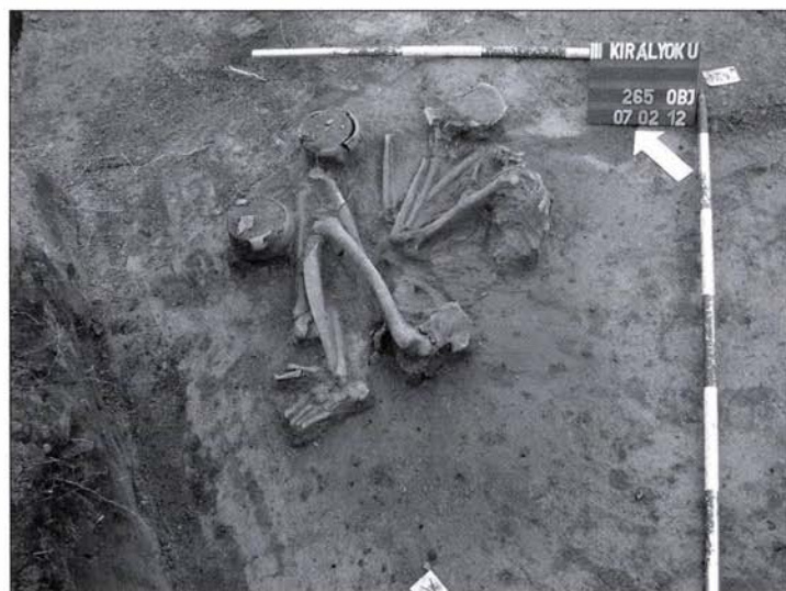
4. kép: Középső rézkori zsugorított csontvázas sír Fig. 4: Middle Copper Age contracted inhumation burial

The partial settlement was covered with a debris layer attaining a thickness of 2.5 m in the central part of the excavation territory. This layer attests to intensive land use in the period of the Copper Age Baden culture at the beginning of the 3 rd millennium. The large number of uncov-