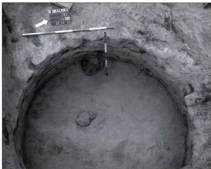
8. kép: Kora bronzkori áldozati gödör seprűdiszes edény maradványával Fig. 8: Early Bronze Age sacrificial pit with remains of a vessel

A kora bronzkori Makó-kultúra (III. évezred második fele) településnyomai a Dunához közelebb eső területre szken kerültek elő. Méhkas alakú tárológödrök, kisméretű jellepes sírként, vagy áldozati gödörként interpretálható beásások mellett kiemelendő az a hatalmas méhkas alakú verem (136. obj.), amelynek fenekén apró kerek tüzelésnyomot, mellette néhány nagyobb terméskövet, állatsontot találtunk, a gödör oldalánál a kultúra jellegzetes, seprűdiszes fazeka feküdt. (8. kép) A jelenségsoport fölé egy csaknem teljesen homogén sárga földréteget halmoztak kúpszerűen, melyet nagymennyiségű állatsont borított.