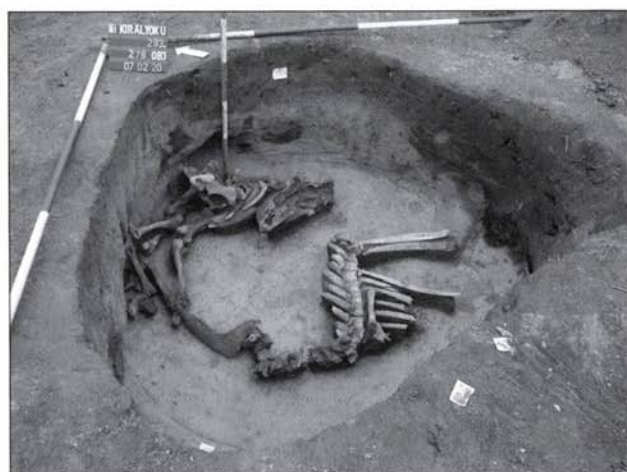
6. kép: Rituális többes szarvasmarha temetkezés