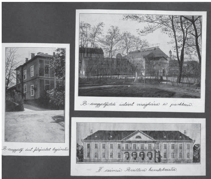
4. Az angyalföldi elmeügyi múzeum (Selig Múzeum) „Múzeumbuma”, 1936 körül

lásával indít, majd hirtelen zavarba ejtőn sűrű összeállításokhoz érkezünk: a művészettörténetből ismert reprodukciókat a pszichiátriai betegségben szenvedőket 21 ábrázoló orvosi fényképek és a szociofotók attitűdjével bíró életképek, 22 valamint sajtóképek fotómásolatai (futurista munkák kapcsán írt recenziórészletek) mellé helyezi. A már régen lebontott angyalföldi intézet épületeiről négy oldalon át láthatunk fényképeket, és a felvételek közt feltűnik a dicsőszentmártoni ápolási te-