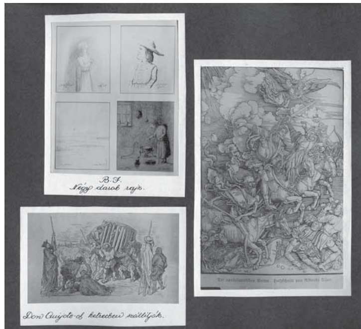
6. Az angyalföldi elmeügyi múzeum (Selig Múzeum) „Múzeumalbuma”, 1936 körül MTA Pszichiátriai Művészeti Gyűjtemény, kézírattár