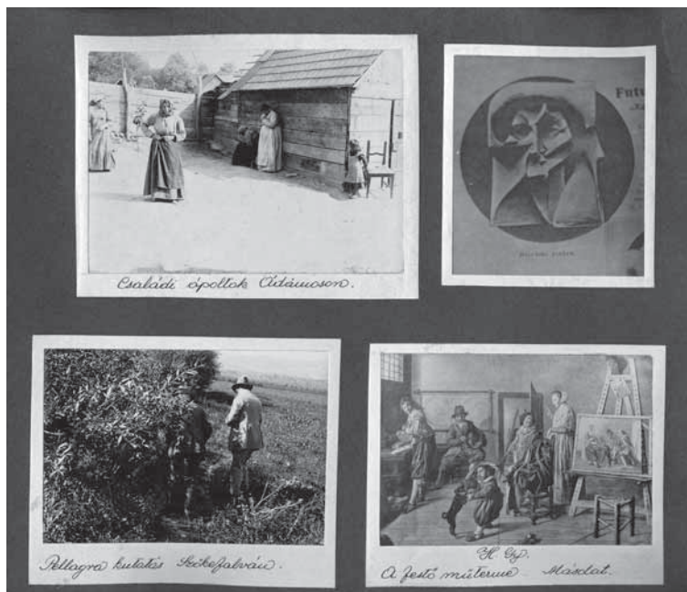
9. Az angyalföldi elmeügyi múzeum (Selig Múzeum) „Múzeumlbuma”, 1936 körül MTA Pszichiátriai Művészeti Gyűjtemény, kézirattár