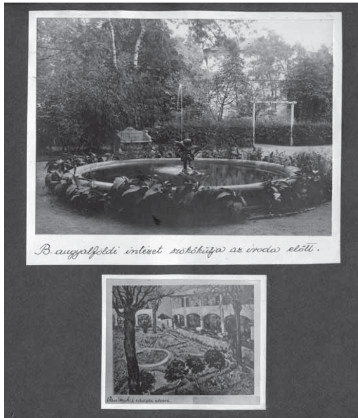
5. Az angyalföldi elmeügyi múzeum (Selig Múzeum) „Múzeumalbuma”, 1936 körül MTA Pszichiátriai Művészeti Gyűjtemény, kéziratár

amely amennyire egységesíti és a fotográfia médiumában közös nevezőre hozza a széttartó forrásvidékről származó vizuális jelenségeket, annyira lüktetően feszíti is mediális kereteit. Az első átlapozásnál zavarba ejtően ambivalens érzéseket keltett bennem: a pszichiátria közegéből váratlanul ért ez a fotográfia médiumán keresztül űzött gondolat kifejezés, ugyanakkor a képek merész, elsődleges kontextusuktól elvonatkoztatató, formai absztrakciót sejtető kezelése művészettörténeti módszert termő gyakorlatként is ismerős (6–9. kép).