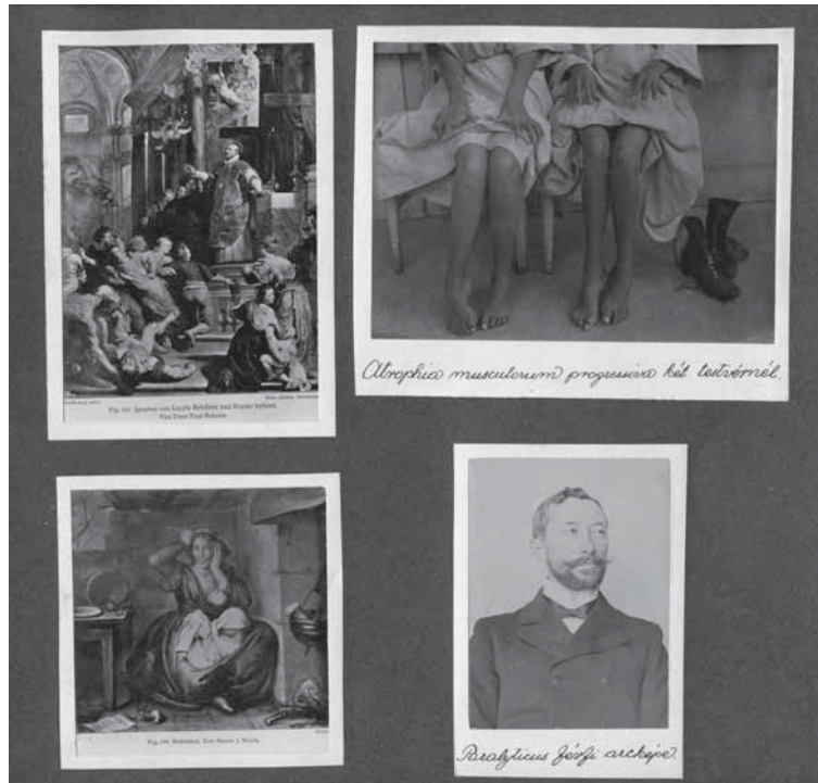
8. Az angyalföldi elmeügyi múzeum (Selig Múzeum) „Múzeumlbuma”, 1936 körül MTA Pszichiátriai Művészeti Gyűjtemény, kézirattár