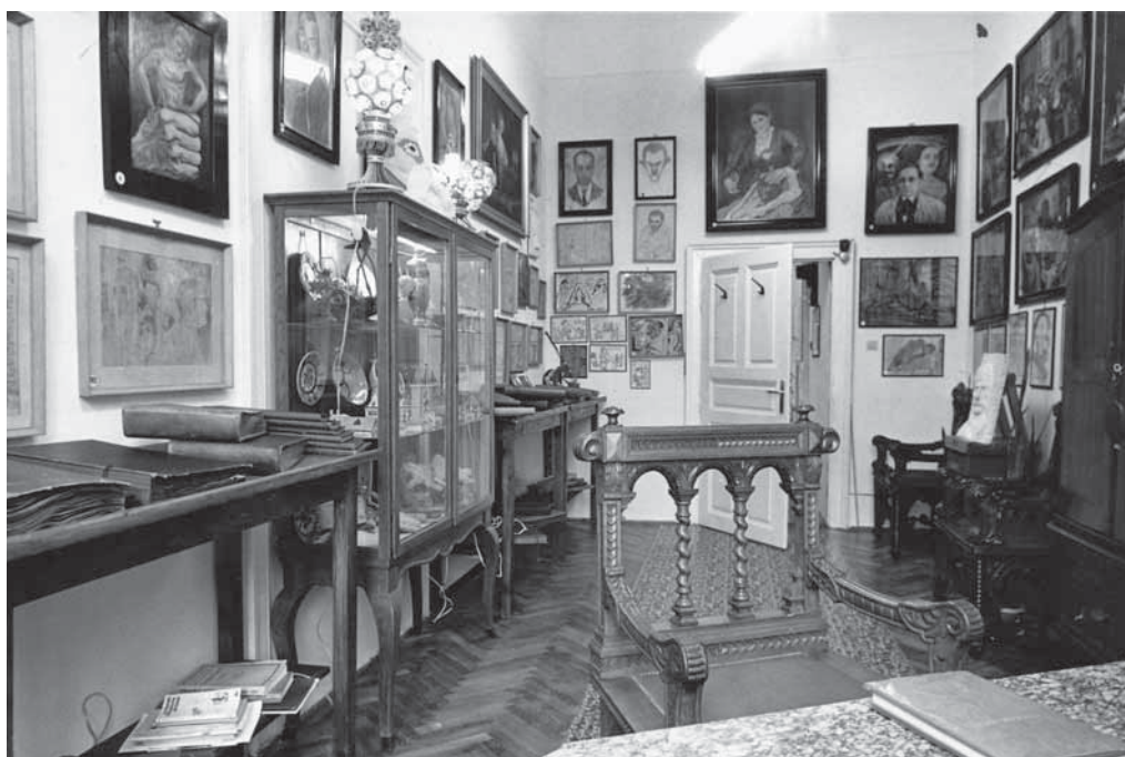
12–13. Országos Ideg- és Elmeógyógyászati Intézet (1992-től OPNI), Pszichiátriai Képtár-Múzeum dr. Fekete János katalógusához készült felvételek, 1980 MTA Pszichiátriai Művészeti Gyűjtemény, kézirattár