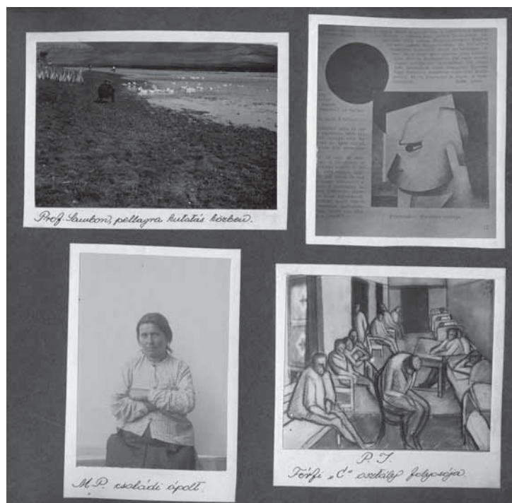
7. Az angyalföldi elmeügyi múzeum (Selig Múzeum) „Múzeumalbuma”, 1936 körül MTA Pszichiátriai Művészeti Gyűjtemény, kézírattár