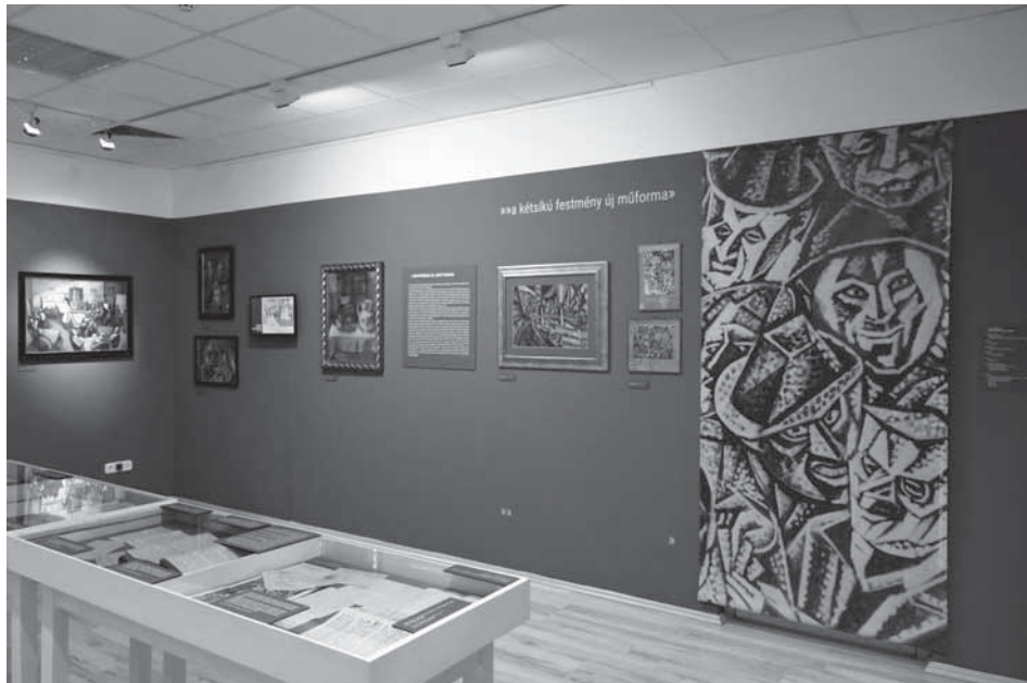
1. Kiállításenterőr: A kétsíkú kép. Pál István és Füst Milán barátsága, 2016 MTA Pszichiátriai Művészeti Gyűjtemény

moknak a gyűjteménybe kerülésük okát kutatva szemléletessé válik az intézeti orvosok gondolkodásmódja, amelyben a terápiás módszerek alkalmazása (az ún. „nemes szórakozások”: festés, rajzolás, olvasás, zenélés művelésének támogatása) és a gyűjteményezési gyakorlat (például a pszichiátriai történeti vonatkozású képek másoltatása a kezeltekkel, vagy albumok készítése az intézeti könyvkötő műhelyben, amely a betegek számára létesített foglalkoztató műhelyként működött) szorosan összefügg.