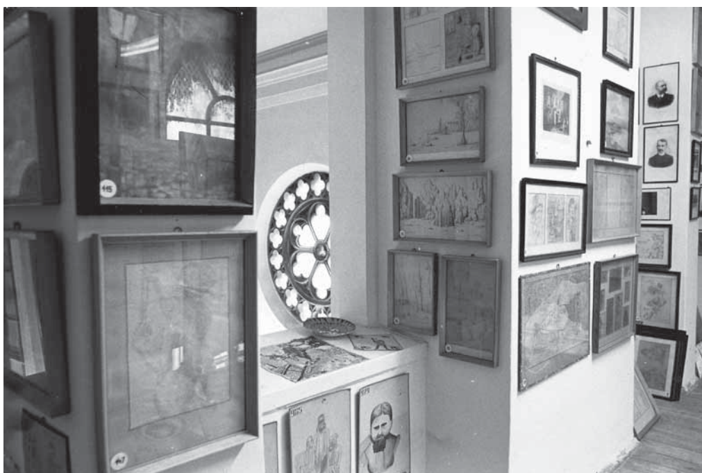
10–11. Országos Ideg- és Elmegyógyászati Intézet (1992-től OPNI), Pszichiátriai Képtár-Múzeum dr. Fekete János katalógusához készült felvételek, 1980 MTA Pszichiátriai Művészeti Gyűjtemény, kézirattár