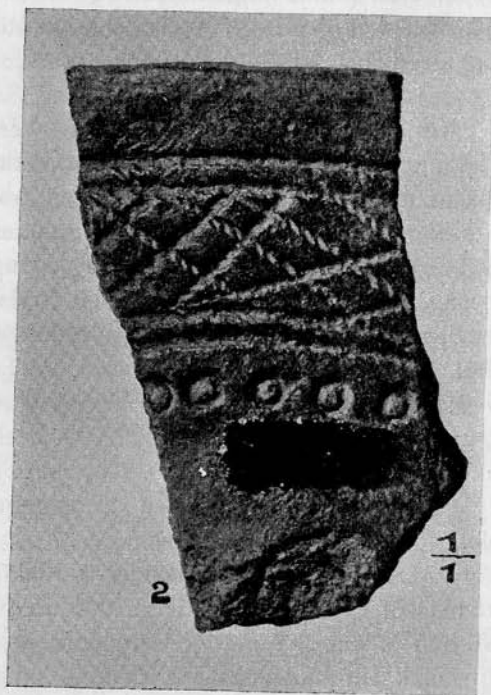
2. kép. Zsinegdíszes edénytöredékek Erösdről. Fig. 2. Fragments des vases cordées d'Erösd.