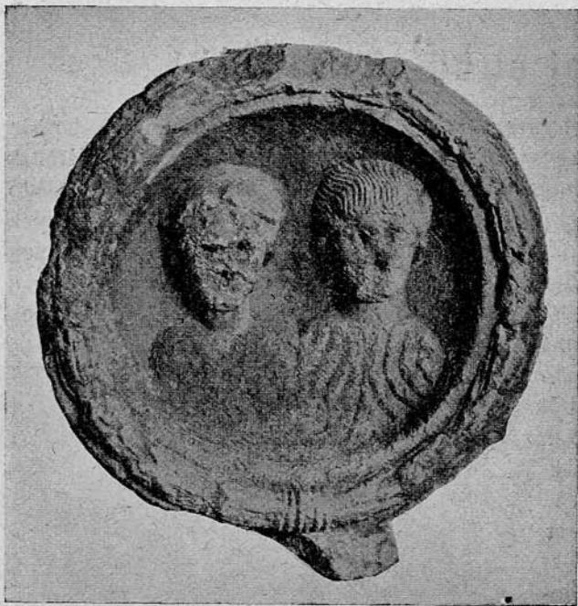
2. sz. kép. Római sirkő Gyalúból (Kolozsvár mellől.)

m., vastagsága 0·18 m. A kagyló alakú fülke hátlapja az elülső mélyítésnek megfelelően, kidomborodik. Széles, féldomború tag szegi. Ebből a szegélyből, fönt is, lent is csap ugrott ki. A felső csap fölfelé szélesedik és felső lapjában négyszögletes lyuk van, amelybe az acroterium