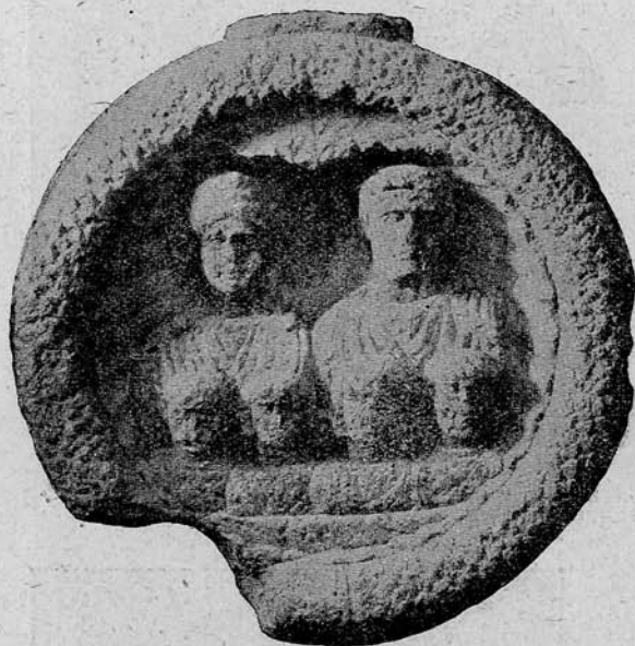
5. sz. kép. Római sírkő Nagyapoldról (Szebenmegye.)

5. (5.-ik kép). Lelt. száma 2110. Anyaga durva mészkő. Lelőhelye: Nagyapold (Szebenmegye). Magassága 0·93 m., szélessége 0·89 m., vastagsága 0·23 m. Fenntartása elég jó. Csak alsó és felső csapja hiány-