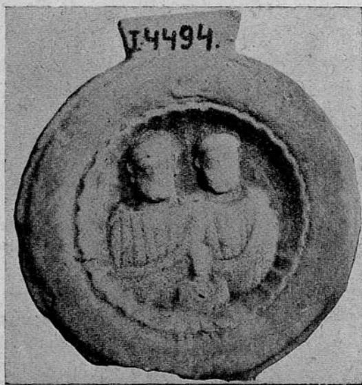
1. sz. kép. Római sirkő Petrozsánból (Zalatna mellől.)

1. (1. kép.) Anyaga homokkő, lelőhelye Petrozsán , a mai Zalatna, vagyis a római Ampelum, közelében. Magassága 0·87, átmérője 0·77