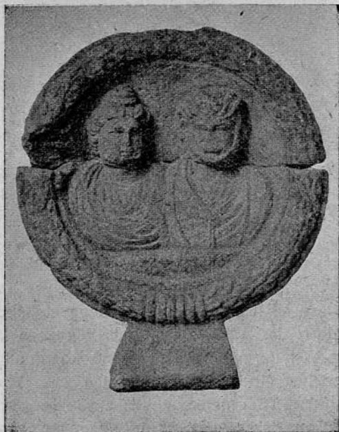
4. sz. kép. Római sírkő Gyulafehérvárról. Fig. 4. Monument funéraire romain en pierre, trouvé à Gyulafehérvár.