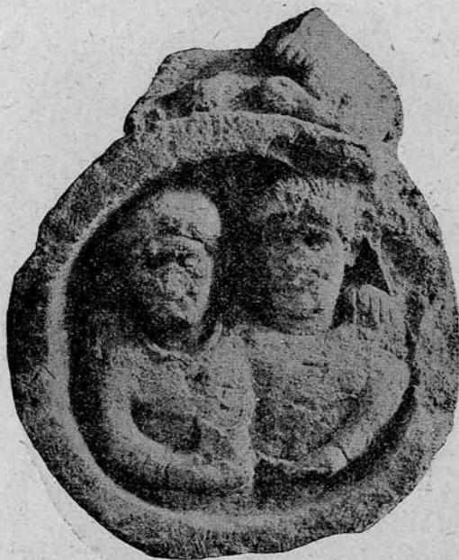
7. sz. kép. Római sírkő Nagyekemezőről (Nagyküüllőmegye.)

egy alul széles és felfelé keskenyedő csap segítségével oltárszerű talapzatra állították. Ez utóbbin volt a felirat. Az 5 és 6 sz. alattiakon kívül, amelyeket falhoz támasztottak és oda is erősítettek — talapzataikon szabadon állottak. Abban azonban valamennyi daciai darab meg-egyeznek, hogy ellentétben az észak-pannoniai és noricumiai példákkal, egyiken sincs oromzat hanem fölül csak akrotérium szegi be a kört. Másik különbségük, kifelé domborodó hátlapjuk. Ezáltal a mi példáink önálló független típust adnak, melynek kialakulását magában Daciában kell keresnünk. A fejlődés párhuzamosan halad a noricumival. Valamint a noricumiai típus elemei, a kerek medaillon, az oromfödél,