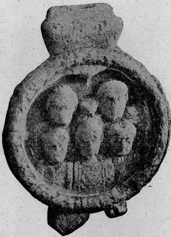
6. sz. kép. Római sírkő Nagypoldról (Szeben megye.)

7. (7-ik kép). Anyaga mészkő. Lelőhelye Nagyekemező , Nagyküküllőmegye. Magassága 0·59 m., átmérője 0·48 m., vastagsága 0·14 m. A kerek fülke pereme sima, díszítetlen. Háta, mint a noricumai és