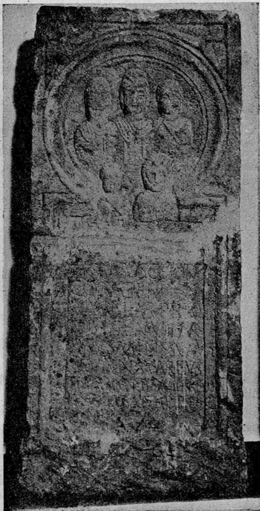
8. sz. kép. Római sírkő Veczelről (Hunyadmegye)

Egy Wienben levő sir-cippuson 1 széles babérmagkoszorú látható, amely