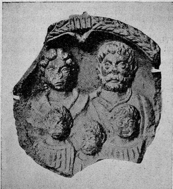
3. sz. kép. Római sírkő ismeretlen daciai lelőhelyről. Fig. 3. Monument funéraire romain en pierre.

4. (4-ik kép). Lelőhelye Gyulafehérvár , a római Apulum . Anyaga durva mészkő. Magassága 0.62 m., átmérője 0.52 m., vastagsága 0.18 m. Közepén kettétört, mindazonáltal jó fenntartású. A felső csap egészen letört,