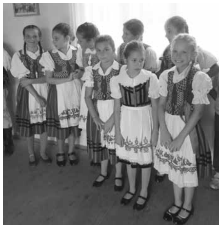
Jobbágytelke, Faluház, néptáncbemutató

Az élménybeszámolót a következő lapszámban közöljük!