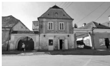
„Kopacz ház”, Gyergyó központi részén épült 1800 körül