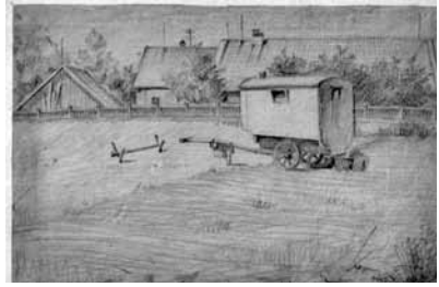
Kopacz Miklós Lukács rajza: Pochingi tábori lakásuk 1945-ben