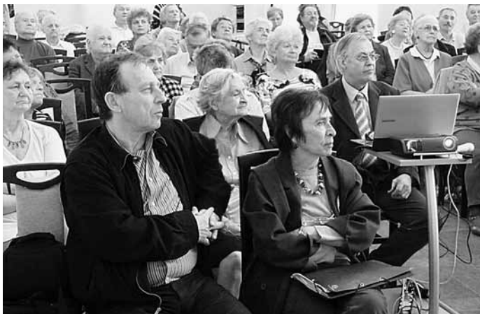
A Fővárosi Örmény Klub áprilisi közönsége

Öt óra az időeltolódás, de a fiatalok interneten keresztül üzenetet küldtek a klub közönségének: „Szeretettel üdvözlünk mindenkit Thaiföldről. 16 300 kilométer van a hátunk mögött, és pár nap múlva megérkezünk a huszonharmadik országunk-