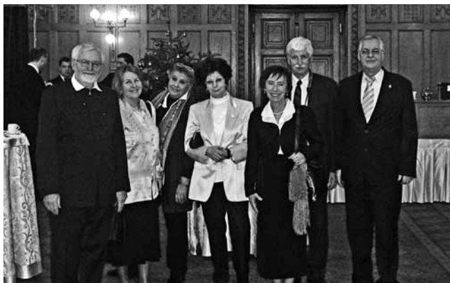
Az Erdélyi Örmény Gyökerek Kulturális Egyesület meghívott tagjai körében a díjazott

A Közigazgatási és Igazságügyi Minisztérium Egyházi, Nemzetiségi és Civil Társadalmi Kapcsolatokért Felelős Államtitkársága idén is pályázati felhívást tett közzé a 2011. évi Kisebbségekért Díj elnyerésére. A Hazai Kisebbségekért Tagozatnak ebben az elismerésében a magyarországi nemzetiségek érdekében a kisebbségi közéletben, az oktatásban, az Erdélyi Örmény Gyökerek Kulturális Egyesület meghívott tagjai körében a díjazott