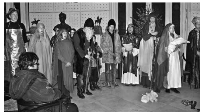
Szent Család Plébánia Gyermekek Színjárszó Köre

Sünohorvó Nor Tari! Boldog Új Évet kívánunk!