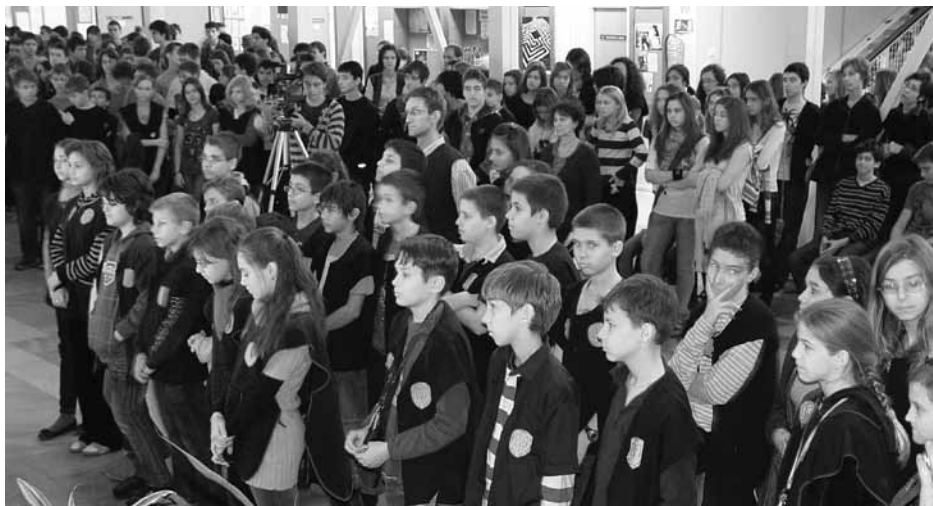
A kíváncsi gyereksereg