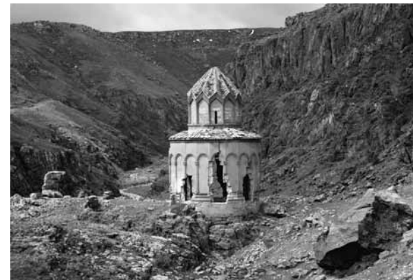
Szent Szarkisz templom

Geghardhoz hasonlóan a világörökség része Noravank XIII. századi kolostora is, amelyhez a rendkívül rossz utakon másfél-két óra alatt lehet eljutni Jerevából. Ha az eddigi látnivalók nem nyűgözték le