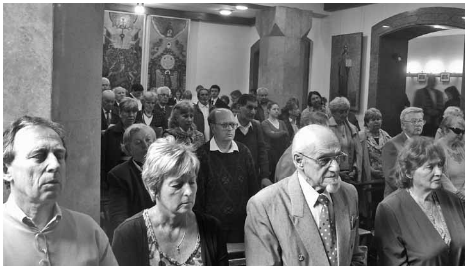
A húsvéti és a genocídiumra emlékező szentmise résztvevői

ENP Képviselőcsoport Európai Parlament Tőkés László, az Európai Parlament alelnöke