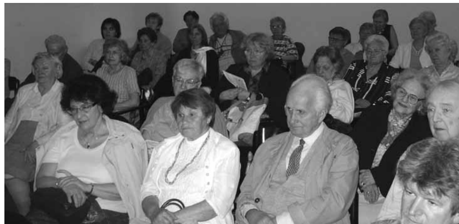
Az áprilisi klubdélután közönsége

Nagy taps köszöntötte a klubdélután műsorának második részében az Erdélyi Örmény Gyökerek Kulturális Egyesület