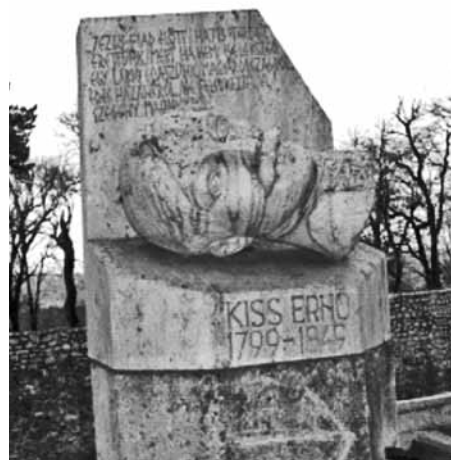
Kiss Ernő honvéd altábornagy pécsi szobra

A Kolozsi Tibor által vezetett csoport nekilátott az ólomöntésnek, amelyet a mai nap folyamán fejeznek be. A Szabadság-szobor központi alakjának talapzatra helyezését mintegy félszáz érdeklődő kísérte figyelemmel, és végül tapsolta meg. Zala György újraállított aradi Szabadság-szobrának avatására 2004. április 25-én, vasárnap 12 órakor kerül sor a Tűzoltó téren.