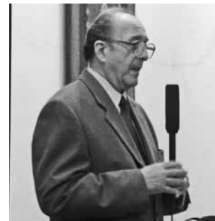
A Fővárosi Örmény Klubban 2007. január 18-án