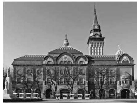
A szabadkai városháza