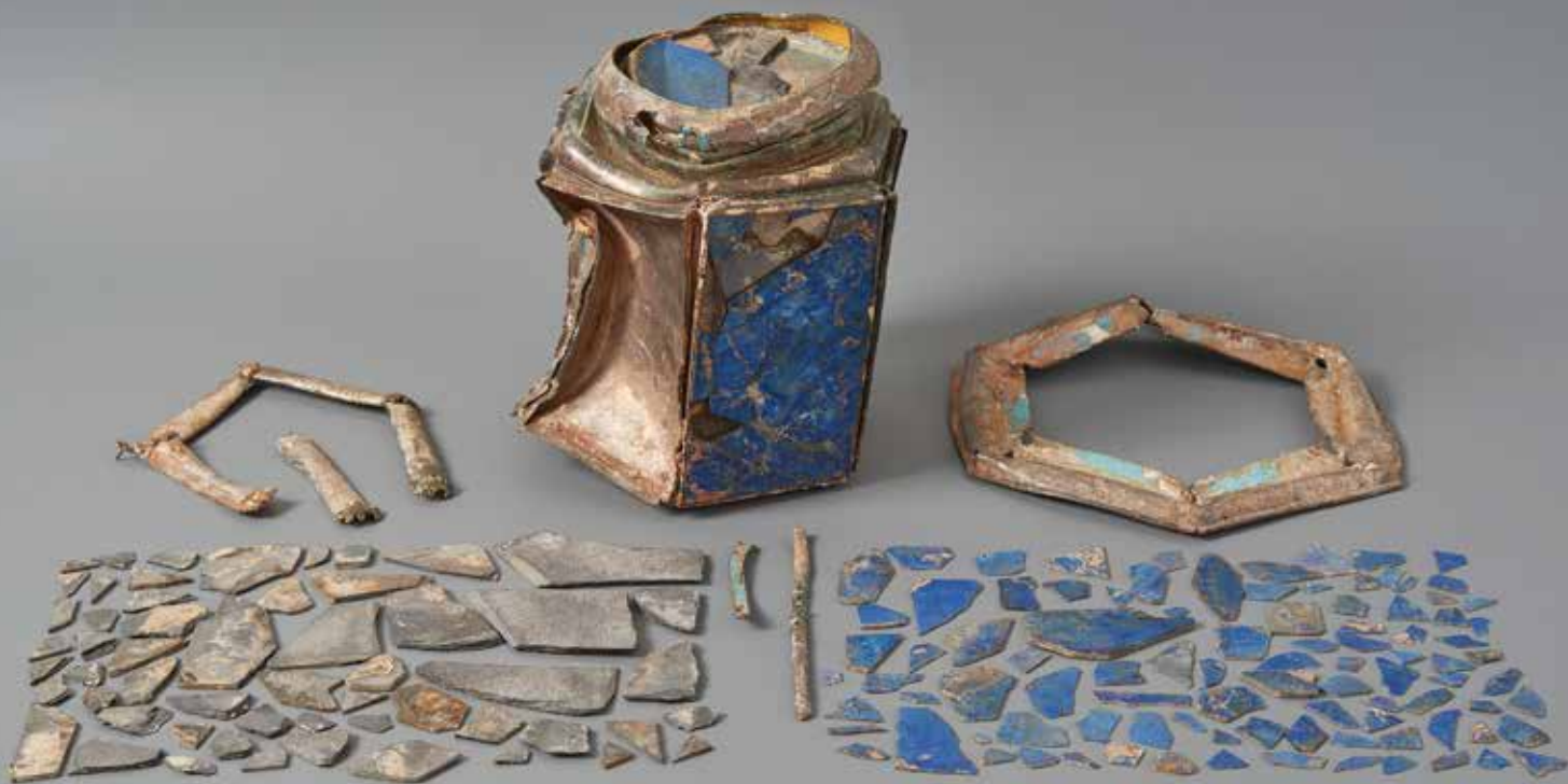
Gyömbértartó maradványai | Remnants of a ginger holder | Augsburg, 17. század, lapis lazuli lapok, részben aranyozott ezüstmag és -foglatok, festett zománcdísz, egykori magasság: 22,2 cm (Iparművészeti Múzeum, Budapest, ltsz.: Ej 292)