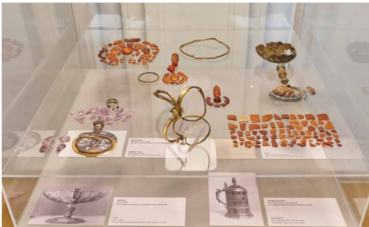
Borosnyámból, ametisztból és jáspisből faragott 17. századi műkincsek maradványai az Iparművészeti Múzeum Opus 735 című kiállításán Remains of 17th century artworks carved of amber, amethyst and jasper in the Opus 735 show of the Museum of Applied Arts