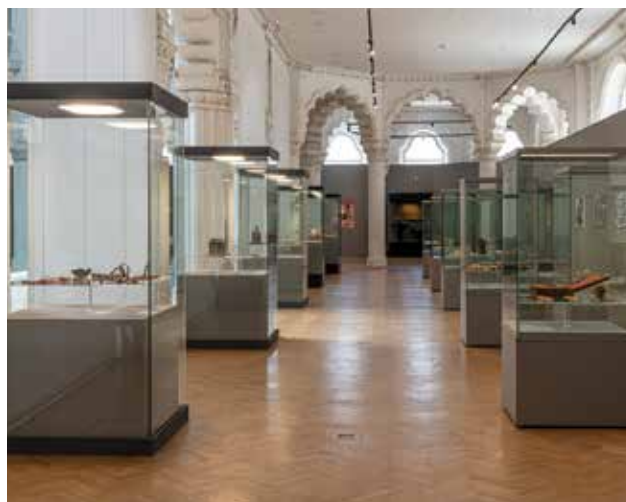
Opus 735 – A háború nyomai az Esterházy hercegi kincstár műtárgyain című kiállítás (részlet) | Opus 735 – Traces of War on Artworks from the Treasury of the Princes Esterházy (exhibition photo) Iparművészeti Múzeum, Budapest, 2022

érzékelte a kiállítás harmadik szakaszának kronologikus fotóösszeállítása. Ezen az idővonalon nemcsak az ez idáig restaurált műkincsek válogatása szerepel, de a múzeum restaurátorainak és restaurátorműhelyeinek, valamint az Esterházy-kincsek kiállításainak fényképei is föltűnnek a hőskortól napjainkig.