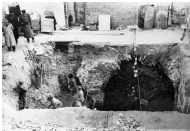
A Tárnok utcai Esterházy-palota romjainak feltárása 1949-ben Exploring the ruins of the Esterházy palace in Tárnok street in 1949

Amikor az Esterházy-termeket 1942-ben bezárták, Magyarország már hadban állt, az Iparművészeti Múzeum pedig – önállóságát veszítve – a Magyar Nemzeti Múzeum egyik szervezeti egységévé működött. A kincseket a Nemzeti Múzeum épületének óvóhelyén helyezték el. 1944 őszétől a front egyre közelített a főváros felé. Zárult az ostromgyűrű Budapest körül, amikor 1944 decemberében Esterházy Pál herceg (1901–1989) a kincseket elszállította a múzeumból.