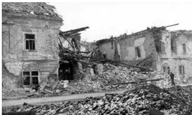
A Tárnok utca 9–13. (Budapest I. ker.), az Esterházy-palota romjai a budai Várban 1945-ben | Tárnok street (Budapest, 1st district), ruins of the Esterházy palace in the Castle District of Buda in 1945

hegyikristályból és más drágakőásványokból faragott műkincsek, elefántcsont faragványok, fajanszok és keleti porcelánok kerültek közszemlére. A múzeum munkatársai ismeretterjesztő előadásokat is tartottak a kincsekről.