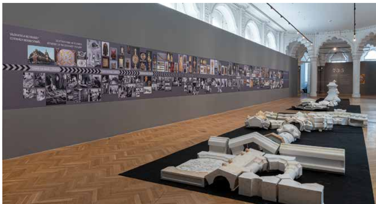
Az Opus 735 – A háború nyomai az Esterházy hercegi kincstár műtárgyain című kiállítás részlete az idővonallal, valamint az Iparművészeti Múzeum kupoláját lezáró laterna gipszmodelljének darabjaival | Opus 735 – Traces of War on Artworks from the Treasury of the Princes Esterházy, part of the exhibition with the timeline and pieces of the plaster model of the lantern crowning the cupola of the Museum of Applied Arts Iparművészeti Múzeum, Budapest, 2022