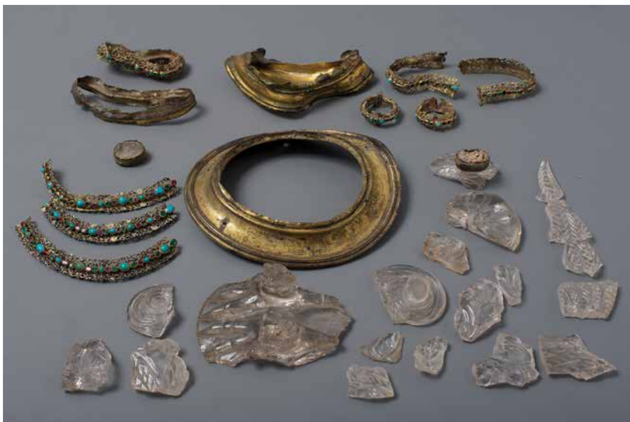
Az Ottavio MISERONI műhelyében készült Sárkány alakú díszerleg maradványai | Remains of the ornamental cup shaped like a Dragon made in Ottavio MISERONI's workshop | Milánó, 1600 körül, hegyikristály; aranyozott ezüsfoglalatok; türkíz, rubin, smaragd; festett zománcdíz; egykori magasság: 23,5 cm, hosszúság: 36 cm (Iparművészeti Múzeum, Budapest, ltsz.: Ej 170)