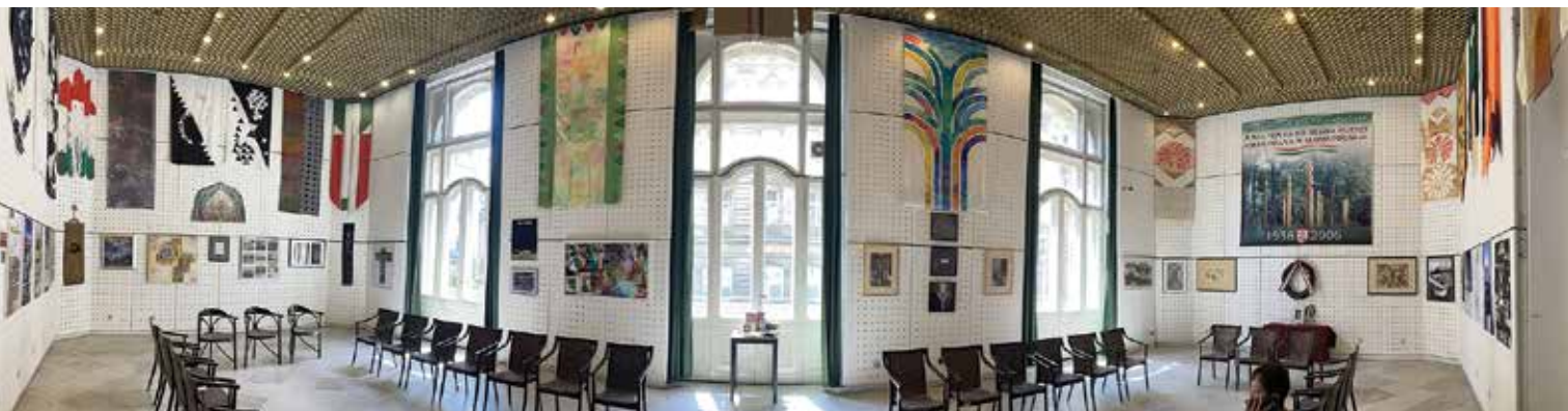
Panorámakép a Trianon Missziós Vándorkiállításról | View of the Trianon Missionary Travelling Exhibition

„Legyenek műveitek meghallgatásra találó fohász!” (Szegő György, Vendégek könyve)