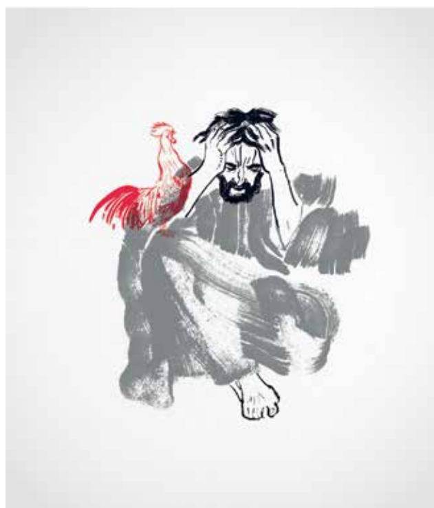
BALÁS Benedek: Péter tagadása (Márk 14,66–72). Bibliai illusztrációs sorozat | Benedek BALÁS: Peter's denial (Mark 14:66–72). Bible illustrations series | 2021, szitanyomat, 50x35 cm