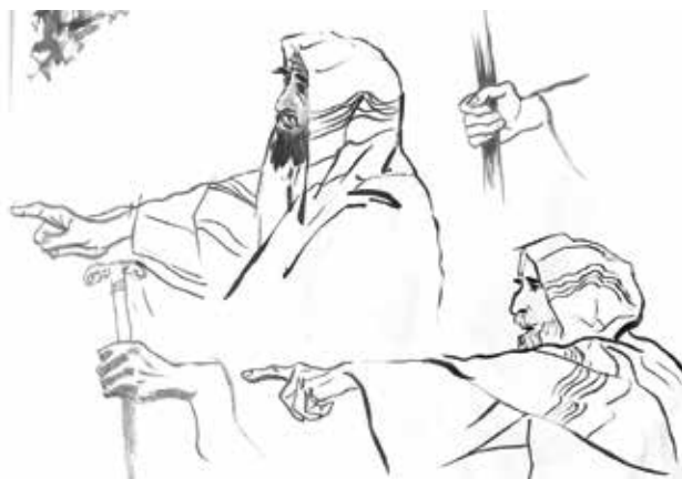
BALÁS Benedek: Alaktanulmány. Vázlatok a Bibliai illusztrációs sorozathoz Benedek BALÁS: Figure study. Sketches for the Bible illustrations series 2021, tus, ecset, cca. 25x35 cm

fejét zavartan, az Úr megszólításának irányába hátrakapó ember nem az ikonográfiából ismert almát tartja kezében, hanem egy gránátalmát, aminek szintén fontos szemiotikai vonatkozásai vannak a bibliai kontextusban, de megjelenése ebben a jelenetben nem jellemző.