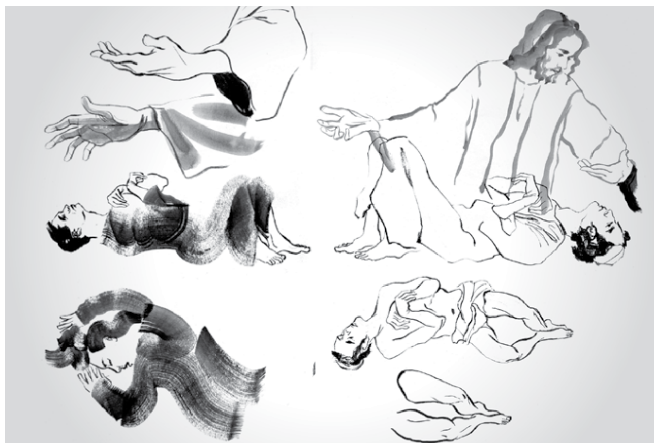
BALÁS Benedek: A béna meggyógyítása. Vázlatok a Bibliai illusztrációs sorozathoz

Nem csupán a tartalmi és formai jegyek, de az egyes jelenetek kiválasztása is sokat elárul az alkotóról. Figyelemre méltó, és valóban rendhagyó, ahogyan Balás Benedek beállít egy-egy kompozíciót. (Az oly sok tekintetben kivételes sorozatból nehéz bármelyiket is kiemelni, e szöveg írója mégis kísérletet tesz rá.)