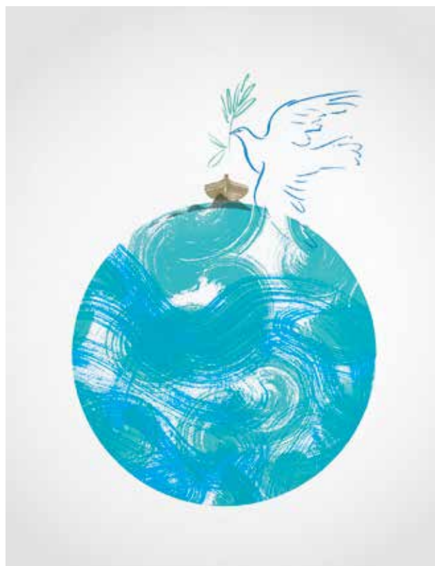
BALÁS Benedek: Vízözön vége (Teremtés 8,1–14). Bibliai illusztrációs sorozat | Benedek BALÁS: End of the Deluge (Genesis 8:1–14). Bible illustrations series | 2021, szitanyomat, 50x35 cm

A Szent Biblia képekben való feldolgozásának igénye évezredek művészeti hagyomány, ezért komoly kihívást jelent erre a témára bármilyen módon reflektálni. A művészettörténetből ismert legnagyobb művészek – Rembrandt, Michelangelo, Caravaggio, sorolhatnánk tovább – és megrendelőik épp oly lényegesnek tartották a szent szöveg jeleneteinek megfestését, illusztrálását, mint például a 19. századi Magyarországon Zichy Mihály