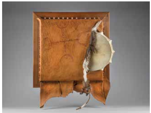
MOLNÁR Imre: Attribútumok, falikép | Imre MOLNÁR: Attributes, mural 2002, marhabőr, pergamen, kecskeszőr, csont, toll, fa, egyéni technika