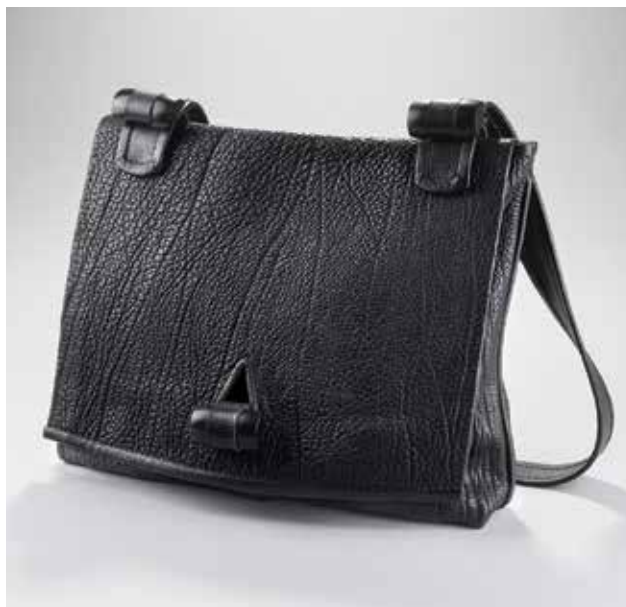
MOLNÁR Imre: Férfiváltáska | Imre MOLNÁR: Man's shoulder bag 2016, marhabőr, ébenfa, kézi varrás

Molnár Imre nagyszabású, feszesre kivitelezett, de mégsem zsúfolt kiállításán, amely áttekinti egész munkásságát, újra bizonyítja önálló tervezői és egyben kivitelezői entitását, összegzi képességét, készségét, tudását és kreativitását.