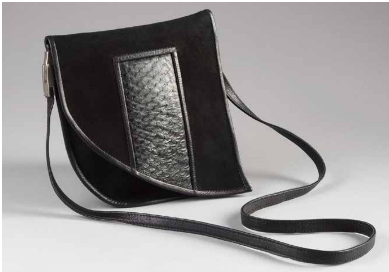
MOLNÁR Imre: Női alkalmi válltáska | Imre MOLNÁR: Woman's shoulder bag | 2016, marhabőr, kecskevelúr, tilápiabőr (halbőr)