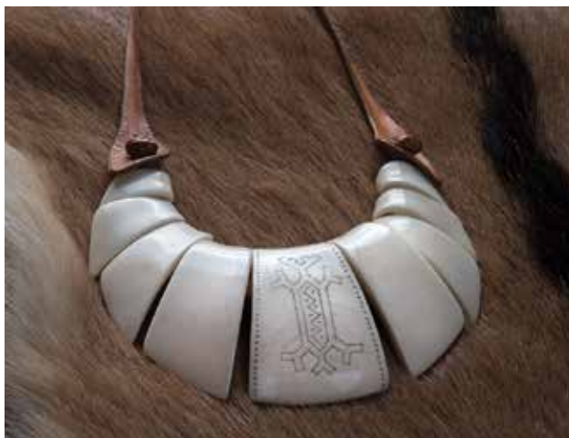
MOLNÁR Imre: Csontnyakék tamgával Imre MOLNÁR: Bone necklace with tamga | 2000, csont, bőr, karcolt