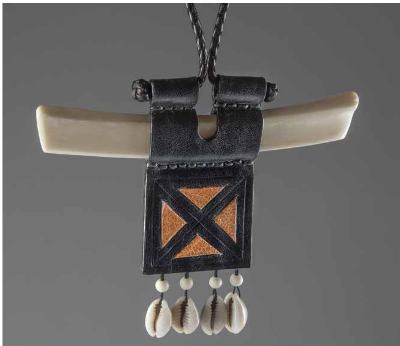
MOLNÁR Imre: Nyakék | Imre MOLNÁR: Necklace | 2020, csont, gyöngy, festett bőr, kauricsiga, bőrfonás, kézi varrás

szó szoros értelemben a kezemre játszott. 1975-ben ugyanis oldaltáskát kaptam születésnapomra. A jól megtermett bőrtarisznyában nemcsak kézirataimnak lett kényelmes és biztonságos helyük, hanem én is sokat nyertem – a munka látványával. Szívként megemelkedő sarkaival és puhán omló íveivel kellemes élmény a szemnek. E marhabőröböl készült darabnak közepén fényes fekete bivalyszőr az egyetlen éke, hacsak nem számítom dísznek azt a csontocskát, ami a nem kívánatos kezek elől zárja el a fedő fülén átdugva a táskát. Készítőjéről hosszú ideig semmit sem tudtam. Eredete felől érdeklődnöm nem illett, az M. I. monogram pedig, amit rajta találtam, akárhogy keresgéltem is az iparművészek között, nem vezetett nyomra. Míg egy napon a 2-es villamoson a táskámmal szembejött egy másik, és annak a tulajdonosa éppúgy felfigyelt az én soha másnál nem látott darabomra, mint én az ő, enyémre olyannyira hasonlatos tarisznyájára. Az ismerkedés elől nem lehetett kitérni. Így oldódott meg a rejtély. Akivel a villamos összehozott, a táska készítője,