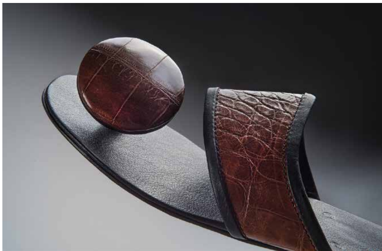
MOLNÁR Imre: Saru (részlet) | Imre MOLNÁR: Sandal (detail) | 2020, marhabőr, hüllőbőr, bőrtalp

Különös, elegáns és ugyanakkor pontos, egzakt meghívót kaptunk kézhez a Vigadóba, amely Molnár Imre bőrműves iparművész jubileumi kiállítására hívta az érdeklődő látogatót. Igen. Molnár Imre köztudottan bőrműves iparművész. Mégis bátorkodunk (egy kissé szemtelenül) két kérdést azonnal feltenni: biztos, hogy iparművész ? Biztos, hogy bőrműves ? Az első kérdés azért jogos, mert művészetének fokozatos kibontakozása során