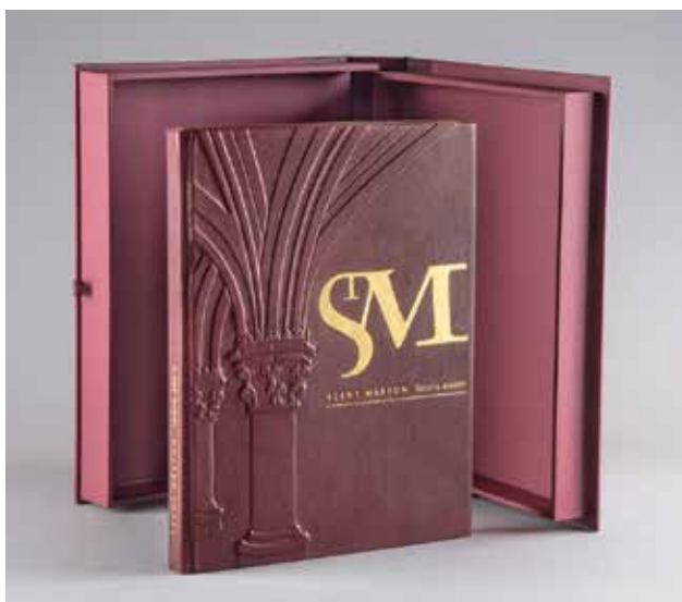
MOLNÁR Imre: Könyvkötés Lőrincz Zoltán Szent Márton, Savaria szülőtte című könyvéhez (B. K. L. – Pannon Lapok Társasága Kiadó, 2000). Könyvterv: SELLYEI Tamás Ottó | Imre MOLNÁR: Cover for Zoltán Lőrincz's book 'Saint Martin, native of Savaria' (B. K. L. – Pannon Lapok Társasága Publisher, 2000). Book design: Tamás Ottó SELLYEI 2013, kecskebőr kötés, bőrdomborítás, bőrintarzia, aranyozás, könyvtok