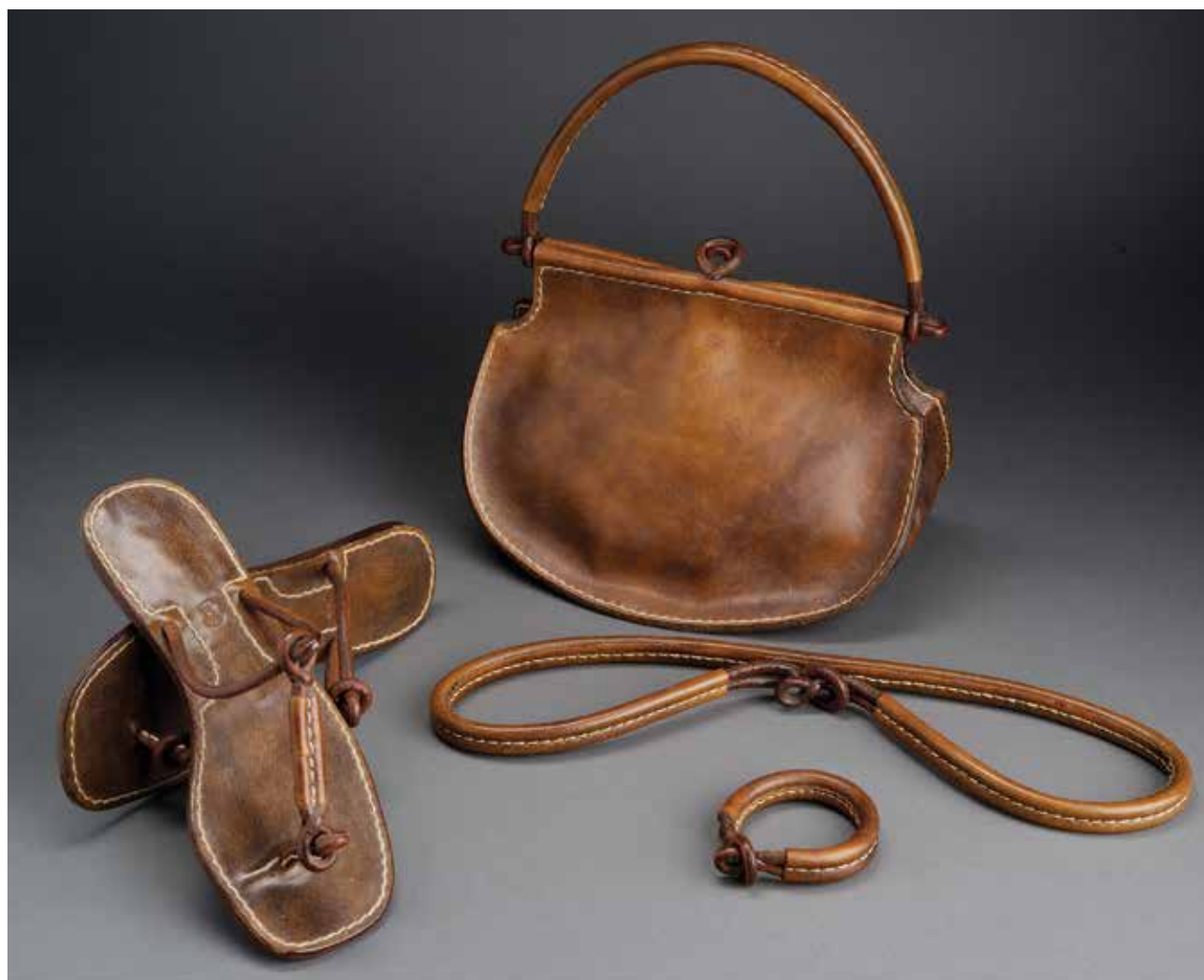
MOLNÁR Imre: Kézitáska, saru, öv, karkötő kollekció (forgalmazta: Iparművészeti Vállalat) Imre MOLNÁR: Handbag, sandals, belt, bracelet collection (marketed by Iparművészeti Co.) | 1976, marhabőr, festés, kézi varrás