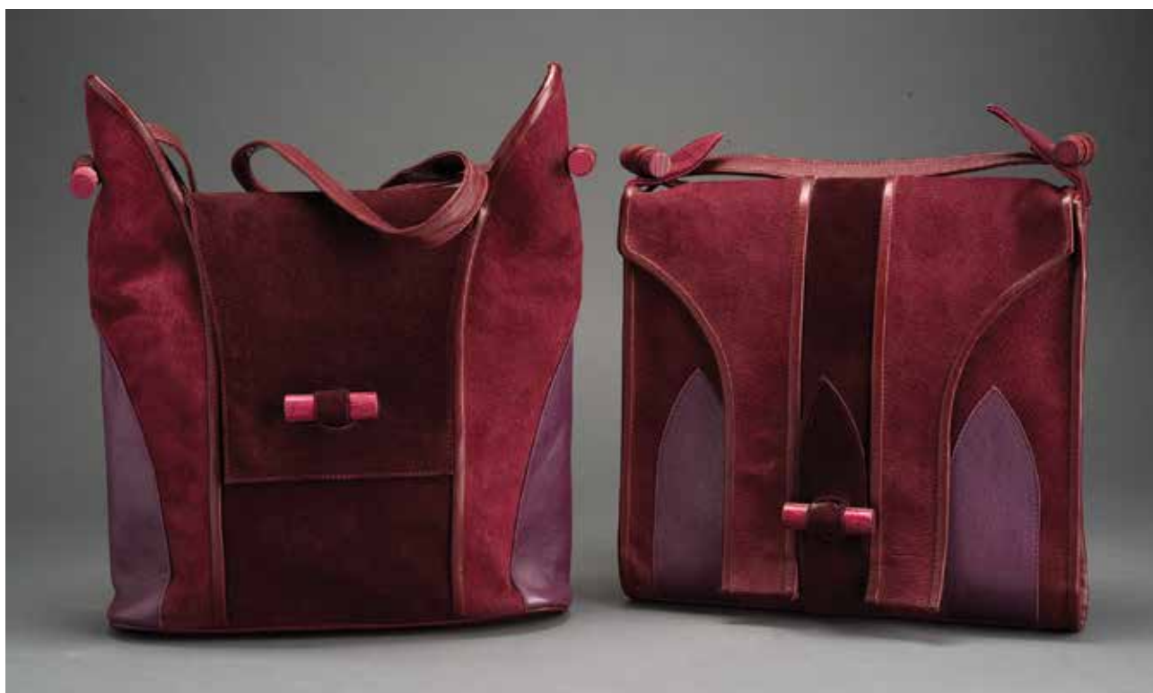
MOLNÁR Imre – MOLNÁR Éva: Női válltászkák a Bordó kollekcióból | Imre MOLNÁR – Éva MOLNÁR: Women's shoulder bags from the Wine-red collection 2001, marhabőr, juhbőr, sertésvelúr, fafelfüggesztők és -zárók