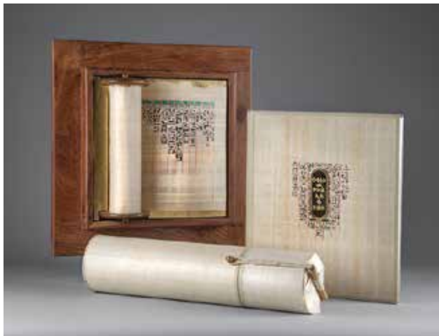
◀ MOLNÁR Imre: Falikép kézzel írt hieroglifákkal. Oklevéltartó tok. Fáraók aranya (Gold der Pharaonen) című könyv | Imre MOLNÁR: Wall-picture with handwritten hieroglyphs. Diploma case. The book 'Pharaohs' Gold' 2012, falikép: egyiptomi papirusz, fa, maratott, aranyozott fémtábla; oklevéltartó: egyiptomi papirusz borítás, selyembélés; könyv: egyiptomi papirusz, kecskebőr