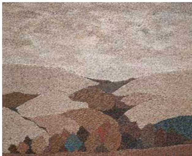
MÁLÍK Irén: Tájkép | Irén MÁLÍK: Landscape 2018, gyapjú, pamut, szövött, 100x115 cm

Kárpitjaimnál gyakran alkalmazok különböző kötéseket, vékony és vastag fonalakkal való felületgazdagítást, amennyiben az elképzelés azt megkívánja.” 2