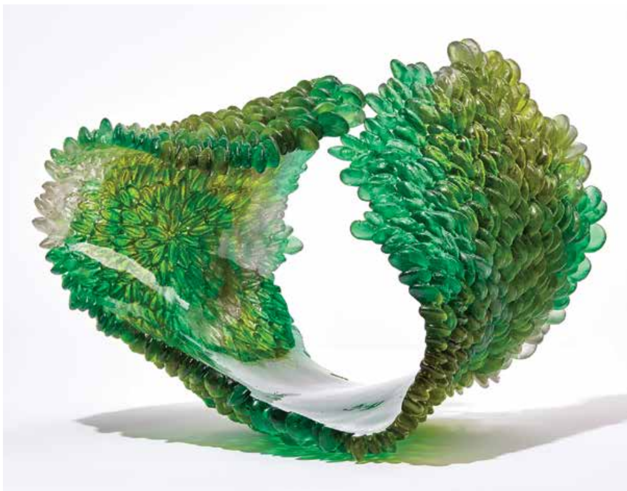
Nina CASSON MCGARVA: Green Summer | Nina CASSON MCGARVA: Green Summer | 2021, üveg, 36x40x31 cm

Az alapítvány legfontosabb projektje ugyanakkor a Homo Faber, egy olyan kezdeményezés, mely önmagában is komplex és többretegű. A projekt középpontjában egy digitális platform áll, mely egyedülálló módon tömöríti