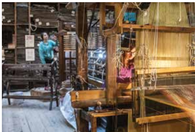
Munka a Luigi Bevilacqua szövőműhelyben Work at the weaving shop of Luigi Bevilacqua

A kézművesség hagyományainak megőrzése, továbbélése azonban mindannyiunk elemi érdeke – nemcsak azért, mert egy posztindusztriális disztópiában szükségünk lehet még az olyan képességekre, mint a kenyérsütés vagy a szövés, hanem azért is, mert az európai kultúra alapja a sokszínűség, a sokféleség, a sok évszázados tudáskincs átörökítése.