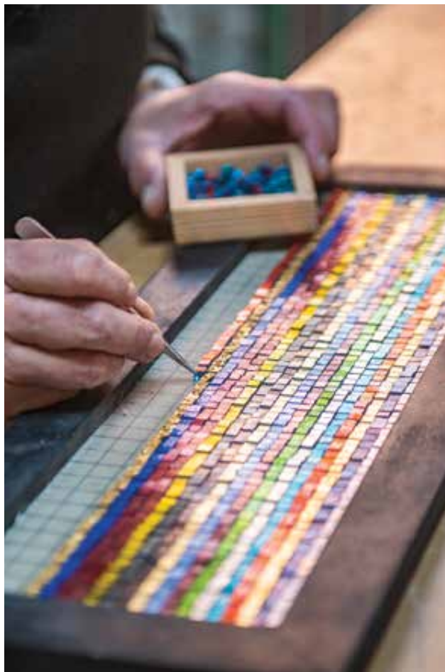
Kézműves munka közben az Orsoni Venezia 1888 mozaikkészítő műhelyben | Artisan at work in the mosaic making workshop of Orsoni Venezia 1888

Ezt ismerte fel a svájci központú Michelangelo Alapítvány is, mely céljával az európai kézműves- és iparművészeti hagyományok ápolását, megőrzését, továbbörökítését tűzte ki. Alapítója, Johann Rupert a Richemont Holding létrehozója és elnöke, ez a konszern olyan világszerte ismert luxusmárkákat tömörít, mint a Cartier, a Van Cleef & Arpels, a Piaget, a Montblanc,