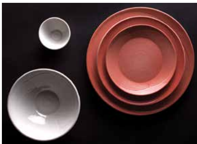
MONORI Anita: „Hidden lines” 6 darabos tálalószett (lazacszín, felülnézet) Anita MONORI: 'Hidden lines' 6-piece serving plate set (salmon colour, top view)

SUBsurface – A felszín alatt volt a kiállítás címe, a tárlat a maga nemében első és egyedülálló a világhírű