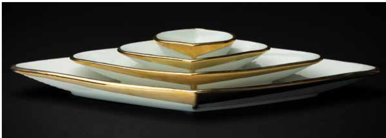
MONORI Anita: „Hidden lines” kínálótál-sorozat | Anita MONORI: ‘Hidden lines’ serving plate set 2020, öntött porcelán, festett aranydekorral, nagy tál: 3,5x42,5x19 cm, közepes tál: 3,5x29x 15 cm, kis tál: 3,5x17,5x11 cm, mély kis tál: 3,5x9,5x7,8 cm