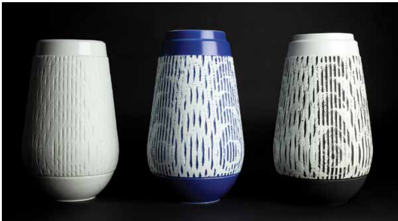
MONORI Anita: „EXPOSED” sorozat, közepes méretű vázák | Anita MONORI: ‘EXPOSED’ collection: medium vases 2021, porcelán, öntött porcelán, fújt festéssel, magasság egyenként: 28 cm