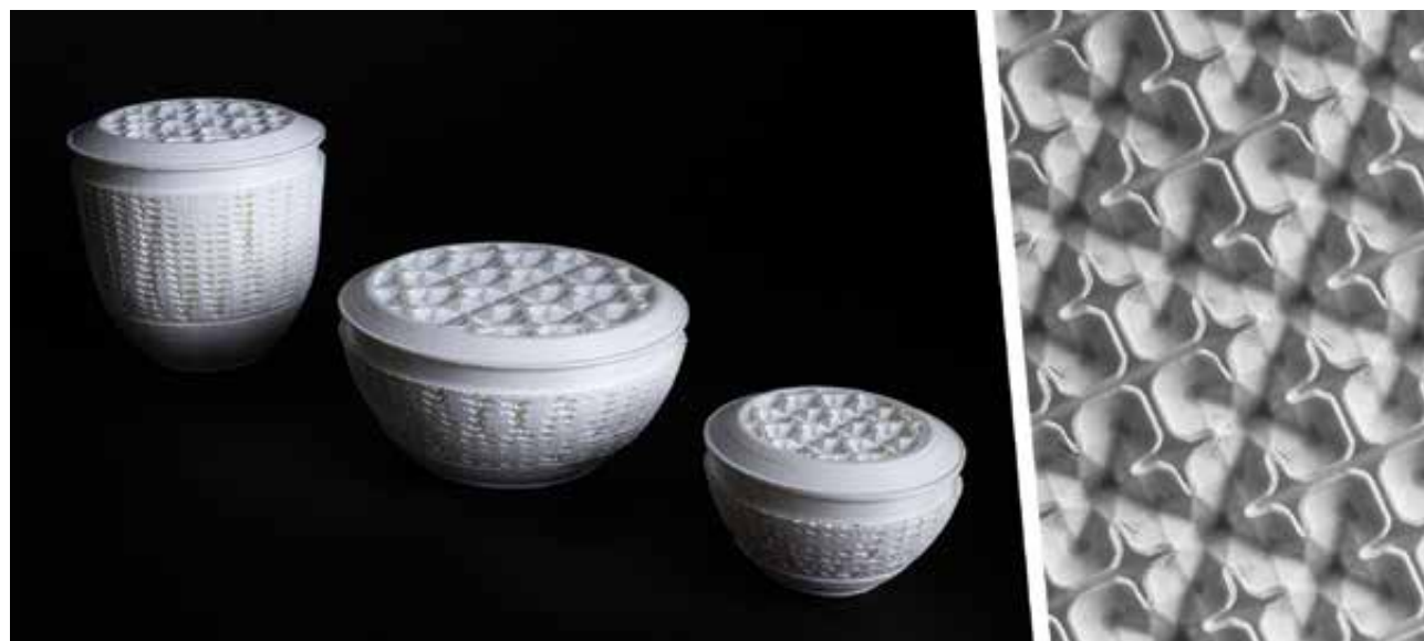
MONORI Anita: 3D nyomtatott magformák porcelándobozokhoz | Anita MONORI: 3D printed positives for porcelain boxes | 2021, PLA, 3D nyomtatás (FDM)