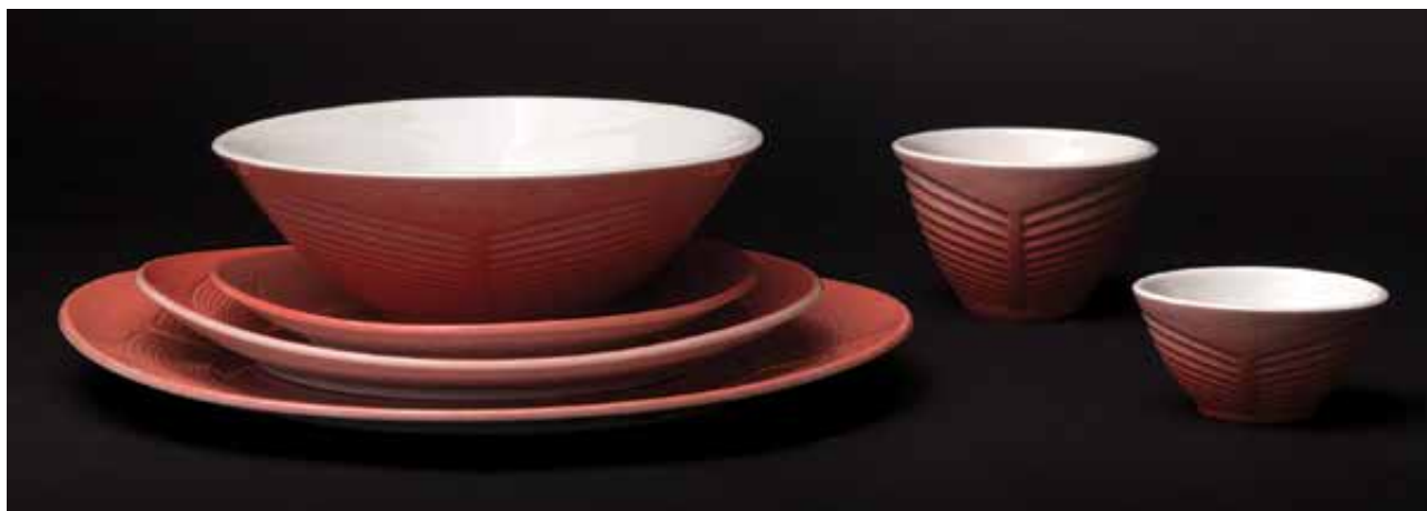
MONORI Anita: „Hidden lines” 6 darabos tálalósztett (lazacszín) | Anita MONORI: ‘Hidden lines’ 6-piece porcelain serving plate set (salmon colour) 2020, öntött porcelán, fűjt dekorral, nagy lapostányér: 2,5 x Ø 27 cm, közepes lapostányér: 2,5 x Ø 22 cm, kis lapostányér: 2 x Ø 17 cm, mélytányér: 6 x Ø 17 cm, csésze: 6 x Ø 9 cm, kis csésze: 4 x Ø 8 cm

megtorpanva a 20. században is sokat formálódott. Most pedig, más edényfélések mellett, egy fiatal tervező érdeklődésének középpontjába került. Azért van ennek kiemelt jelentősége, mert új tendenciát jelez. Számos helyen – e szaklap hasábjain is – írtam már arról, hogy az elmúlt több mint fél évszázadban a hazai és a nemzetközi kortárs kerámiaművészetben a képzőművészeti jelleg vált dominánssá. Így olyan, az ősidőktől kezdve lényeges, klasszikus kerámiatípusok kerültek egyre inkább perifériára, mint az edény . Az utóbbi két évtizedben azonban, talán épp erre való válaszként, a honi palettán több fiatal művész jelent meg, akik kifejezetten a funkcionális tárgytervezésre fókuszálnak. A kecskeméti Nemzetközi Kerámia Stúdió (NKS) korábbi művészeti vezetője, Szegedi Zsolt egyrészt az ő támogatásukra indította útjára a nemzetközi designszimpoziumokat, figyelembe véve az intézményi gyűjteményezést is, hiszen korábban a világhírű kollekcióban designtárgy alig volt fellelhető.