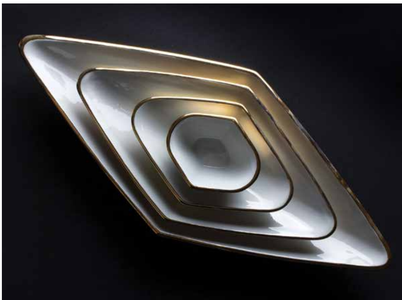
MONORI Anita: „Hidden lines” kínálótál-sorozat (felülnézet) | Anita MONORI: ‘Hidden lines’ serving plate set (top view)