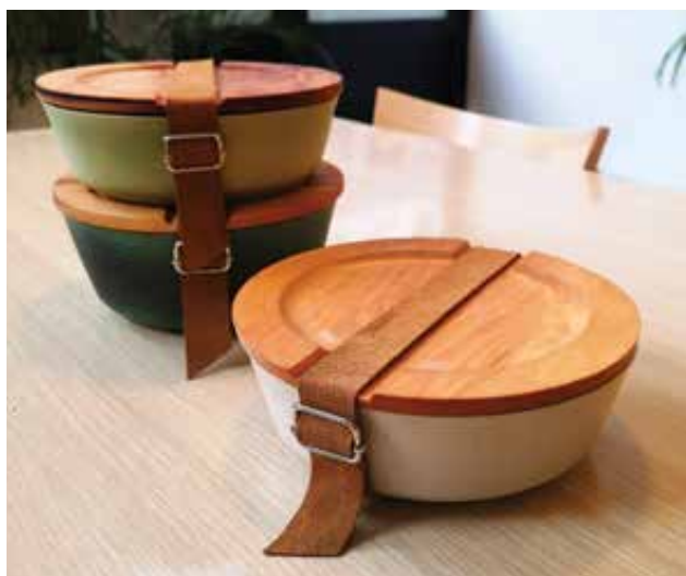
STROHNER Jázmin Szonja: Háromrészes kerámia éthordószett fafedővel Jázmin Szonja STROHNER: Three-part ceramic dinner-carrier with wooden lid 2021, samottos agyag, égerfa fedő, bőr/gumi pánt, a tálak átmérője: 18 cm

A pályázati kiírásnak megfelelően 2021-ben is tíz fiatal kézműves iparművész kapott lehetőséget arra, hogy egy teljes éven át új anyagokkal, formákkal, technológiákkal kísérletezzen, kibontsa és megvalósítsa valamely régebb óta dédelgetett vagy újonnan körvonalazódó ötletét, és eladható tárgykollekcióvá vagy autonóm műalkotássá fejlessze. Valamennyi ösztöndíjas nagyon hasznosnak ítélte a kutatás, tervezés, kivitelezés során szerzett új ismereteket, gyakorlati tapasztalatokat, és arra törekedett, hogy innovatív értéket teremtsen.