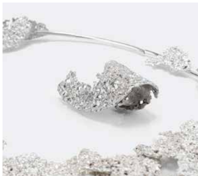
HORÁNYI Kinga: IKIIKI sorozat, gyűrű és nyakék (részlet) Kinga HORÁNYI: IKIIKI series, ring and necklace (detail) 2021, ezüsthab, öntés, nyakék: 20x14 cm, gyűrű: 6x2,3 cm

Horányi Kinga az IKIIKI elnevezésű ékszerkollekciónak (jelentése: élénk, élettel teli) új ékszertípusokkal való bővítését, valamint a közfoglalás és az anyagban rejlő új forma- és színlehetőségek kutatását tűzte ki célul. Az idetartozó, eddigi ékszerei erőteljes színűek, kis méretűek, alapformájuk főleg szabályos geometriai test vagy síkidom, ezért a művész az ösztöndíj ideje alatt nagyobb méretű ékszertípusokat kívánt megalkotni.