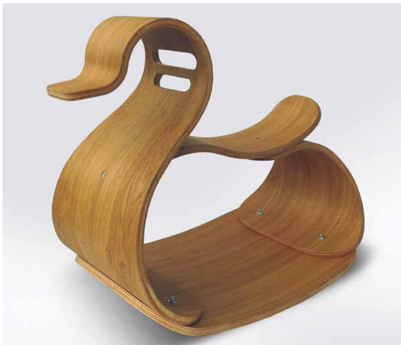
ZSADÁNYI Janka: Hintakacsa | Janka ZSADÁNYI: Rocking duck | 2021, rétegelt lemez és tölgyfurnér, hajlítottfa szerkezet, 62x57 cm

Varga Gyöngyvér Amala is autonóm képzőművészként tevékenykedik. A tavalyi évben ő is harmadszor nyerte el a Kozma Lajos Kézműves Iparművészeti Ösztöndíjat.