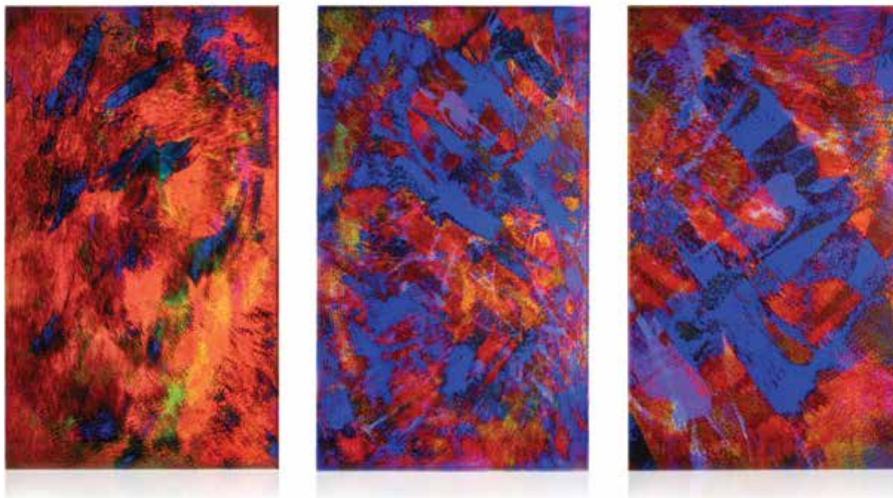
VARGA Gyöngyvér Amala: RISE & SHINE I–V. (részlet) | Gyöngyvér Amala VARGA: RISE & SHINE I–V (detail) 2021, ragasztott, csiszolt, savazott üveg és print, egyenként: 50x29,8x4 cm