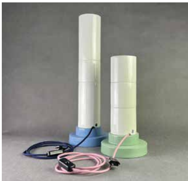
STROHNER Márton / Mastrodesign: Collection light – Tower lamp I., II. Márton STROHNER / Mastrodesign: Collection light – Tower lamp I, II 2021, öntött, színezett porcelán, 58x18 cm, 38x18 cm