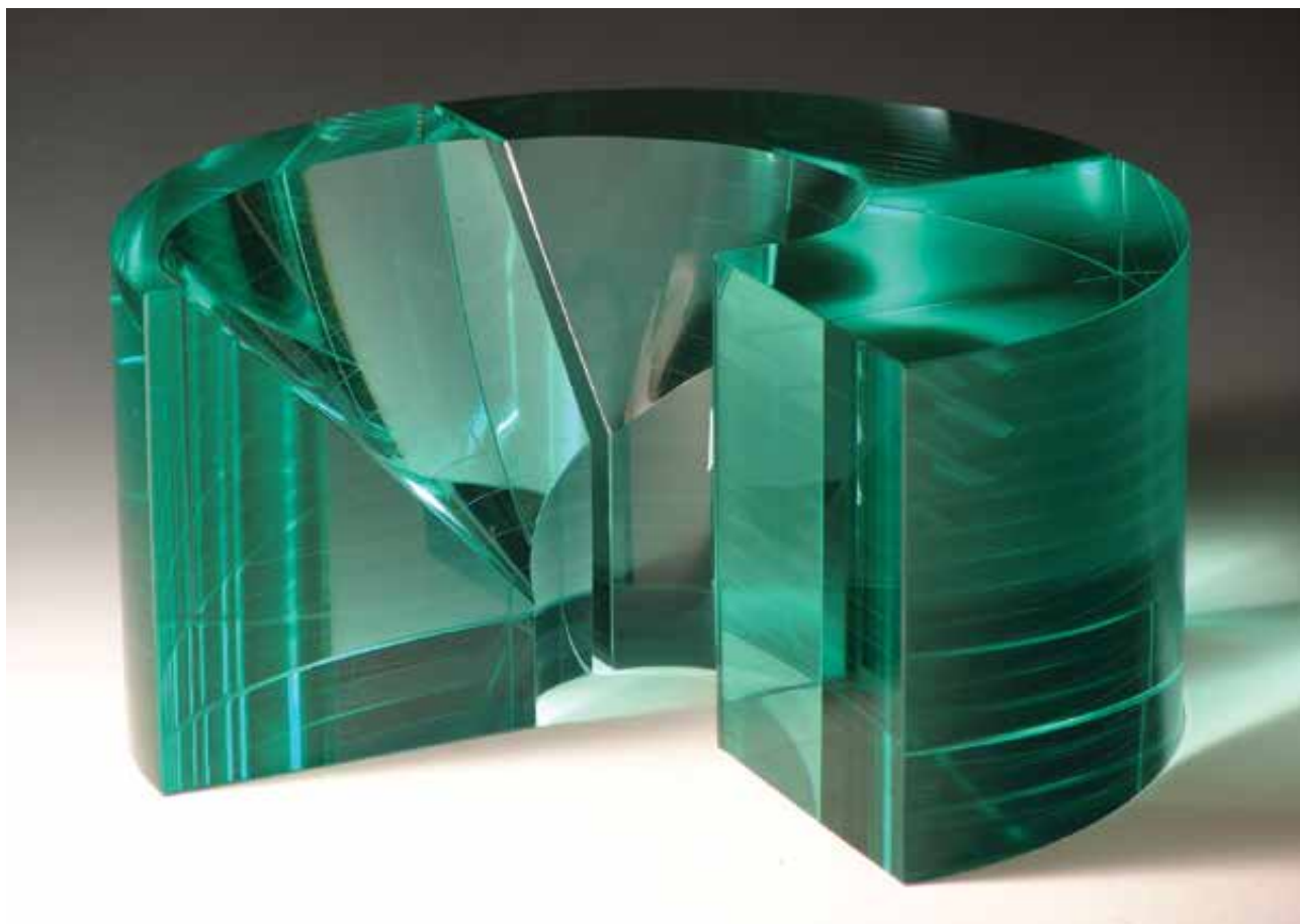
BOHUS Zoltán (1941–2017): Térspirál | Zoltán BOHUS (1941–2017): Spatial Spiral 1977, ragasztott, csiszolt, polírozott üveg, 15x30x30 cm (Bohus–Lugossy Alapítvány a Kortárs Üvegművészetért, Budapest) Fotó: Bohus Zoltán

is megérdemelne egy külön szalont! A nyílt beadású rendszer a jelenlegi formájában az iparművészet területén, úgy gondolom, fizikailag is kivitelezhetetlen. A hely adottságai miatt a tíz szakmából 30-40 alkotót lehet eleve meghívni, ami aránytalan torzítást okoz a szakmák nagyságrendjének magyarországi jelenlétében. Ha egalizálni kellene a beadási számokat, akkor ismételt az önkényesség válik fokmérővé, mert dönteni kell, hogy kit és mit hagyunk ki a válogatásból. Maga a fogalom is vitatható, hogy mi az iparművészet és mi a design, pláne, hogy milyen tárgyak reprezentálják mindkettőt egyszerre. A klasszikus szalont a speciális és történetileg sohasem szalonműfajnak számító iparművészet tekintetében akkor lenne értelme nyílt beadású rendszerben lebonyolítani, ha rendelkezésre állna akkora terület, hogy a műfajba sorolt szakmák válogatás nélkül meg tudnának mutatkozni. Ebben az esetben legalább 1000-1200 kiállítóról lenne szó, és nemcsak alkotók egy-egy tárgyáról, hanem tárgykollekciókról és kontextusba helyezett designról kellene beszélni. Nagyságrendjét tekintve a Hungexpo területére lenne szükség. Véleményem szerint ezt meg lehet, és meg is kellene csinálni, de akkor mellé kell rendelni egy kereskedelmi célt is, mint egy art fair esetében, hisz