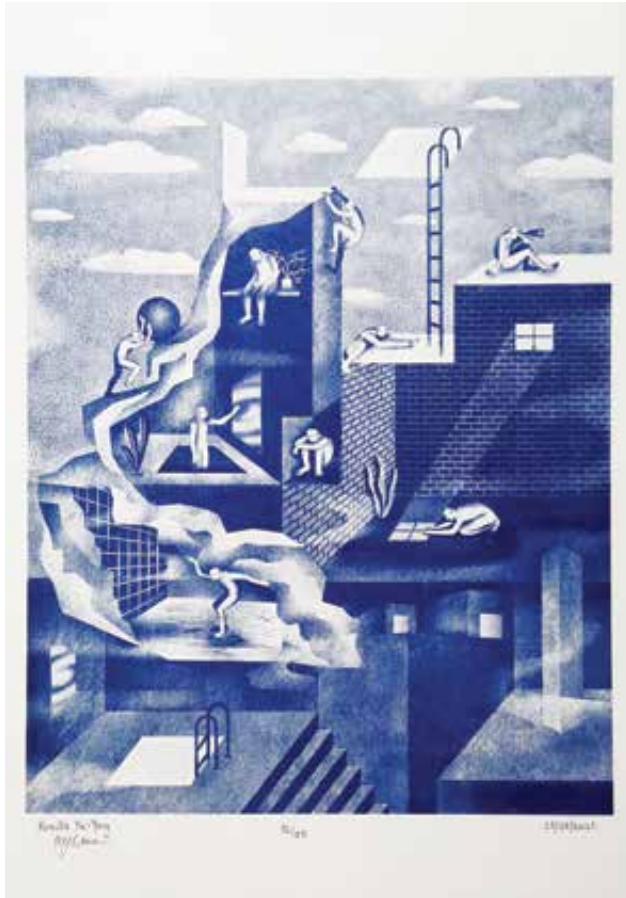
HU-YANG Kamilla: Határ/Határtalan | Kamilla HU-YANG: Limit/Unlimited 2021, digitális grafika, rizográf nyomtat, A3