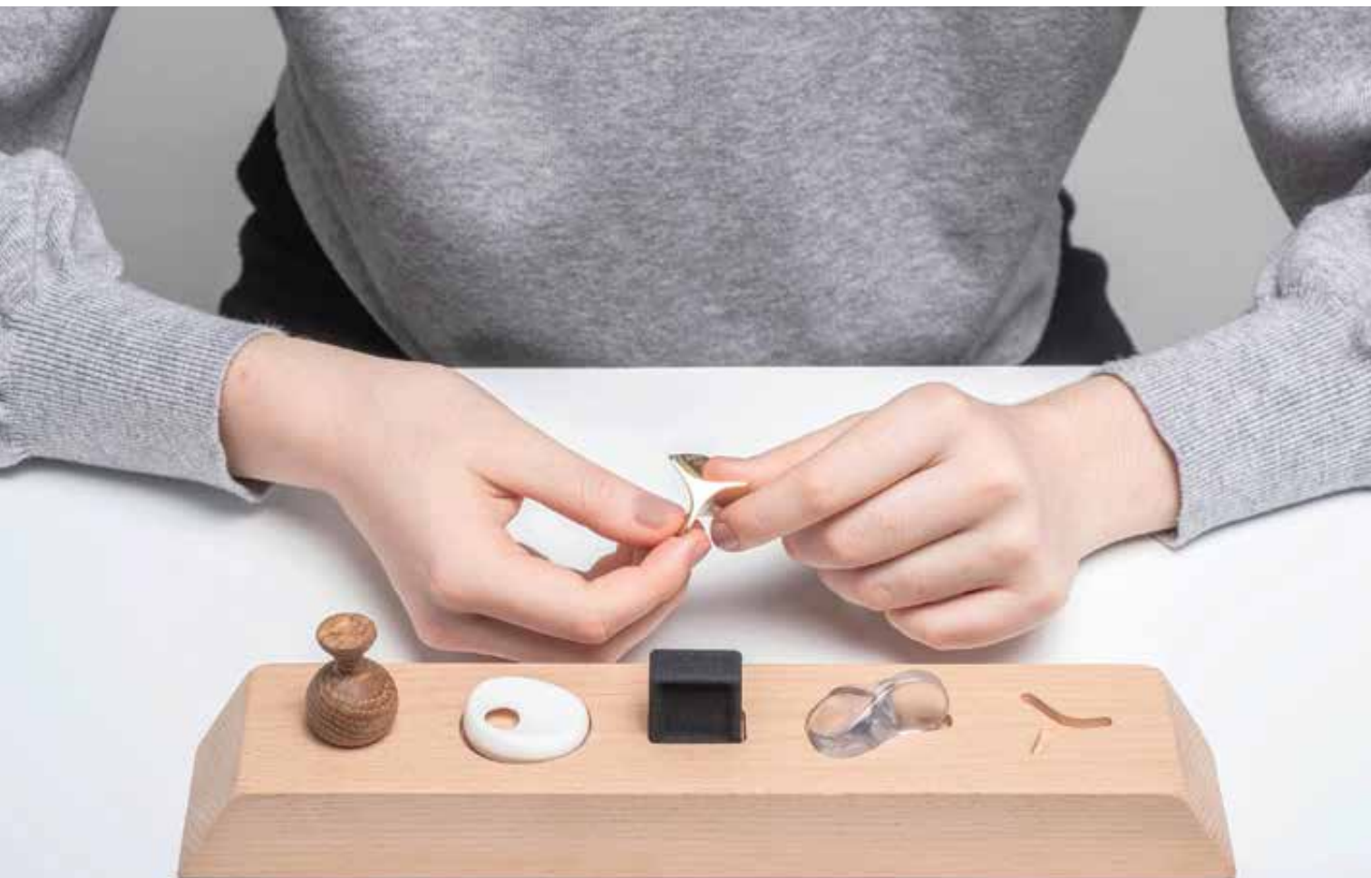
CSISZÁR Kata: Tactility projekt, toolkit Kata CSISZÁR : Tactility project, toolkit 2021, tölgyfa, négytengelyes CNC-marás; üvegszemcsékkel töltött poliamidpor, Ultrasint TPU 90A-01 (hőre lágyuló poliuretán), TuskXC2700T (kék árnyalatú áttetsző műanyag), 3D nyomtatás; sárgaréz, keményviasz-formázás, öntés; befoglaló méretek: 3-4 cm; bükkfa tároló: háromtengelyes CNC-marás, 30x5,5 cm