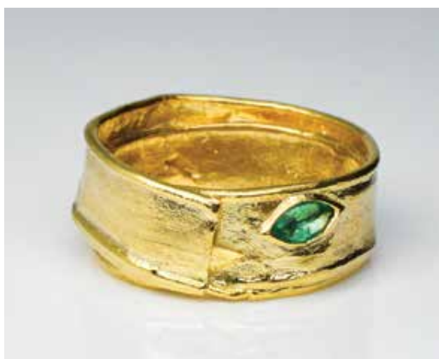
TASI Dénes Manó: Tea Time, gyűrű | Dénes Manó TASI: Tea Time, ring 2022, galvanizált ezüst, smaragd, teatasakok zárószalagjáról vett öntőminta, precíziós öntés, galvanizálás