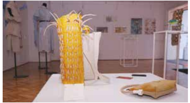
^ Fresh FISHes XIV/A című kiállítás (részlet). Az előtérben KIS-BARAKSÓ Alexandra tárgyai (Szövedéktároló objekt 01, Konstant hátitáska és Nest kistáska), a háttérben a falon PUSZTAI Diána illusztrációi The showing Fresh FISHes XIV/A (exhibition photo). Front: objects by Alexandra KIS-BARAKSÓ (Web storing object 01, Constant backpack and Nest handbag), background: Diána PUSZTAI 's illusztrációi FISE Galéria, Budapest, 2022