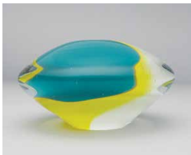
ZILAHÍ Antal: Trimurti | Antal ZILAHÍ: Trimurti 2021, üveg, hutaüvegfújás, 9 x Ø 15 cm

Ezt 2022 januárjában is megtapasztalhattuk, kétszer is. A falon elhelyezkedő és térbe kíváncszó alkotások egyensúlyának fontossága meghatározta, merre