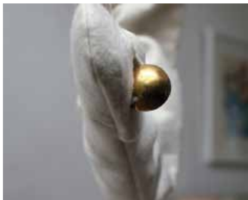
BONCZ Luca: A nyomás bennem... (részlet) Luca BONCZ: The pressure in me... (detail) 2021, műbőr, gyapjúfilc, fonal, zsinór, réz, tüll, varrás, hímzés, horgolás, ötvöstechnikák, változó méretek