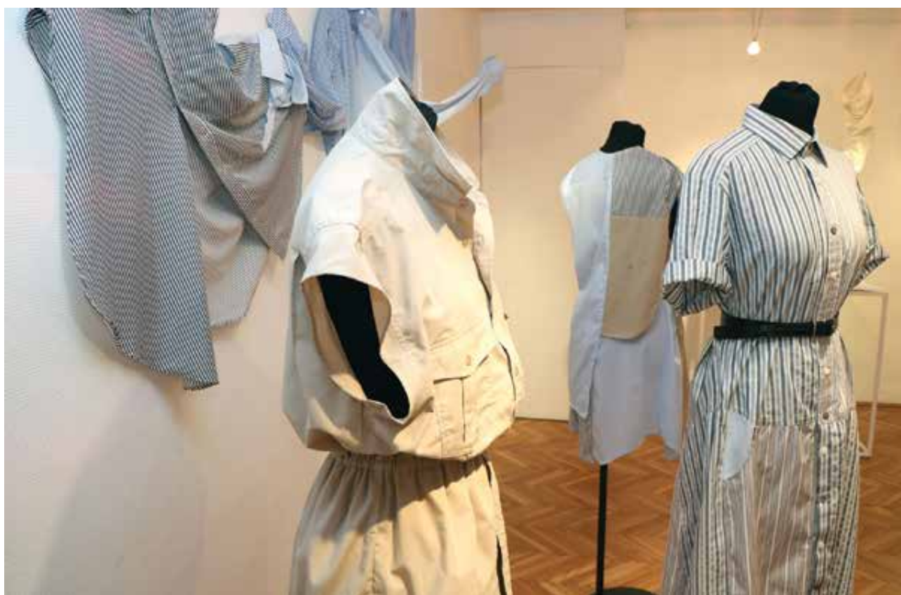
BALOGH Dóra: FOLD'21 Hibriditás variációk | Dóra BALOGH: FOLD'21 Hybridity variations 2021, újjrahasznított ingek, egyedi szabászati megoldások, S-es méret