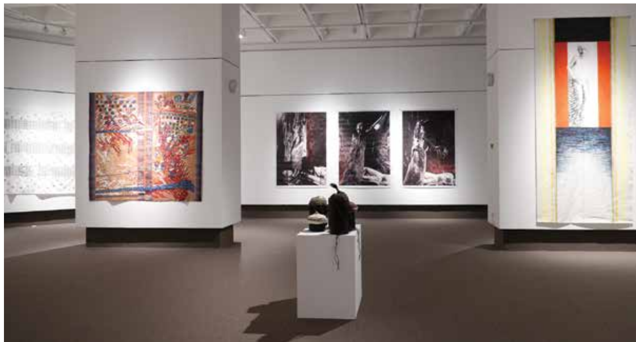
A szombathelyi textilbiennálék és textiltriennálék 50 éve fal- és tértextilekben elbeszélve című kiállítás (részlet) 50 years of the textile biennials and triennials in Szombathely told in wall and space textiles (exhibition photo) Szombathelyi Képtár, Szombathely, 2022