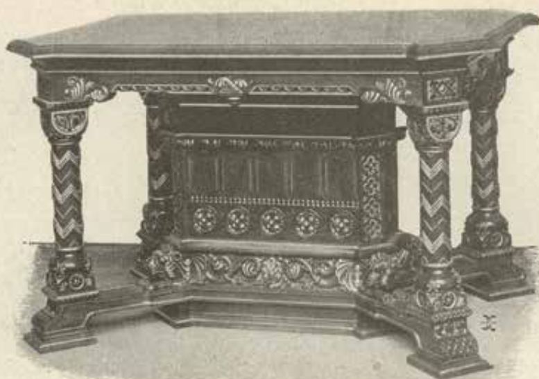
A SZENT ISTVÁN-SZOBA BŰTORAI.