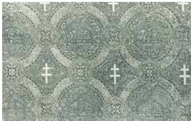
„A Szent István-szoba fali kárpitja. Tervezte Hauszmann Alajos tanár. Készítette Haas F. és fiai aranyosmaróthi gyára” | 'Wall hanging of St Stephen's Hall. Designer: Prof. Alajos Hauszmann. Produced in the Aranyosmarót factory of Haas F. and Sons'

A fali aranybrokát szövet Haas Fülöp és fiai aranyosmaróthi szövőgyárában készült. Első eset, hogy hazánkban ily előkelő minőségű aranysejtem szövet gyártatott, és fényes bizonyítéka annak, hogy iparunk erre is képes, csak igénybe kell azt venni.**