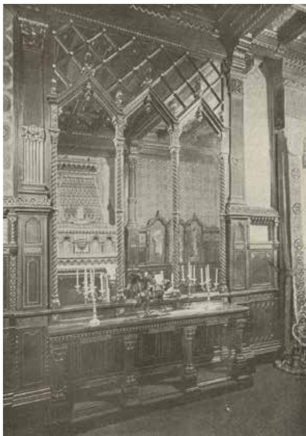
„A Szent István-szoba nagy tükrre” | „The great mirror of St Stephen's Hall”