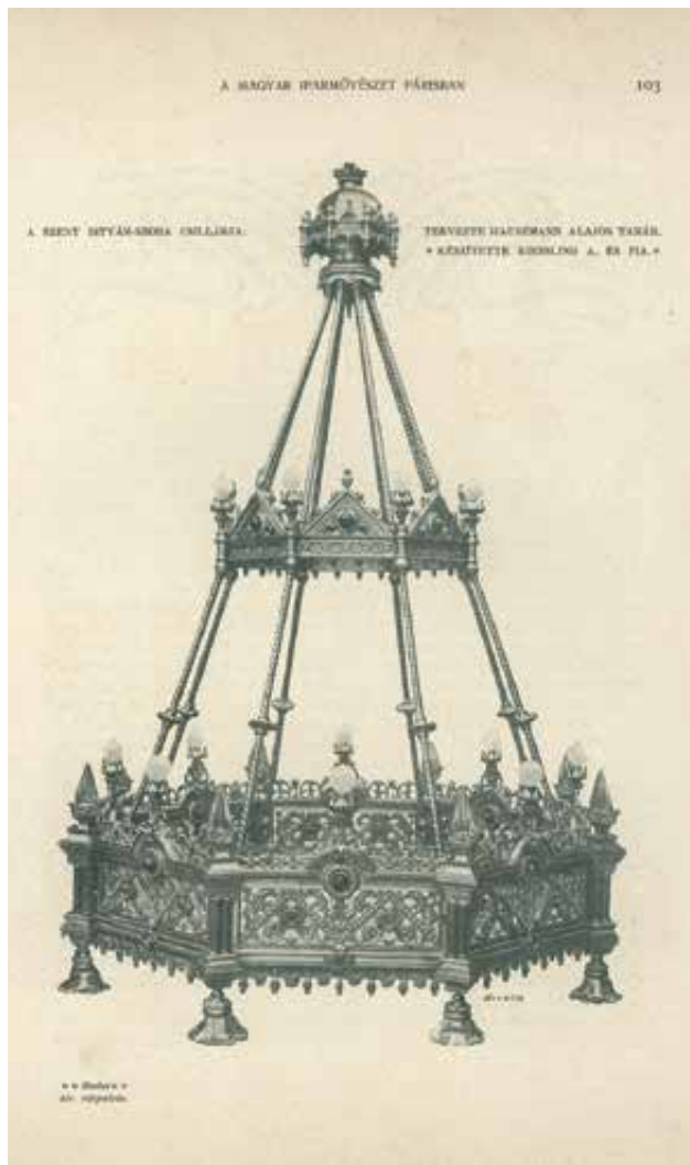
„A Szent István-szoba csillárja. Tervezte Hauszmann Alajos tanár. Készítette Kiessler A. (sic!) és Fia” | ‘Chandelier of St Stephen’s Hall. Designer: Prof. Alajos Hauszmann. Produced by Kiessler A. (sic!) and Son’

Roskovics Ignác festőművész festette az Árpád-ház nagy alakjainak képeit. Ezek: Szent Imre (a szent ifjuság jelképe), I. Béla az 1051 – 1052-iki (sic!) nemes háború