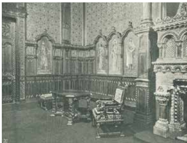
„A Szent István-szoba sarka” | 'Corner of St Stephen's Hall'

A szoba famunkáját Thék Endre készítette. Thék, a ki hazai faiparunk legkiválóbb képviselője, ez alkalommal is igazolta, hogy hirvének meg tud felelni. Nem kimélt fáradságot, hogy rengeteg fakészletéből kiválaszta a legjavát és abból készítse meg a szobát. A válogatott magyar diófa úgy színével, valamint faragványainak finomságával tökéletesen megfelel a román stílus jellegének. A hatást fokozza a pontos összeépítés és a kifogástalan remek munka, melynek minden részén meglátszik, hogy szeretettel készült. A fa-alkotórészek közé betét gyanánt alkalmazott s Roskovics királyképei után készült nagy majolika-lemezek s egyéb majolika-részek, valamint a nagy kandalló, Zsolnay Vilmos pécsi gyárából kerültek ki. Mennyi munkával járt ez és hány próbára volt szükség, míg különösen az aránylag nagyméretű királyképek sikerültek, hogy a majolika-lemezen levő kép hű utánzata lett az eredeti festménynek még a színek árnyalatában is, ezt csak szakember tudja kellően méltányolni. De Zsolnay megküzdött minden nehézséggel és gyárának magas fejlődését és képességét fényesen beigazolta. A kandalló