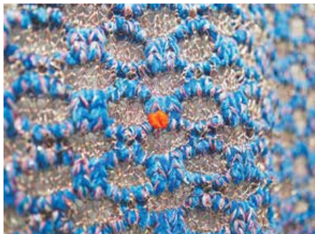
GYÓRBÍRÓ Csenge: Kötött struktúrák (részlet)

Csenge GYÓRBÍRÓ: Knitted structures (detail)