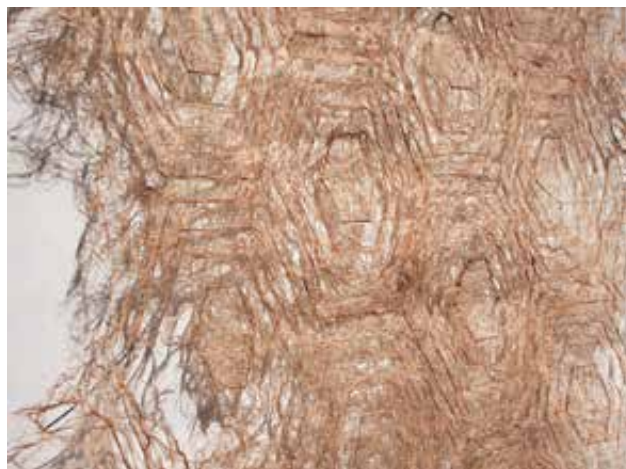
PAPP Anett: Grassifical (részlet)