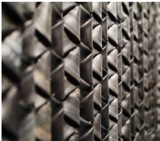
ELEK Ágnes: Panelek (részlet) | Ágnes ELEK: Panels (detail) 2021, bicikli-belsőgumi fémkereten, egyedi csomózás, a teljes mű: 50x50 cm

együttműködésben olyan válogatás született meg, amelynek darabjai megfeleltek a kiállítóhely igényeinek, és a téma határátlépő szándékainak. Ennek mentén kerülhetett egymás mellé műanyag és gyapjúfilc, árammal szöveget kirajzoló speciális textil és hagyományos kötött struktúra, lágyan hajló fonalvezetés és rigid vázszerkezet.