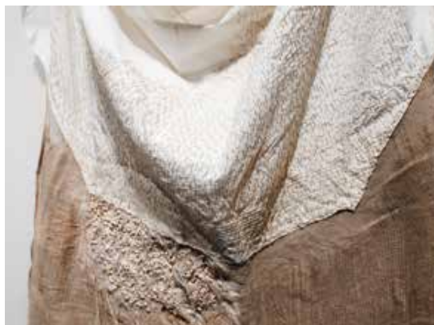
MÁRFÖLDI Dóra: Szövény (részlet)