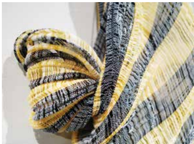
TSUR Dorina: Retikulum (részlet)