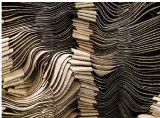
TÓTH Dominika: Pozitív megnyugvás (részlet)