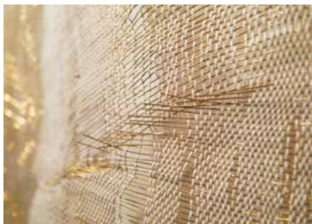
VÉSSEY Anna: Négyen közülünk (részlet) / Four of us Anna VÉSSEY: Four of us (detail) 2018, pamut, sárgaréz, a teljes mű: 200x200 cm

vagy fűgyökér? A fém és pamut közössége ugyanannak tekinthető, mint a gyapjúfilc ölelése?