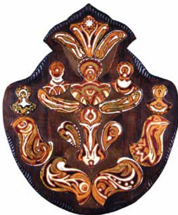
MORELLI Edit: Siva | Edit MORELLI: Shiva 1975 után, fa, zománcozott vörösréz, 73x60 cm

A Cifrapalota három első emeleti termében igyekeztünk – a lehetőségeinkhez mérten – az életmű folyamatát kronologikusan érzékeltetni, formai párhuzamokat, tematikai összefüggéseket felmutatni. Emellett azonban hangsúlyt helyeztünk az alkotó emberi oldalának, személyes történetének a bemutatására is egy, a kiállításban elhelyezett képernyőn folyamatosan vetített, megközelítőleg hatperces képszeállítás segítségével. A szöveges dokumentumok mellett a hosszabb-rövidebb magyarázatokkal kísért fényképek jelentős részén a művész jelent meg, egy 1943-as családi fotótól kezdve, egészen a 2015 augusztusában a Tűzzománcművészek Magyar Társasága kecskeméti workshopján általunk készített felvételekig, melyeken az Égből jöttem című alkotásnak 820 Celsius-fokos kemencéből való kivételét örökítettük meg négy lépésben. Egy nagy méretű asztali vitrinben fémmegmunkáló szerszámokkal, zománcozáshoz szükséges eszközökkel, ecsetekkel, égetéshez használt fogókkal, fémrecipiensekkel (vörösréz, lelapozott acéllemez), kísérleti és félkész alkotásokkal (köztük ékszerekkel) a művész egykori műhelyét is megidéztek. Ezzel is figyelmeztetve a látogatókat arra, hogy bár a kortárs magyar zománcművészek többsége, felismerve az új lehetőségeket, erőteljesen képzőművészeti irányba orientálódik, azonban a műfaj legjelentősebb képviselői – így Morelli Edit is – soha nem tagadták meg annak iparművészeti eredetét sem.