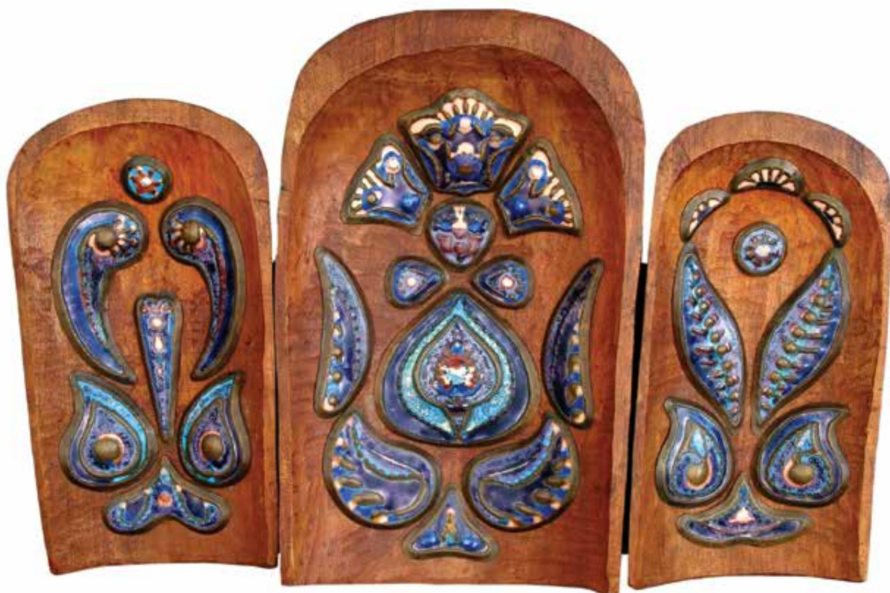
MORELLI Edit: Motivumok | Edit MORELLI: Motifs 1973, fa, domborított és zománczott vörösréz, 33,5x49 cm

használtuk az „életművet” jelzőként, ugyanis a tárlat „csupán” három gyűjteményre – a család, a kecskeméti Nemzetközi Zománcművészeti Alkotóműhely és a Kecskeméti Katona József Múzeum birtokában lévő művekre – támaszkodott. Mivel Morelli alkotásainak jelenleg mennyiségileg, s különösen minőségileg, ez a