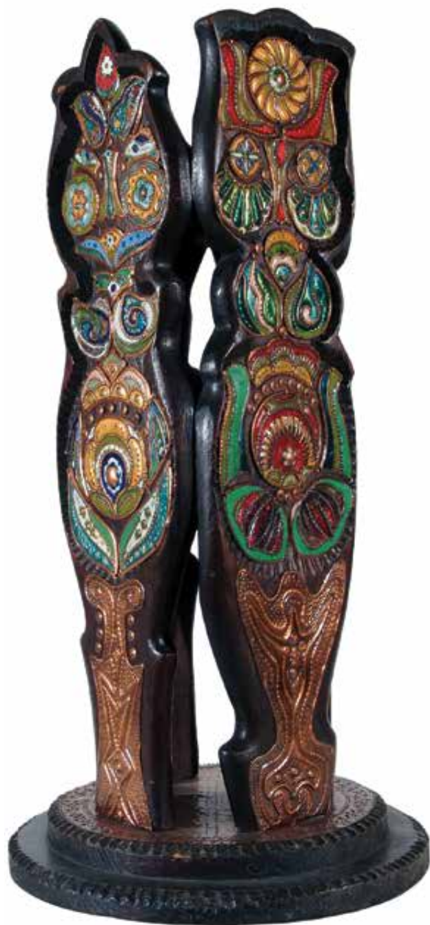
MORELLI Edit: Négy évszak. Népművészetet szimbolizáló térkompozíció 1:5 léptékű terve, Érsekkert, Kalocsa | Edit MORELLI: Four seasons. 1:5 scale plan of the composition symbolizing folk art, Archbishop's garden, Kalocsa | 1976, fa, zománcozott vörösréz, magasság: 64 cm, talp: Ø 32 cm

három legfontosabb forrása, így az összképet tekintve nem hiányoztak az elsősorban magántulajdonban található darabok. Mindenesetre a művek későbbi szétszóródását megelőzendő, így a további kutatásokat elősegítendő, fontos lenne, hogy a következő években minél több főmű kerülhessen közgyűjteménybe, mindenképp a zománcművészettel kiemelten foglalkozó kecskeméti múzeumba.