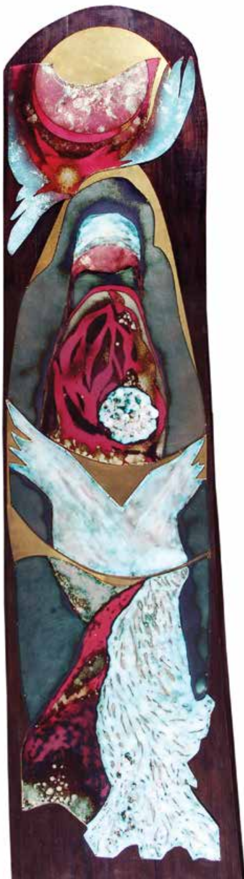
MORELLI Edit: A többi: hazugság | Edit MORELLI: The rest is Untruth 1998, fa, zománcozott vörösréz, 179x46 cm

szerveződésű, dekoratív kompozíciókat (pl. Siva, Fekete Madonna, Négy évszak ) hozott létre. Meghatározó volt művészi pályafutására nézve, hogy meghívottként ott lehetett 1975–1977 között Kecskeméten, a Kátai Mihály által alapított és vezetett (Nemzetközi) Zománcművészeti Alkotótelep első három szimpóziumának résztvevői között (többek között Ásztai Csabával, Deim Pállal, Lantos Ferencsel, Petrilla Istvánnal, Turi Endrével). Éppen ezért (is) művészettörténeti szempontból az emlékkiállítás egyik legértékesebb része az a hat darab együtt bemutatott alkotás ( Kék tulipán, Kígyós tulipán, Kunbaba, Médium, Rozetta lóval, Varázsló ) volt, melyek 1975 nyarán az I. Zománcművészeti Alkotótelepen születtek 5 . 1976-ban és 1977-ben is építészeti programok jellemezték a telepet, melyek közül az előbbire egy zománccfríz tervét, míg az utóbbira („tájékoztató formák”) 6 egy zománcozott házszámtáblát tudunk példaként kiállítani.