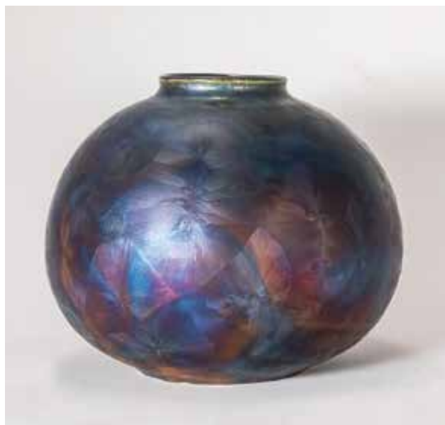
BARTHA István: Redukciós kristálmázás váza István BARTHA: Raku crystal glaze vase | 2021, porcelán, korongozott, mázazott, magasság: 18 cm Fotó: Bartha István