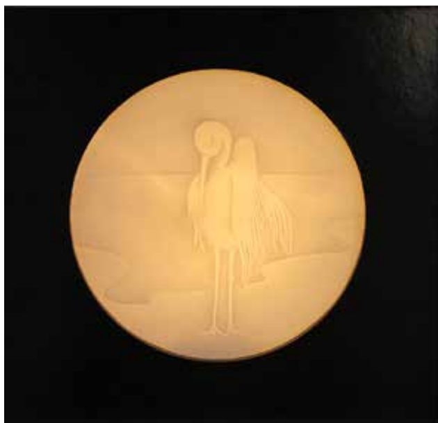
F. OROSZ Sára: Készülődés, litofán relief Sára F. OROSZ: Getting ready, litophane relief 2021, szilikátszarmazék, litofán-technika, 30x30x12 cm