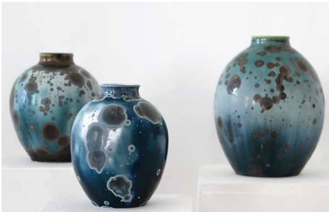
BARTHA István: Kristálymázás vázák | István BARTHA: Crystal glaze vases | 2021, porcelán, korongozott, mázazott, magasság: 25–28 cm