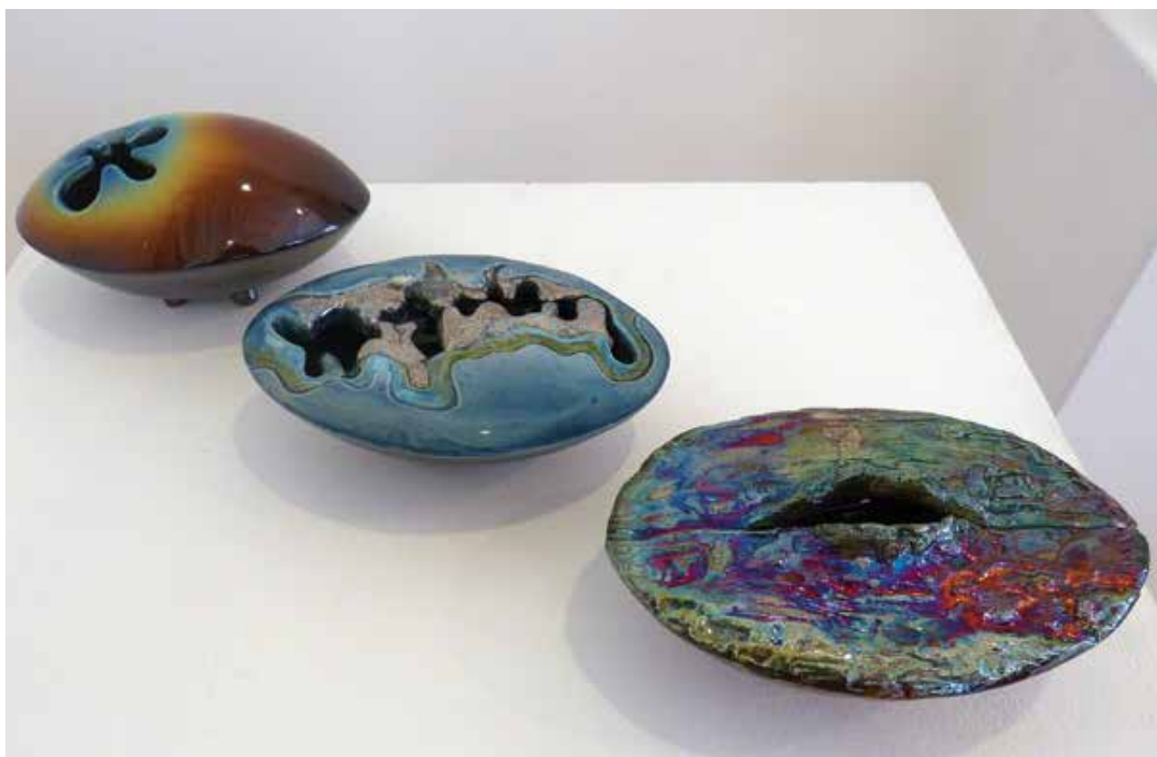
BORSÓDY Eszter: Tűz, Víz, Föld, Ikebanaedények | Eszter BORSÓDY: Fire, Water, Earth, Ikebana vessels | 2021, samott, kézzel formált, platinalüszteres, mázazott, rakutechnika, magasság: 7–11 cm