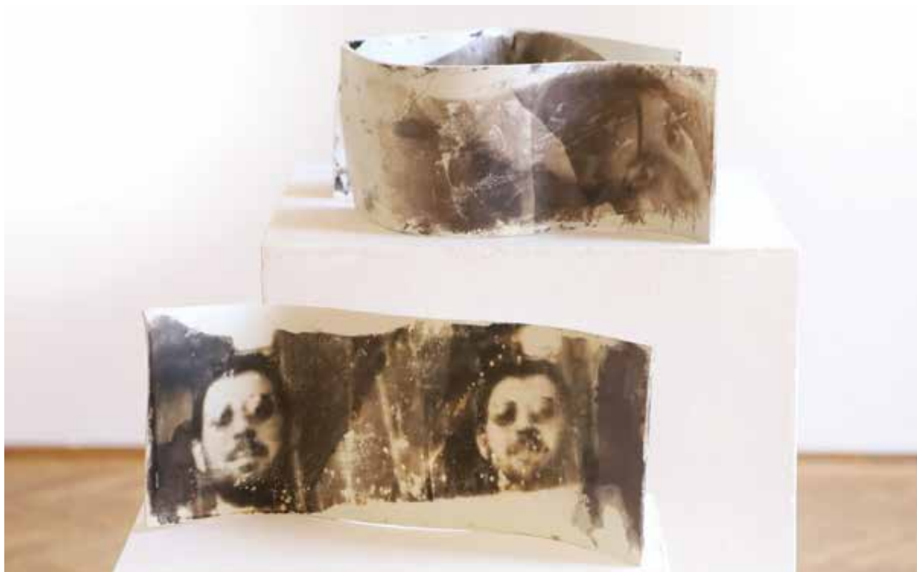
SZŐCS Éva Andrea: Nostalgia | Éva Andrea SZŐCS: Nostalgia | Imerys massa lapok, fotókerámia, magasság 17–19 cm