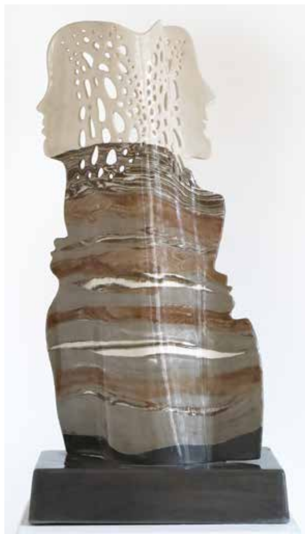
TÓVÖLGYI Katalin: Viszonyok | Katalin TÓVÖLGYI: Relations 2020, félporelán, kézzel formált, nerikomi-technika, 50x24,5x16 cm