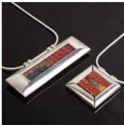
KIRÁLY Fanni: „Afgán” textilmentő ékszersorozat, függők Fanni KIRÁLY: 'Afghan' textile-saving jewelry set, pendants 2003, ezüst, csomózott szőnyeg (balra) és hímzett textil, függők: 3,3x7,5x0,8 cm és 3,2x3,5x0,6 cm