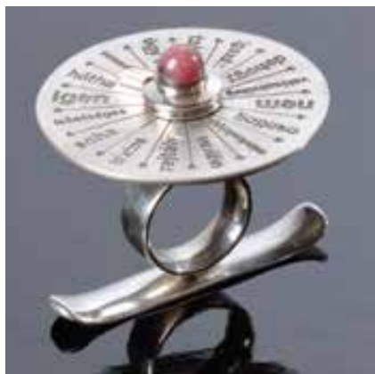
DÁVID Attila Norbert: Sorsfordító gyűrű Attila Norbert DÁVID: Fate-changing ring 2006, ezüst, acél csapágy, rózsakvarc, gyűrű: Ø 1,8 cm, ékítmény: Ø 5,4 cm