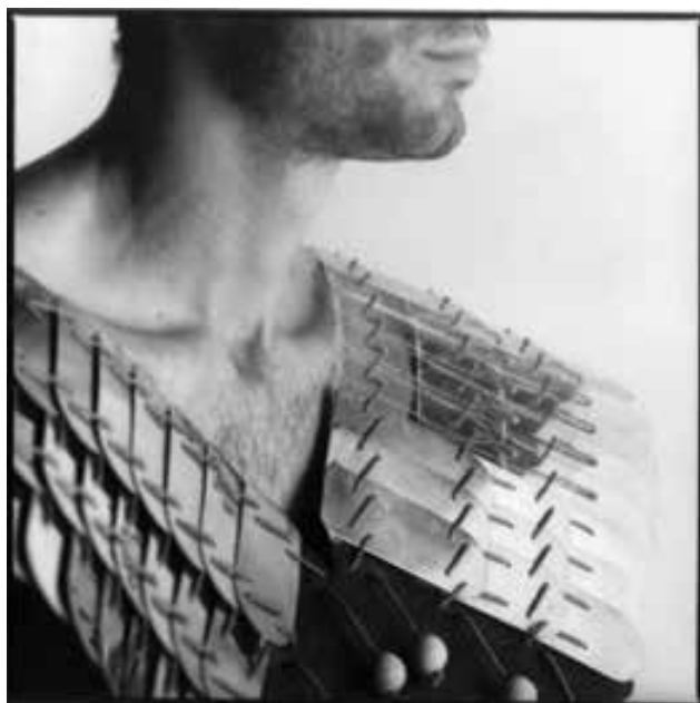
EGRİ Zoltán: Palást (hallgatói munka) | Zoltán EGRİ: Mantle (student's work) 1986–1987, fa, plexi, sárgaréz, zsinór, 70x70x2,5 cm