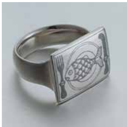
STOMFAI Krisztina: HalvacSORA gyűrű | Krisztina STOMFAI: Fish-dinner ring 1996, ezüst, niello