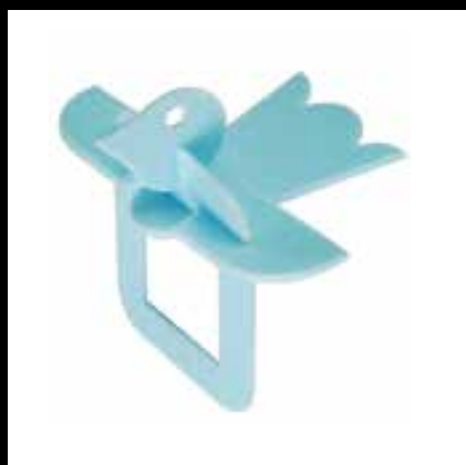
LIPÓCZKI Ákos: LIPI ZOO. Hajtogatással összeállítható, állatfigurás ékszerkollektívó gyerekeknek (diplomamunka, témavezető: Péter Vladimír, konzulens: Bánfalvi András) Ákos LIPÓCZKI: LIPI ZOO. Foldable jewelry collection of animal figures for children (diploma work, supervisor: Vladimír Péter, consultant: András Bánfalvi) 2003, 0,08 cm-es Evacast polipropilén lap, magasság átlagosan: 4 cm