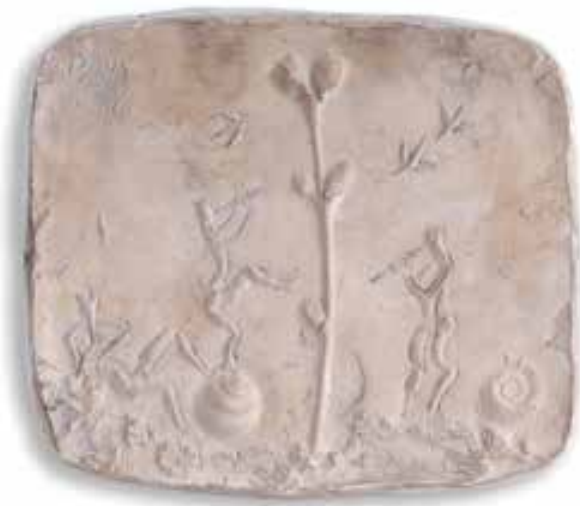
BORSOS Miklós: Zenélő faunok | Miklós BORSOS: Fauns Playing Music 1958, gipsz, 12,5x14 cm