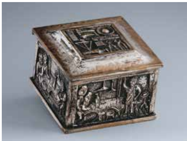
JAJESNICA Róbert: Borsos-doboz (oldalain ötvösszerszámok és ötvösműhely ábrázolásával) | Róbert JAJESNICA: Box. Homage to Miklós Borsos (with renderings of metal artists' tools and workshop on its sides) 1959, vörösréz, ezüstözött, 5,5x8,5x8,5cm