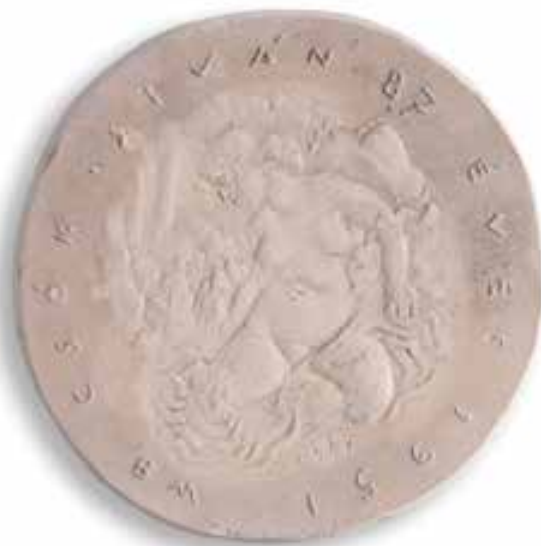
BORSOS Miklós: Támár | Miklós BORSOS: Tamar | 1951, gipsz, Ø 8 cm

Felvetődik hát a kérdés: mi adja ennek a legendának a valóság alapját?