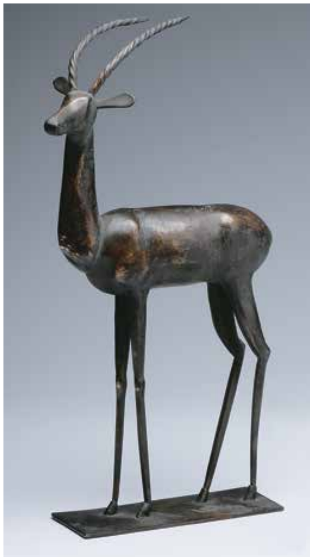
KOPCSÁNYI Ottó: Antilop | Ottó KOPCSÁNYI: Antelope 1958, vörösréz, magasság: 25 cm

A Visszanéztem félutamból című (Széchenyi Kiadó, Budapest, 1989) önéletrajzi írásának vonatkozó fejezetei szerint a saját főiskolai műtermében fogadta növendékeit, akiket a maga alkotói gyakorlatának példájával és személyes konzultációkkal vezetett tanulmányaikban. Szándéka az volt, hogy a közvetlen emberi és alkotótársi kapcsolattal megrövidítse, megkönnyítse számukra azt az utat, amelyet ő – az intézményes oktatás keretein kívül – sok nehézséggel és kínnal járt be.