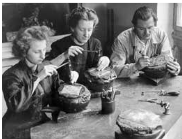
Műhelykép az 1950-es évekből | Workshop photo from the 1950s

1946 – a béke első teljes éve a második világháború befejezése után.