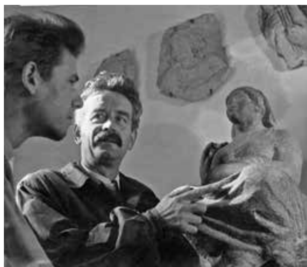
BORSOS Miklós korigál, balra tanítványa, KOPCSÁNYI Ottó az 1950-es években | Miklós BORSOS correcting, his student Ottó KOPCSÁNYI standing by his side, the 1950s

Csak jóval Borsos Miklós (1906–1990) halála után érett meg a szakmai közélet igénye arra, hogy megemlékezzen a 20. század magyar művészetét alkotásaival döntően meghatározó szobrász művészetpedagógiai munkásságáról.