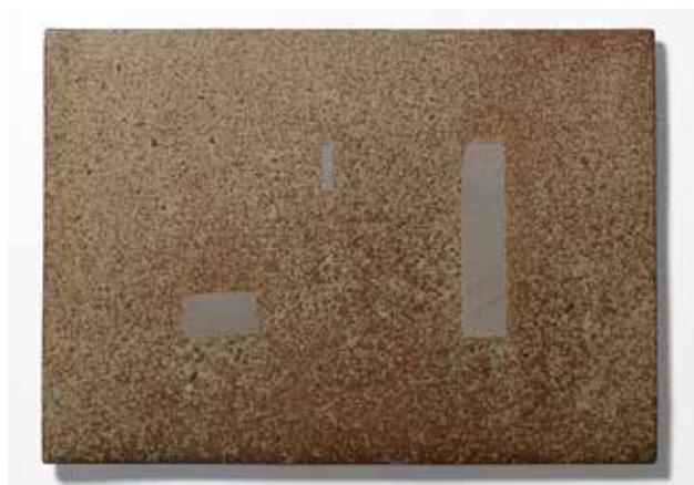
NÉMA Júlia: Magánypontok IV. (Homage à Moholy-Nagy László: Red Collage), pyrogram | Júlia NÉMA: Points of Solitude IV (Homage à Moholy-Nagy László: Red Collage), pyrogram | 2020, vastartalmú magastüzi agyag, saját magyarországi massa, fatüzes égetés, természetes hamumáz, 1320 °C, 23x33x0,7 cm (a sorozat létrejöttét 2019–2020. évi alkotói ösztöndíjával a Nemzeti Kulturális Alap támogatta)

A Moholy-Nagy-kompozíció három elemének hűlt helye az égetés után az anyag tűztől elzárt (redukált) nyers színét mutatja, lágy kontrasztot képezve a tűznek kitett háttérrel, melyet a kemencében elfoglalt helynek megfelelően hol finom lángnyomok, hol erős hamulerakódások módosítanak (természetes hamumáz). Az eljárással mindig teljesen egyedi, megismételhetetlen tárgyak születnek, még ha a kompozíció azonos is. A történések előkészíthetők és elősegíthetők, de teljes egészében nem kontrollálhatók. Találkozik tehát a rendszerben való tervezői gondolkodás és az egyediség elemi igénye, értéke. A porcelán és a két különféle kőedény határozottan eltérő monokróm anyagisága a fotogramok finom szürkeárnyalataival rokon. Mindhárom képet körülbelül 1320 °C-on, akácfával égettem ki saját kemencémben, melyet mesteremmel, Frederick L. Olsennel terveztünk és építettünk.