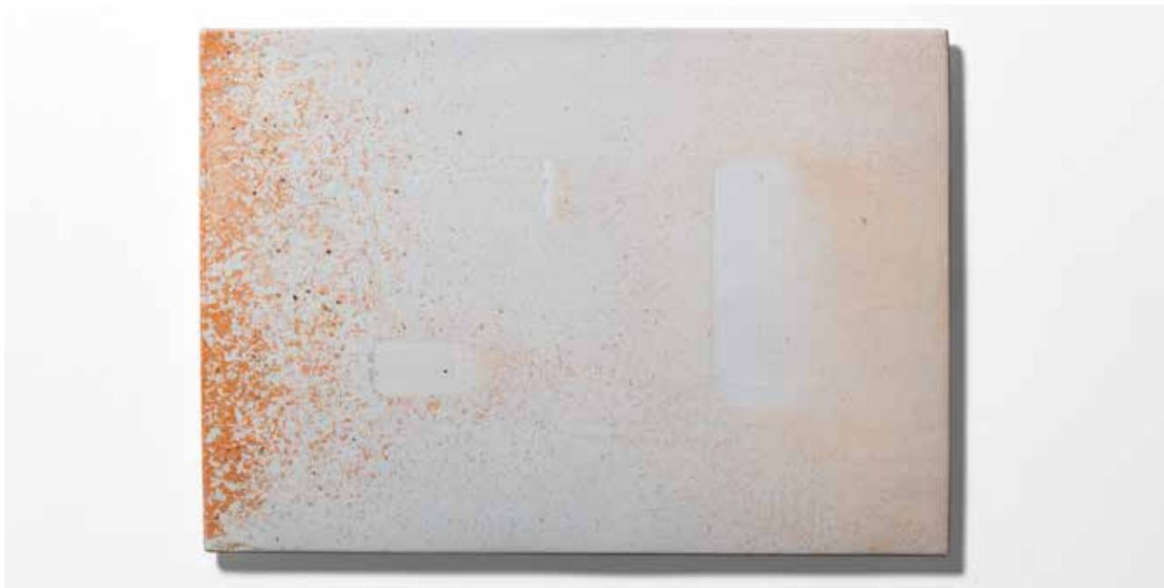
NÉMA Júlia: Magánypontok III. (Homage à Moholy-Nagy László: Red Collage), pyrogram | Júlia NÉMA: Points of Solitude III (Homage à Moholy-Nagy László: Red Collage), pyrogram | 2020, porcelán, fatüzes égetés, természetes hamumáz, 1320 °C, 23x33x0,7 cm

A magas hőfokú fatüzes égetés egyik leginspirálóbb vonása az, hogy a lángok és hamu alkotta atmoszféra és az agyag, illetve porcelán találkozása gyönyörű, gazdag felületet és kiemelkedő anyagminőséget eredményez. Minden darabon a föld, a fa és a tűz elementáris szépsége érvényesül. Az égetés során a kemencében – mint sötétkamrában – hosszan tartó, folyamatos és természetes expozíció világítja meg és rögzíti a tárgyakat. Az egyéni kontrollhoz képest transzcendens erővel, az idővel, a természettel és a véletlennel való együttműködés a pyrogramban éppúgy tartalmi elemmé válik, mint a fotogramban. E társalkotás szerves eredménye a kész tárgyakon a tartam lenyomata és a folyamat transzparenciája.