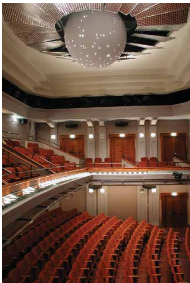
szenes István: A nyíregyházi Mórca Zsigmond Színház nézőterének belsőépítészeti kialakítása. Építész: GÁVA Attila, Gav-Art Stúdió István SZENES: Interior design of the auditorium of Nyíregyháza's Mórca Zsigmond Theatre. Architect: Attila GÁVA, Gav-Art Studio 2003

– A MABE szorgalmazására és szervezésében 2014-ben jelent meg A magyar belsőépítészeti 1945–2012