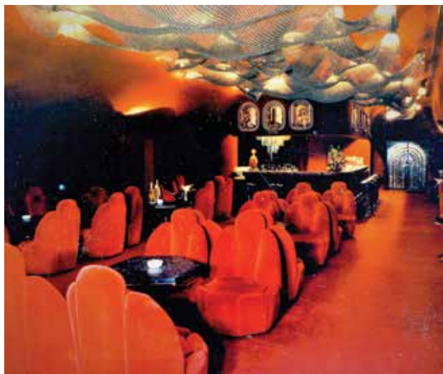
SZENES István: A Hilton Budapest (Budapest I. ker.) Trubadúr tetőbárájának belsőépítészeti kialakítása. Építész: PINTÉR Béla, KÖZTI István SZENES: Interior design of the Troubadour roof bar of Hilton Budapest (1st district). Architect: Béla PINTÉR, KÖZTI | 1976

– Nyolcféle csoportba lehet a témáit összeszedni, mivel szinte mindent tervezett. Ebből a négy kedvencét, a színházakat, a szállodákat, a bankokat és a kórházakat tesszük az első, azaz a látogatók érkezési szintjére. Ezeket négy körformában helyezük el, mivel István mindig azt mondja: „nekem körből áll a világ.” Ezen a szinten inkább csak az arányok kisebb igazítása és finomítások jelentették a feladatomat. Textilanyagra komponáltuk a bemutatandó anyagot, ezek fellógatva, zászlószerű hatást keltenek. Ha egy kis légmozgás éri őket, akkor egy kicsit mozogni is fognak, ezért kívül-belül nagyon érdekes látványt mutatnak. Az alsó szinten van a másik négy nagy téma: a sportlétesítmények, az iskolák, a művészeti létesítmények és a magánházak. A jól áttekinthető, térben álló tartószerkezeten – amelyet már egy korábbi, a Vigadóban rendezett összefüggő belsőépítészeti kiállításon