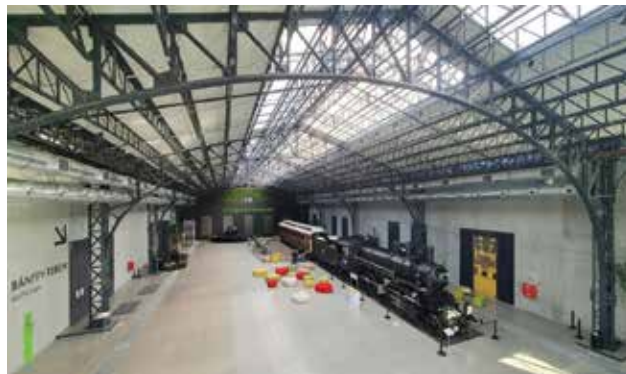
SENES István: Az Opera Eiffel Műhelyháza (Budapest X. ker.) Nagycsarnokának belsőépítészeti kialakítása. Építész: MAROSI Miklós István SENES: Interior design of the Large Hall of the Eiffel Workshop (Budapest, 10th district) of the Budapest Opera. Architect: Miklós MAROSI | 2020