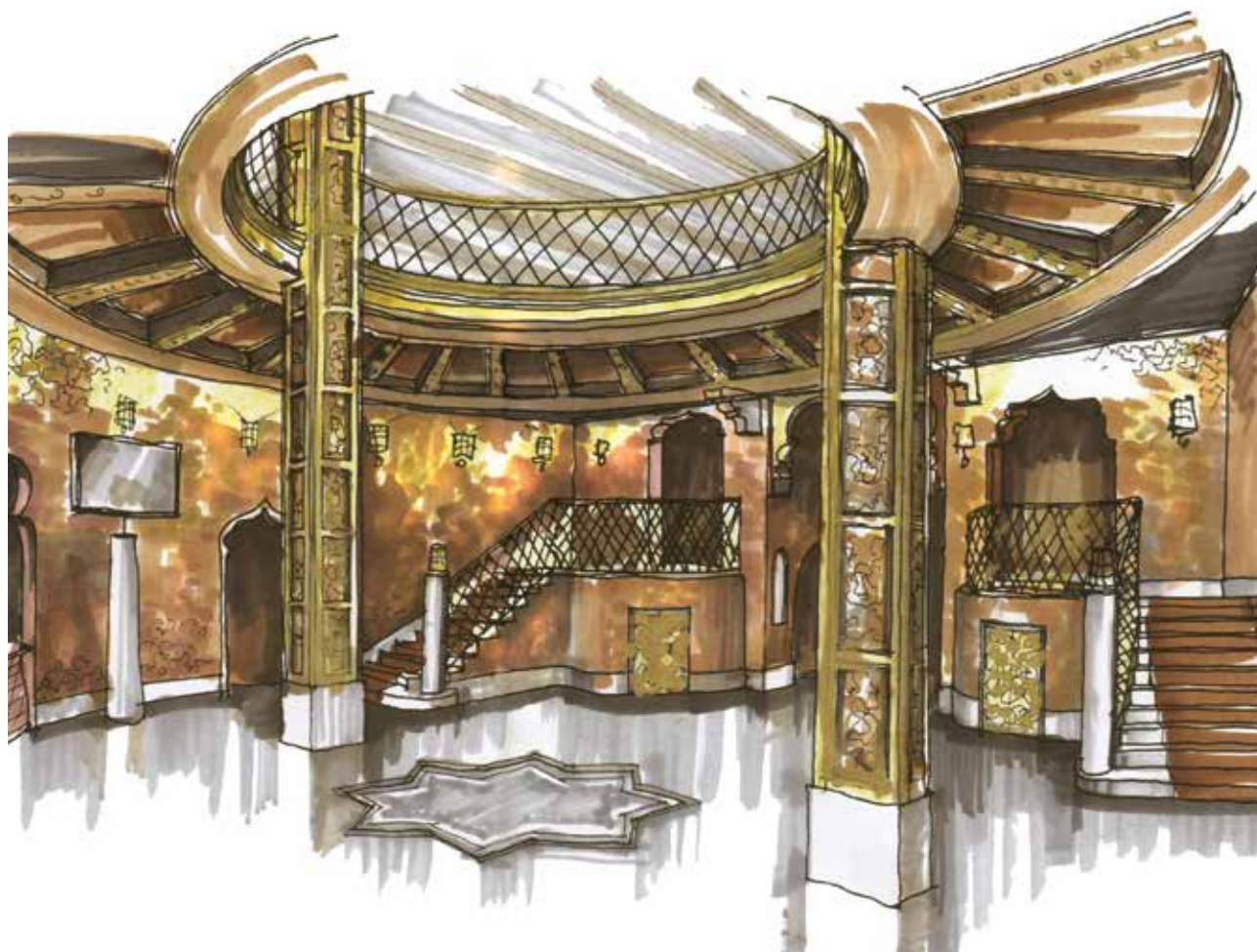
szenes István: Az Uránia Nemzeti Filmszínház (Budapest VIII. ker.) rekonstrukciója, az előcsarnok terve. Építész: MÁNYI István, Mányi Stúdió István SZENES: Reconstruction of the Uránia National Film Theatre (Budapest, 8th district), plan of the foyer. Architect: István MÁNYI, Mányi Studio | 2002

– Természetesen mindig akadnak új anyagok, színek és főként technikai újítások. De egyre inkább fedezik fel a régi korok értékeit. Most egy olyan sorozatot kezdtünk el online formában a MABE-ban, ami a rekonstrukciókról és a restaurálásokról szól. Ennek Baliga Kornél kollégánk a szakavatott ismerője, ő alkotja a legtöbb ilyen tervet, Lukács Zsófia pedig a kastélyok belső tereit tervezi újra. Számos tanulsággal szolgál a mai tervezők számára úgy a korszakok mentalitásának, mint mesterségbeli tudásának megismerése. A legnagyobb változás azonban a módszertanban következett be. A mi korosztályunk – Szenes Istváné és a magamé is – még szeret először kézzel rajzolni, skiccpauszra, grafitral, vastag ceruzával. A fiatalok ma azonnal gépre viszik föl a terveiket. Nekem továbbra is az az érzésem, hogy azok a rideg vonalak soha nem mutatnak annyit az emberből, mint a szabadkézi rajz: hogy hogyan van letéve a papírra, abból azt is lehet tudni, hogy ki csinálta, milyen az az ember, többet megtudni belőle arról, aki rajzolta. A gépi vonalak ezt nem adják vissza,