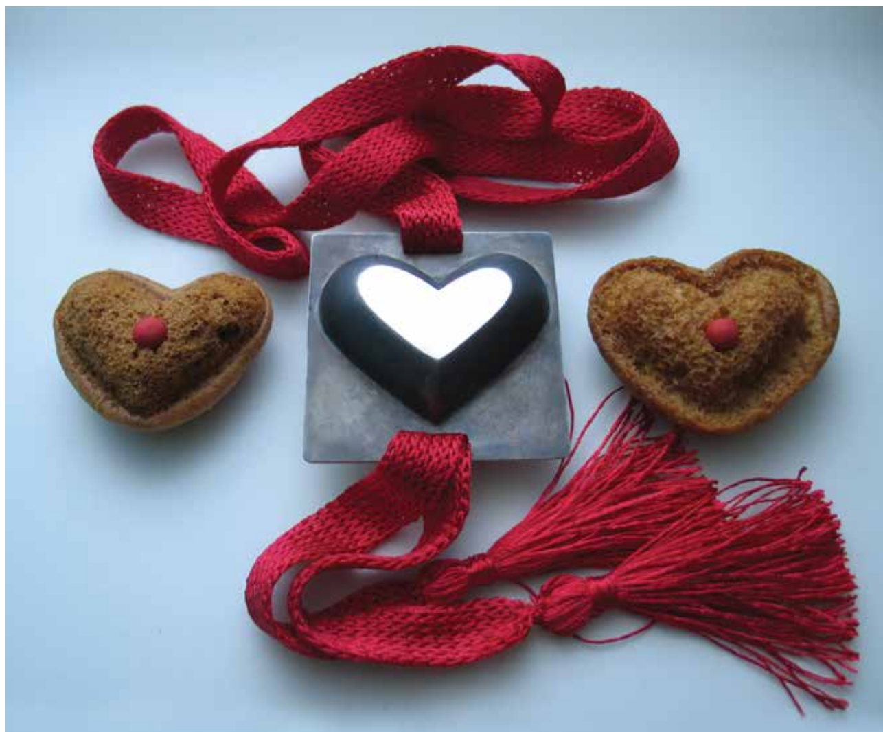
BODOR Bernadett: Mézeskalácssütő szív, nyakék | Bernadett BODOR: Gingerbread-form heart, necklet | Ezüst és fonal, medál: 6,5x6,5x1,5 cm

A Fiatal Iparművészek Stúdiója Egyesület új gyűjteményéről előző lapszámainkban (2021/2, 19–25.; 2021/3, 11–20.; 2021/4, 24–33.) számoltunk be. Az alábbi képanyaggal folytatjuk a válogatást a kollekció darabjaiból. A válogatás befejező részét következő lapszámunkban közöljük.