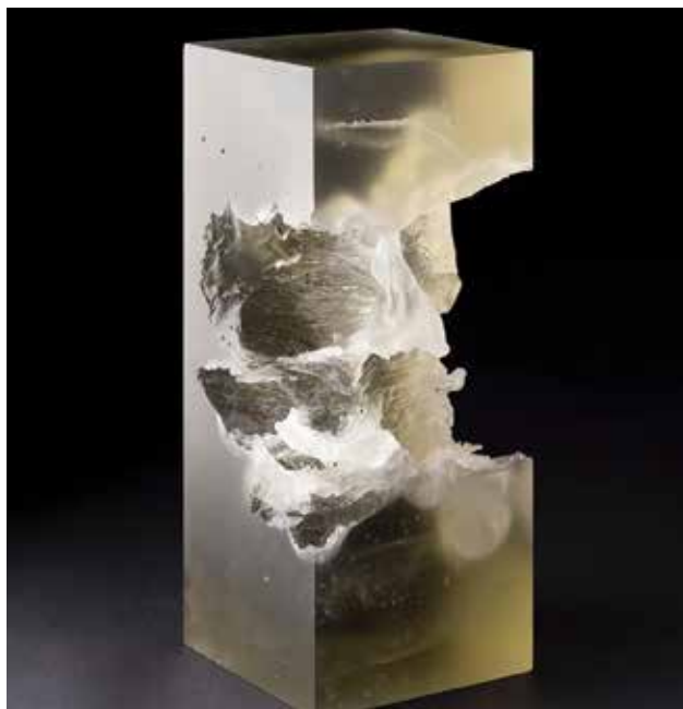
BŐSZE Eszter: Flow Motion I. | Eszter BŐSZE: Flow Motion I Viaszveszejtéses, kemencében formába olvastott üveg, 36x15x15 cm