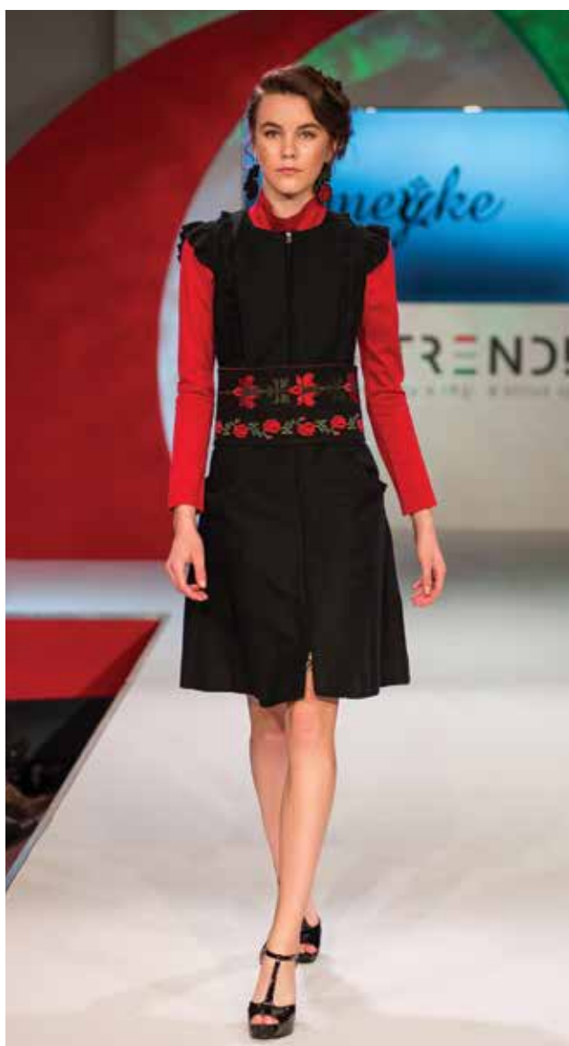
MOLNÁR-MADARÁSZ Melinda: Barkó ruha 2. Melinda MOLNÁR-MADARÁSZ: Barkó dress 2 2014, pamut, viszkóz, ripsz, 36-os méret