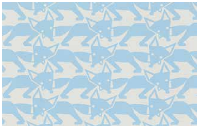
MOLNÁR Réka: Sorakozó, lakástextil-kollekció (mintarészlet) Réka MOLNÁR: Lining-up, home textile collection (pattern detail) Pamut, jacquard-szövés, a teljes méret: 240x140 cm