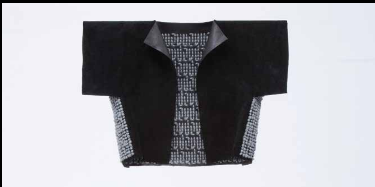
PAPP Zsófia: Báránybőrbe bújt farkas öltözékkollekció | Zsófia PAPP: Wolf in sheep's array, clothes collection | Bőr, textil, hímzés, 60x60 cm