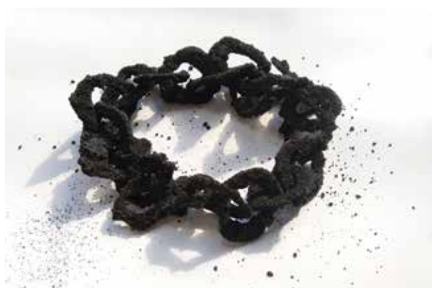
NEUZER Zsófia: Tartarus (Chaos ékszersorozat) Zsófia NEUZER: Tartarus (Chaos jewellery series) 2018, zúzott szén, vízüveg, 20x20x7 cm