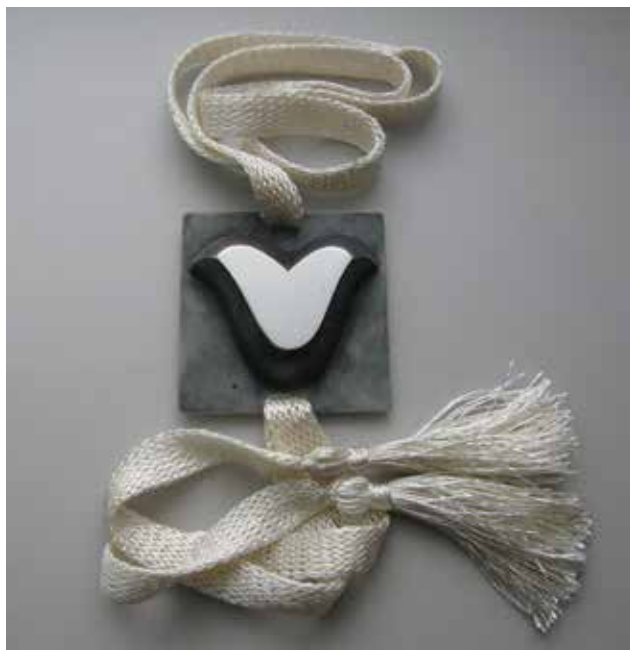
BODOR Bernadett: Mézeskalács-sütő tulipán, nyakék Bernadett BODOR: Gingerbread-form tulip, necklet Ezüst és fonal, medál: 6,5x6,5x1,5 cm