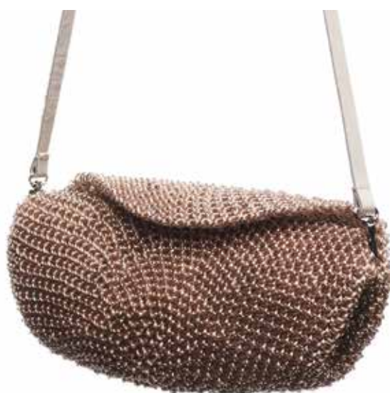
TSUR Dorina Rita: Láthatósági retikul | Dorina Rita TSUR: Visibility handbag 2019, egyes átlátszó hangszórókábel, bőr, 15x35x5 cm