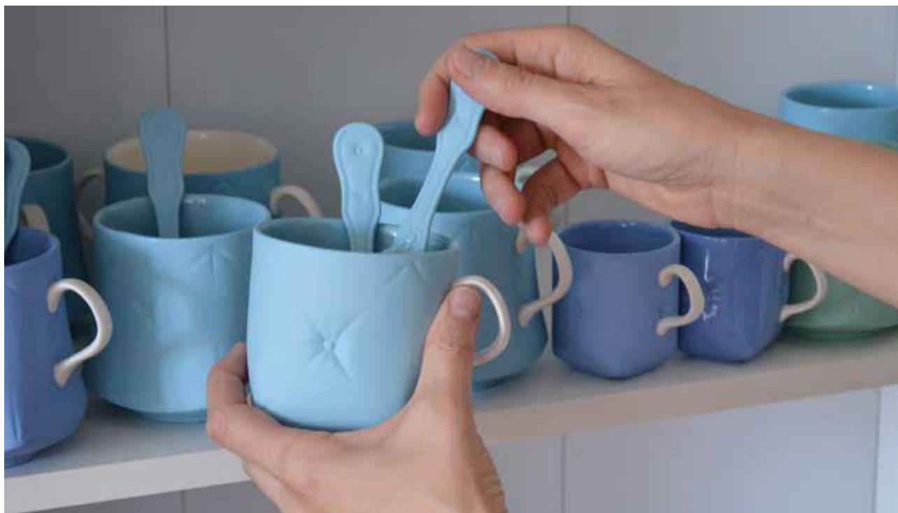
MEIXNER Etelka: You & Me bögrecsalád | Etelka MEIXNER: You & Me cup family | Öntött, színes porcelán, 11 x Ø 11 cm