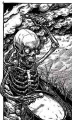
LIZISKA Péter: Apokaliptika sorozat | Péter LIZISKA: Apocalyptic series 2020, számítógépes grafika, egyenként: 70x50 cm