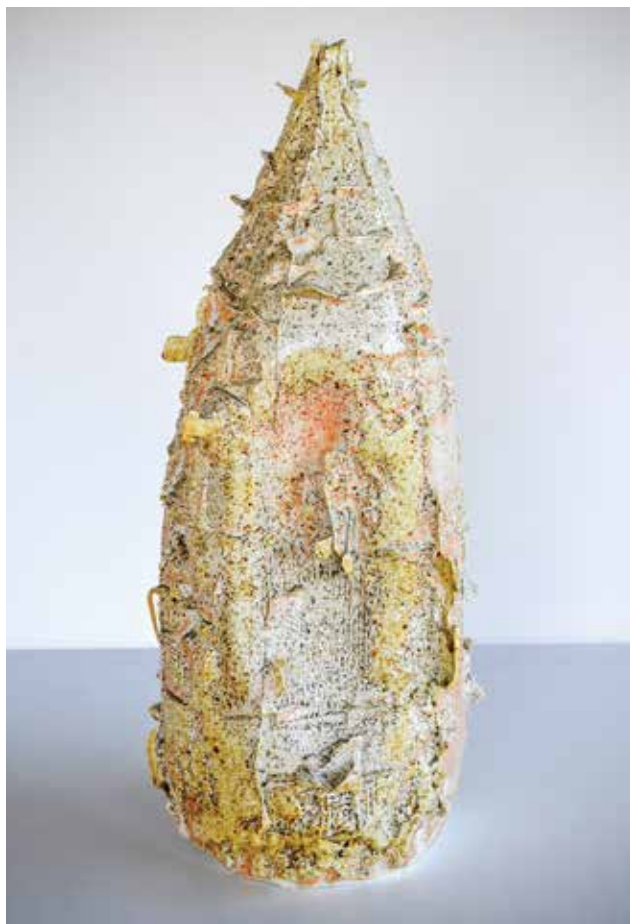
KOVÁCS Máté: Hibridváza I | Máté KOVÁCS: Hybrid vase 2020, öntött porcelán, fatüzelésű kemencében égetve, 50 x Ø 20 cm