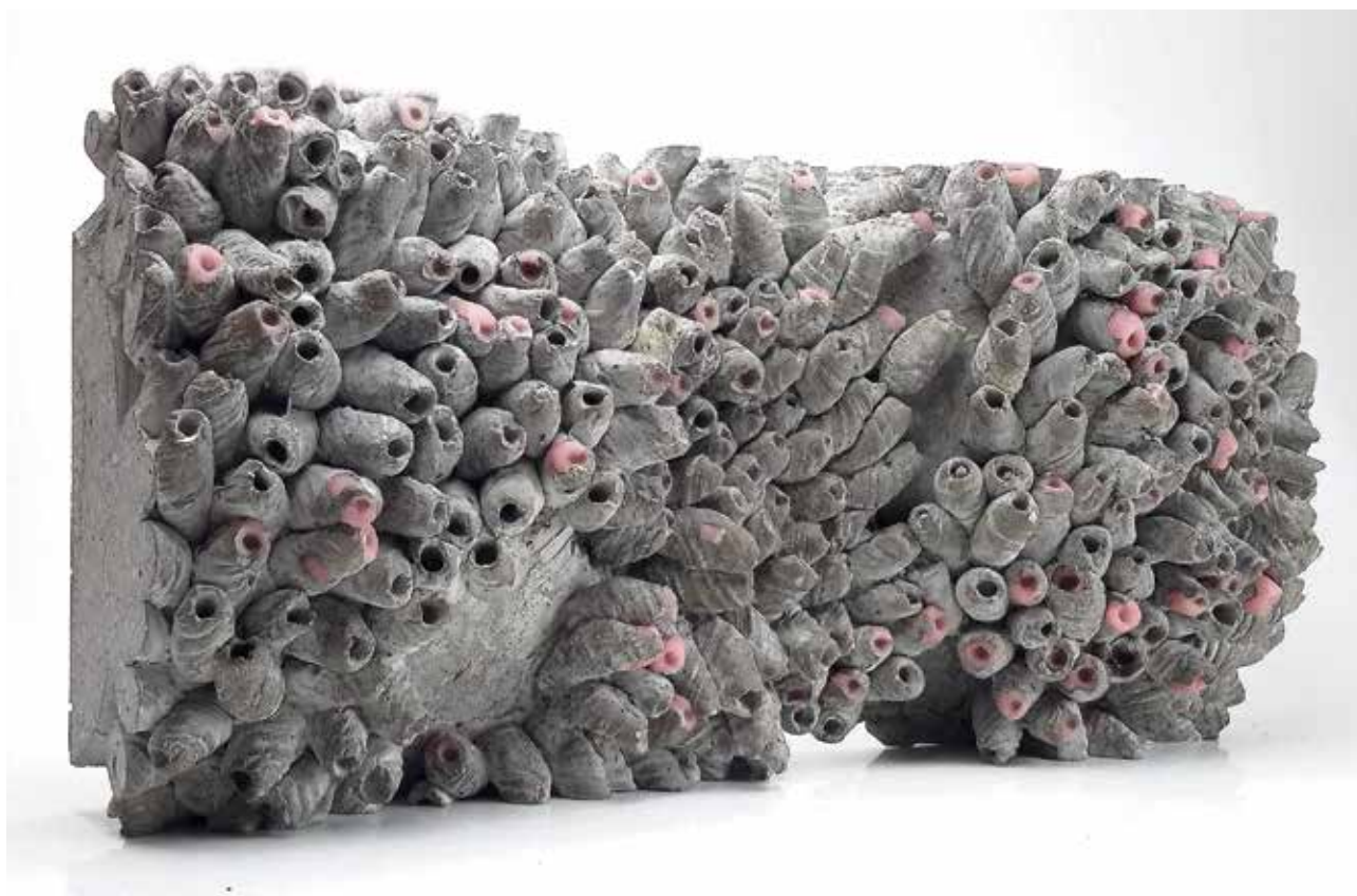
FARKAS-PAP Éva: Disztópia 3. | Éva FARKAS-PAP: Dystopia 3 | Beton, műgyanta, szilikon, 14x33x5 cm