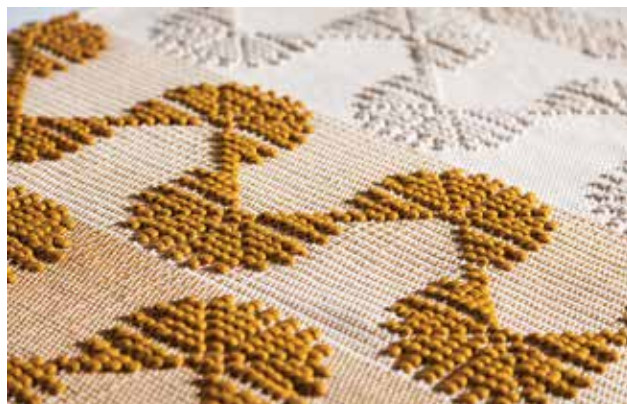
RÉVÉSZ Eszter: NOMIO, szőttés (részlet) Eszter RÉVÉSZ: NOMIO, handwoven (detail) 2019, kézi szövés, tűre szedett technika, a teljes méret: 196x73 cm Fotó: Tarján Gergely