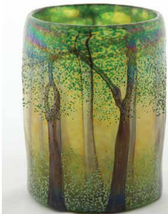
SMETANA Ágnes: Kerek erdő | Ágnes SMETANA: Round Forest 2006, színtelen hutaüveg, fúvott, rétegesen színezett, irizált, 16,5 x Ø 11,6 cm (Rippl-Rónai Múzeum, Kaposvár)