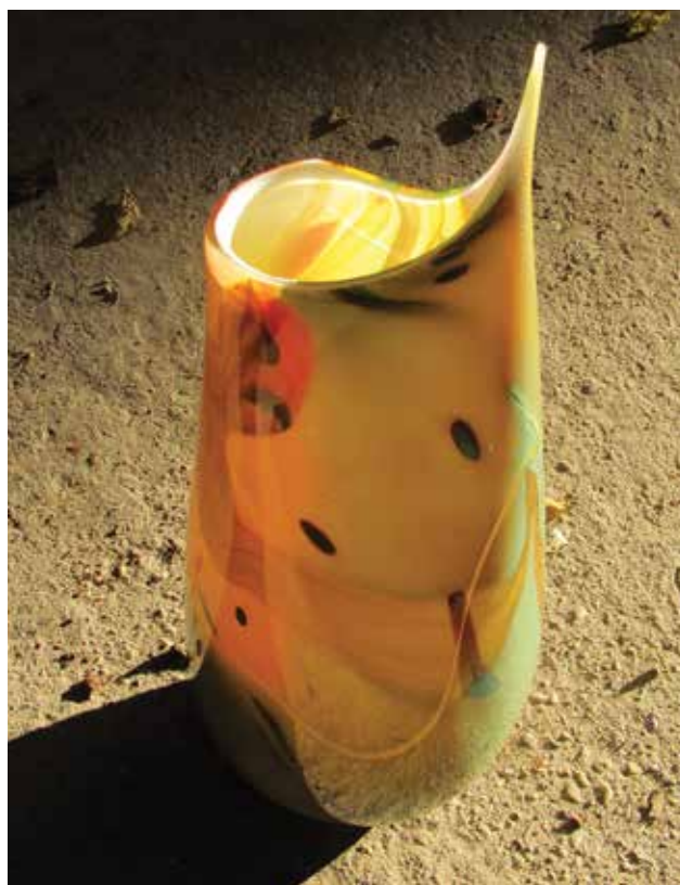
Phillip HICKOK, Swede (USA): Alchemy Dreams series 3 Phillip HICKOK, Swede (USA): Alchemy Dreams series 3 2020, hutaüveg, színezett, fúvott, szabadon alakított, magasság: 14 cm („Goszthony Mária” Nemzetközi Üveg Alkotótelep és Szimpozium Alapítvány, Bárdudvarnok)