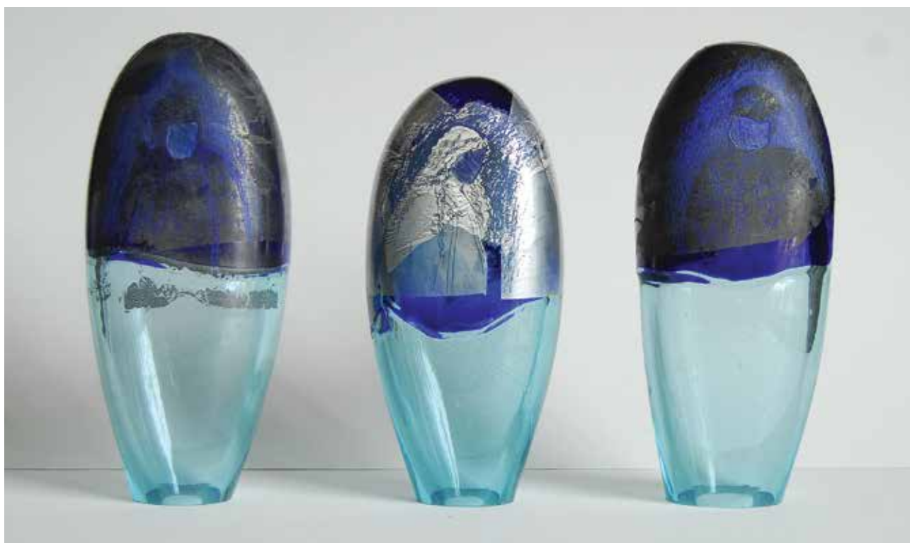
Ella VARVIO (Finnország): Former rulers (Egykori uralkodók) II. | Ella VARVIO (Finland): Former Rulers II 2016, fúvott üveg, színezve, fóliarátéttel, gravírozva és csiszolva, magasság (balról jobbra): 26,5 cm, 24 cm, 26 cm („Goszthony Mária” Nemzetközi Üveg Alkotótelep és Szimpozium Alapítvány, Bárdudvarnok)