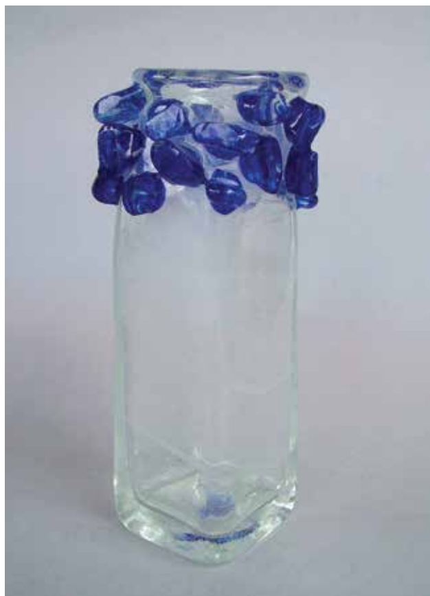
BEICZER Judit: Természetrájz II. | Judit BEICZER: Natural History II 2006, színtelen, kék hutaüveg, formába fúvott, melegen alakított, magasság: 17,5 cm (Rippl-Rónai Múzeum, Kaposvár)