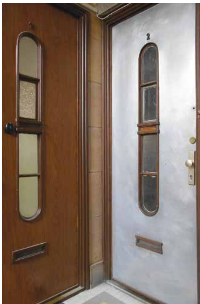
Ajtók a Budapest V. ker., Vitkovics Mihály utca 3–5.-ben (eredetileg a Magyar–Olasz Bank két lakóháza). Építész: MÜNNICH Aladár Doors at 3–5, Vitkovics Mihály st., Budapest Vth district (originally two blocks of flats of the Hungarian-Italian Bank). Architect: Aladár MÜNNICH | 1936