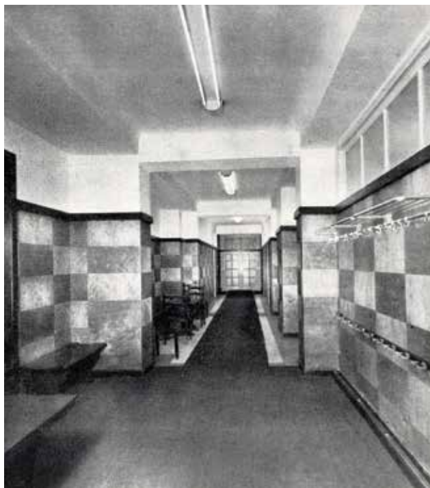
A Budapest V. ker., Mérleg utca 6., a Pesti Magyar Kereskedelmi Bank Nyugdíjintézete irodaházának bejárati előtere. Építész: MÜNNICH Aladár | Entrance hall of the office building of the Pension Institute of the Hungarian Commercial Bank of Pest. 6, Mérleg st., Budapest Vth district. Architect: Aladár MÜNNICH | 1941