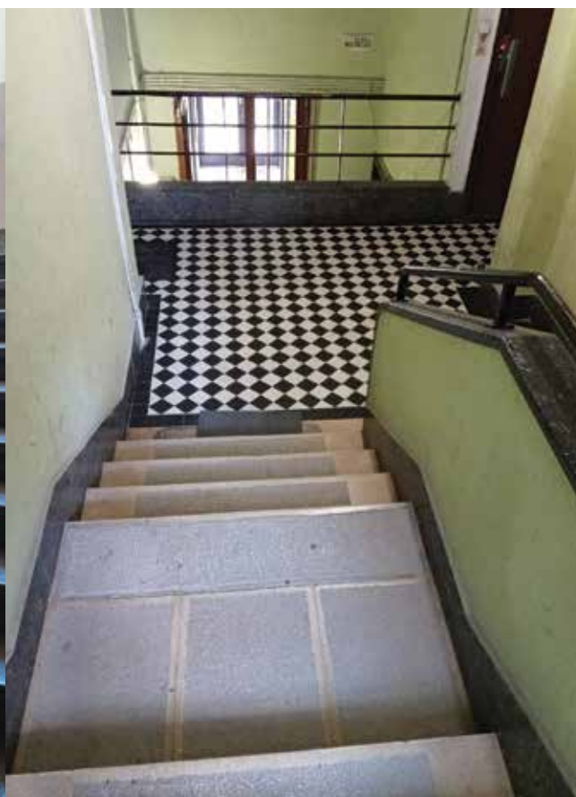
A Budapest VII. ker., Király utca 1/b–c – Asbóth utca 24. (eredetileg a Helvetia Rt. lakóháza) lépcsőháza. Építész: MÜNNICH Aladár Staircase of 1/b–c, Király st. – 24, Asbóth st., Budapest VIIth district (originally the block of flats of the Helvetia Co.). Architect: Aladár MÜNNICH | 1939