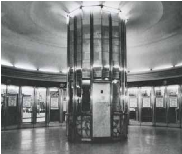
A Híradó Filmszínház (Budapest VII. ker., Erzsébet körút 13.) előcsarnoka. Építész: MÜNNICH Aladár

Kimagasló a debreceni Piac utca 19. szám alatti lakóház belsőépítészeti terve, melyet szintén csak papírról