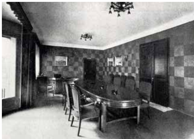
A Budapest V. ker., Mérleg utca 6., a Pesti Magyar Kereskedelmi Bank Nyugdíjintézete irodaházának tanácsterme. Építész: MÜNNICH Aladár | Boardroom in the office building of the Pension Institute of the Hungarian Commercial Bank of Pest. 6, Mérleg st., Budapest Vth district. Architect: Aladár MÜNNICH | 1941