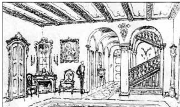
MÜNNICH Aladár belsőépítészeti rajza a dióspusztai kastélyhoz Interior design drawing for the Dióspusztai mansion by Aladár MÜNNICH | 1929

Egyetlen irodaháznak épült háza, az V. ker., Mérleg utca 6. (1937, kivitelezés: 1941) bejárati előterének, igazgatói szobájának és tárgyalójának berendezését korabeli fotókról ismerjük. Az utóbbi kettőnél érdekes a kétféle furnérból készült sakkáblamintás falburkolat. A bejárati előtérben a rá jellemző kontrasztos, fekete-fehér bordűrös padlót alkalmazta.