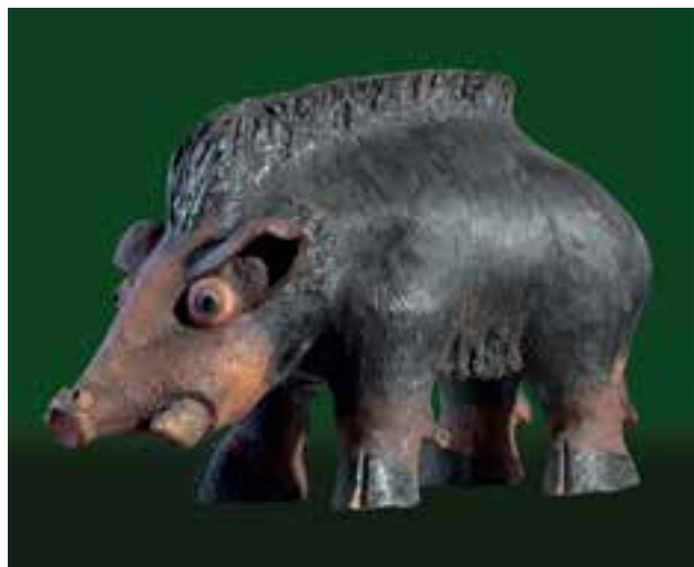
NÉMETH János: Vaddisznó | János NÉMETH: Wild boar 2019, samottos, agyagmázás kőcserép, magasság: 32 cm (magántulajdon)

Ugyanakkor, ami a tartalmi elemzést illeti, egyetérthetünk abban, hogy Németh János az anatómiai hűség helyett a narratív, stilizáló, de a népi jellegről sem megfélemező ábrázolásmódot tartotta szem előtt. S már többen is írtak sajátos leleményéről: a korongolt forgástestek felszabdalásáról, amely rusztikussá, zömökké tette figuráit. Kostyál László a dekorativitást is fontos