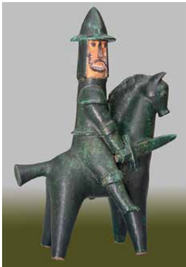
NÉMETH János: Páncélos lovas | János NÉMETH: Armoured knight 1965–1966, színes fedőmázás kerámia, magasság: 40 cm (Göcseji Múzeum, Zalaegerszeg)

A Férfiak és asszonyok fejezet témája is joggal érdemli meg a külön tárgyalást. Németh János aktjai tenyeres-talpas, de jó formájú asszonyok, akik nem rejtik véka alá telt idomaikat. Talán anyagszerűségük az, ami dominál. Szentszobrai között gyakran találunk anya gyermekével ábrázolásokat, ezek meghittsége, embersége klasszikus formákat idéz, mely az összetartozás szépségét hangsúlyozza. A viszonylag korai Emberpár (1985) szintén az együvé tartozás emblematikus figurái, de a későbbi fürdőző vagy gondolkodó alakjai is ezt a nőies-asszonyos erotikát szólaltatják meg.