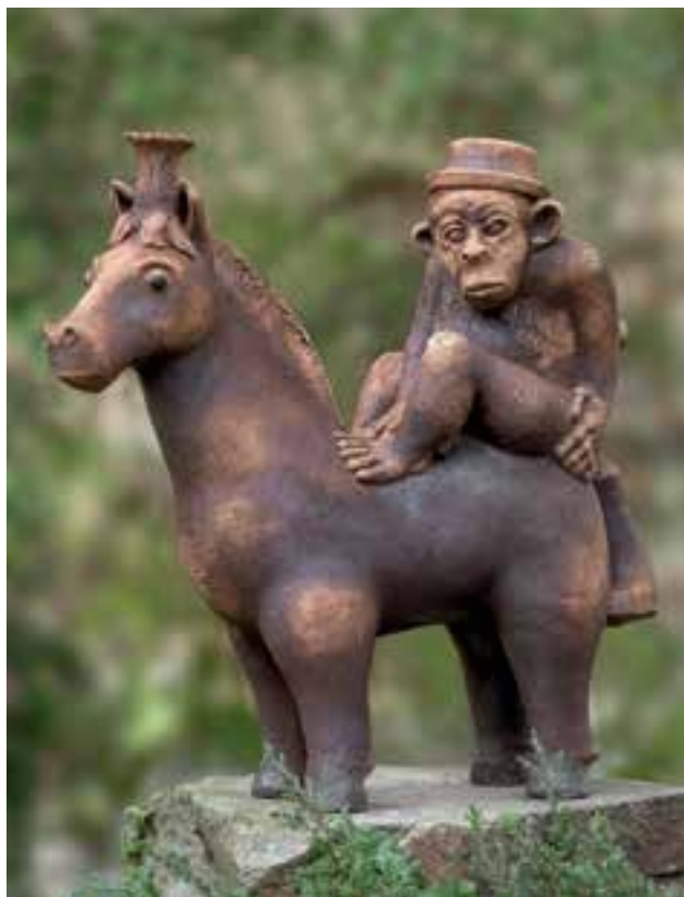
NÉMETH János: Lovon ülő majom | János NÉMETH: Monkey on a horse 2005, samottos, agyagmázás kőcserép, magasság: 55 cm (magántulajdon)

Feledy Balázs a monográfiájában is, de később az Art Limes ben is a szobrászi kvalitásokra tette a hangsúlyt, s Kostyál is ebbe az irányba haladva végezte osztályozását. Módszere a következő tartalmi-tematikai csoportosítást eredményezte: állatábrázolás, szentábrázolás, mitológiai alakok és jelenetek, valamint a népies és pihenő figurák. A felosztás elfogadható, talán a legutolsó egység tűnik túl szubjektívnek, mely nem szervesen csatlakozik a felvázolt logikához.