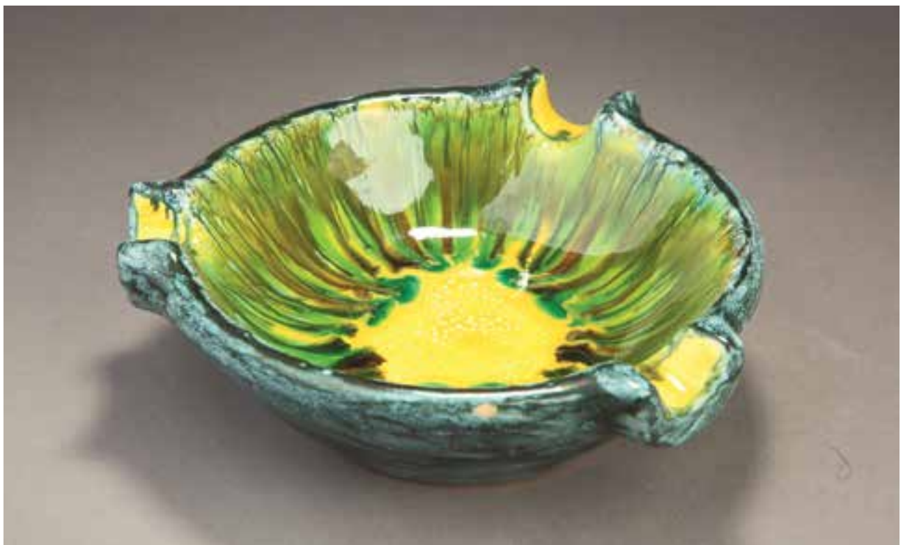
Hamutál | Ashtray | Jelzett, talpán K jelzéssel, mázas kerámia, 6 x Ø 21 cm (Kiss Imre gyűjteménye)