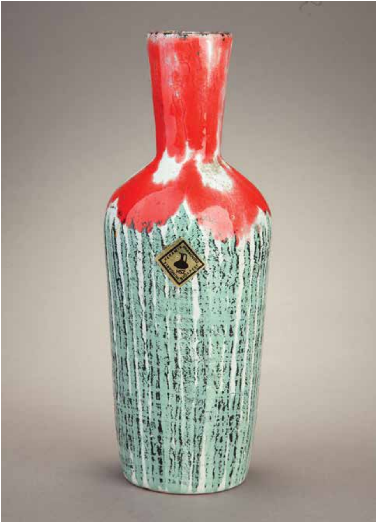
Váza a Háziipari Szövetkezet védjegyével | Vase with the trade-mark of the Homecrafts Cooperative Jelzés nélküli, mázas kerámia, magasság: 23 cm (Kiss Imre gyűjteménye)