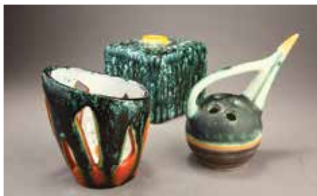
Virágtartó és ikebanaedény (az előtérben), váza

Flower holder and ikebana vessel (in front), vase