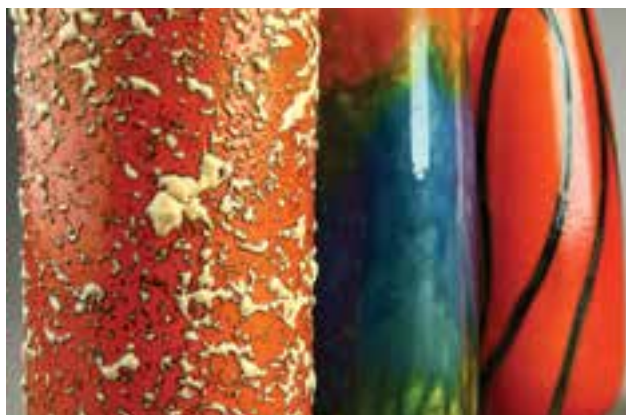
Mázás felületek | Glazed surfaces

– Valóban úgynevezett „avizó” tárlatnak szántam valamennyi szocdeko-kiállításomat, melyek anyaguként egyfajta látványtárként mutatták be a kerámia után a fémtárgyakat és a textileket, úgymint Szoc Deko – Metalika 2011-ben és Szoc Deko – Textilia 2012-ben; végül az üvegeket Szoc Deko – Üveg címmel, 2013-ban. Amit szerettem volna provokálni a művészettörténeti kategóriát jelölő névadással is, hogy foglalkozzanak művészettörténész, szociológus,