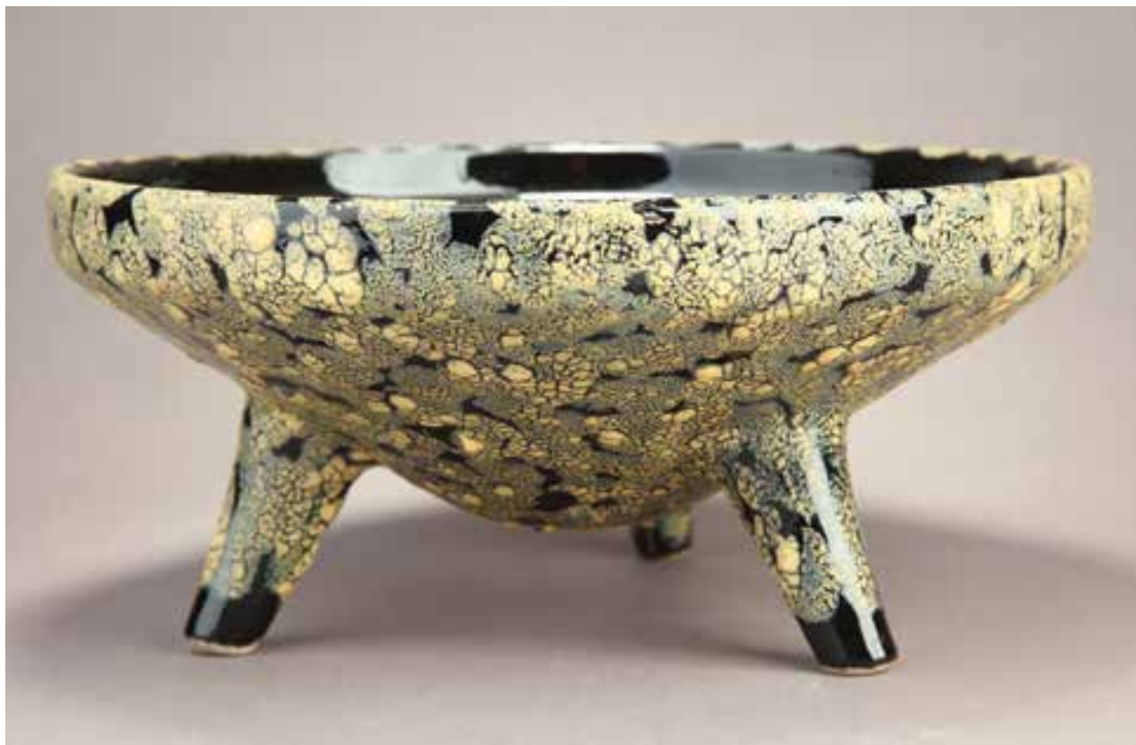
Kínálódény | Bowl | Jelzés nélküli, mázas kerámia, 10,5 x Ø 24 cm (Kiss Imre gyűjteménye)

úgynevezett world culture múzeumok már jól tudják, mert a bőrükön érzik. Ezt reprezentálta a Néprajzi Múzeum 2006-os, Műanyag című kiállítása és annak pazar kiadványa, van tehát jó példa, csak követni kellene.