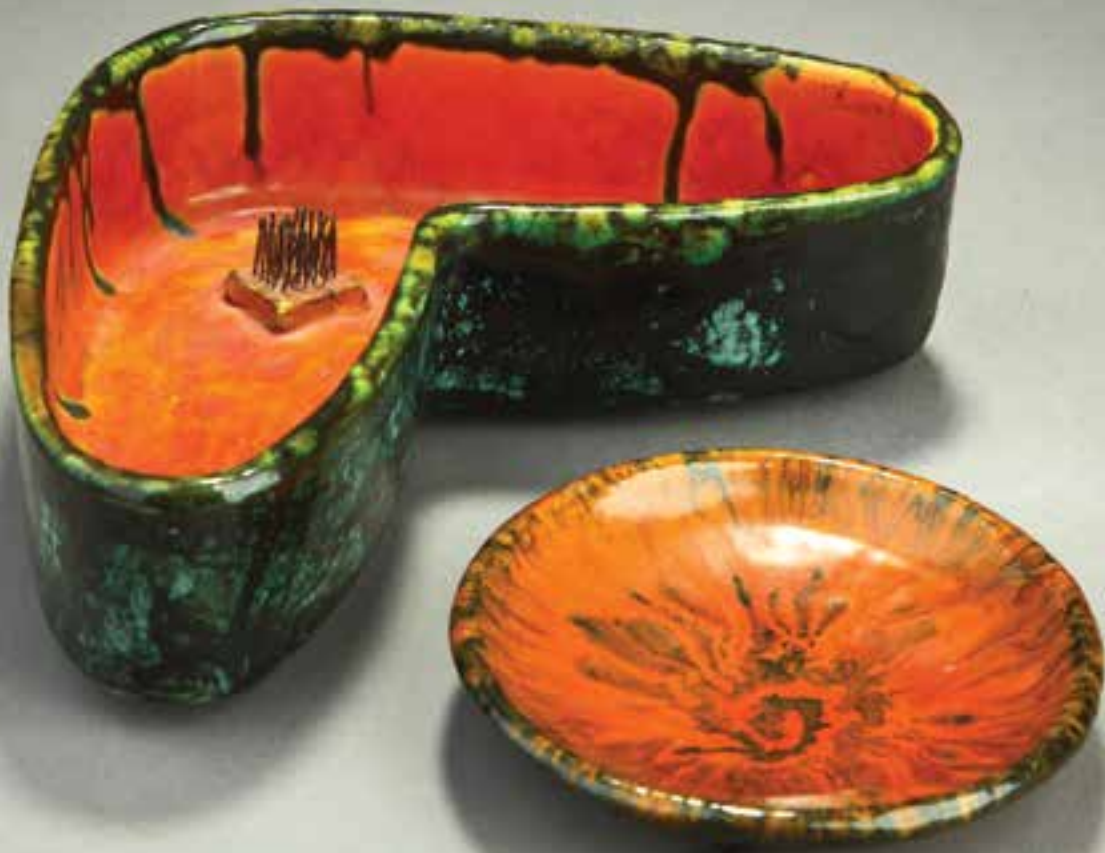
MIHÁLY Béla: Ikebanaedény (balra). Liszkay (feltehetőleg KOVÁCS Zoltán): Tálka | Béla MIHÁLY: Ikebana holder (left). Liszkay (presumably Zoltán KOVÁCS): Small dish | Jelzett, mázas kerámiák; ikebanaedény: talpán az Iparművészeti Vállalat védjegye, 6x23x14,5 cm; tálka: Ø 12,5 cm (Kiss Imre gyűjteménye)