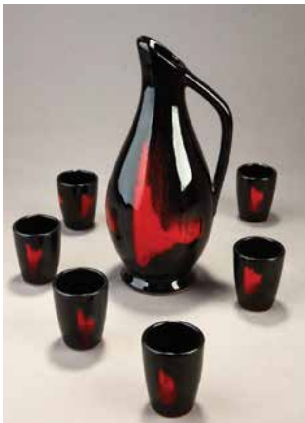
Likőröskészlet | Liqueur set Jelzés nélküli, mázas kerámia, a kiöntő magassága: 25 cm (Kiss Imre gyűjteménye)