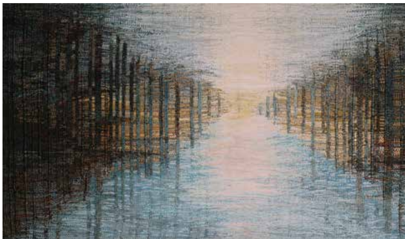
HAGER Ritta: Kiút | Ritta HAGER: Way out 2015–2016, juta, gyapjú, len, aranyszál, plasztikus felvetésű gobelin, 105x210 cm