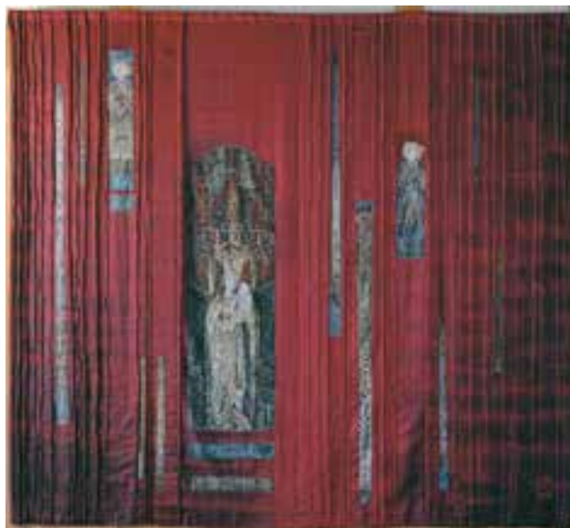
HAGER Ritta: Patrona Hungariae, útikárpit Ritta HAGER: Patrona Hungariae, tapestry 2000, vászon, juta, selyem, festett egyéni technika, 300x330 cm

Brandenburgi kapunál álló Csend Terme , ahol 1994 óta az ő kárpitja hirdeti, hogy a tragédiák át- és megélése után a csendben elmerülve, a csendben megmerítkezve tudunk leginkább emlékezni. Ez a helyszín egyetemes