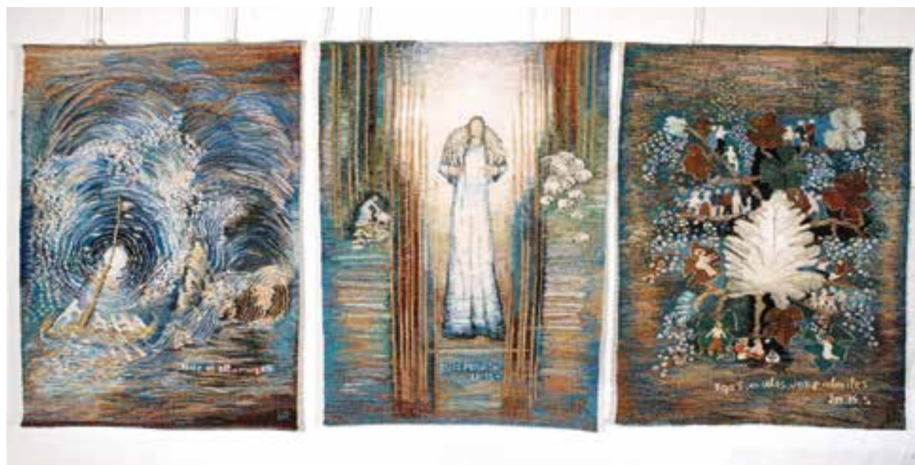
HAGER Ritta: Triptichon | Ritta HAGER: Triptych 2015–2017, gyapjú, len, selyem, vegyes felvetésű gobelin, 3 db, egyenként: 120x90 cm

zarándokhellyé vált, s több mint hatmillióan látták eddig. A mű címe „Hager Rittá-s”: Sugárzó csend , s ez is a rá oly jellemzővé vált plasztikus felvetésű gobelin, jutával, gyapjúval, lennel szöve, kivitelezve. Így lett a művész a