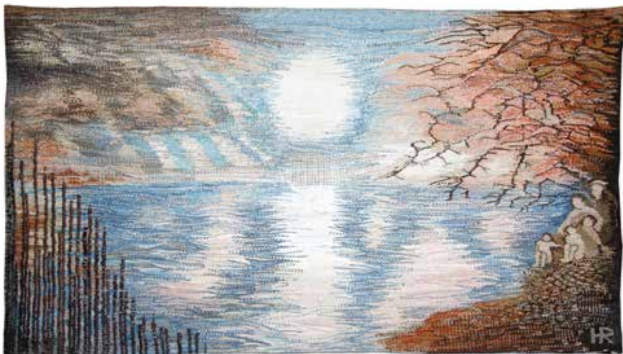
HAGER Ritta: Szemlélődés | Ritta HAGER: Contemplation 2018–2019, gyapjú, len, selyem, plasztikus felvetésű gobelin, 93x160 cm