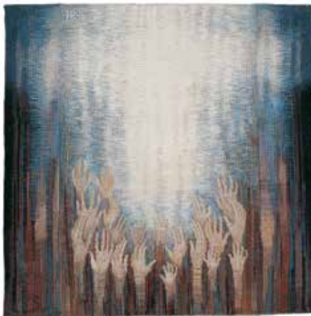
HAGER Ritta: Remény | Ritta HAGER: Hope 1998–2000, gyapjú, len, vegyes felvetésű gobelin, 175x173 cm