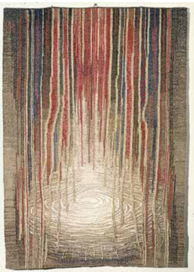
HAGER Ritta: Kegyelem | Ritta HAGER: Grace 2007, gyapjú, len, aranyzál, vegyes felvetésű gobelin, 127x87 cm