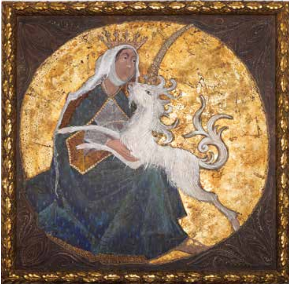
SINKÓ Veronika: Szűz egyszarvúval | Veronika SINKÓ: Virgin with unicorn 2009, farostlemez, tojástempera, 100x100 cm