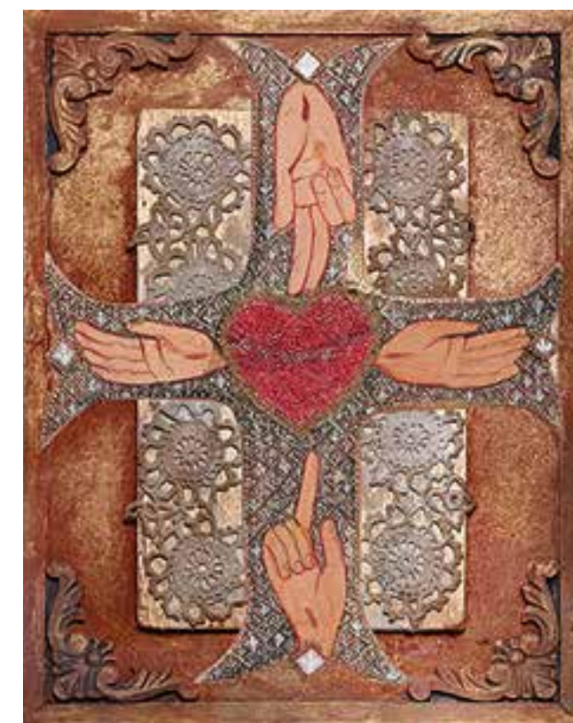
^ SINKÓ Veronika: A Szív teológiája | Veronika SINKÓ: The theology of the Heart 2000, farostlemez, gyöngy- és csipkekollázs, 40x30 cm