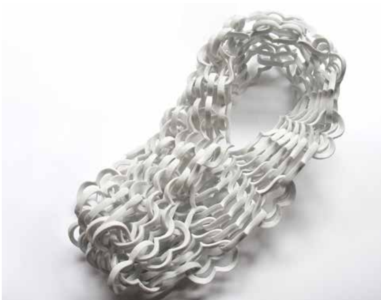
REJKA Erika: II. 14. | Erika REJKA 14.02. | 2007, porcelán, 12x12x40 cm