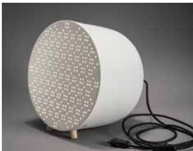
STROHNER Márton: Collection-P lámpa Márton STROHNER: Collection-P lamp 2016, öntött és áttört porcelán Ø 29 x 24 cm

A másik tekintélyes csoport a textilművészeti alkotásoké. Amilyen sokrétű ez a terület, olyan széles körű válogatás került a gyűjteménybe. A különleges öltözékek mellett táskák és cipők is szerepelnek. A változatos alapanyagú, természetes szálakból vagy akár fémből szőtt munkákon túl dinamikusan változó felületű digitális textilalkotás is gazdagítja a FISE kollekcióját.