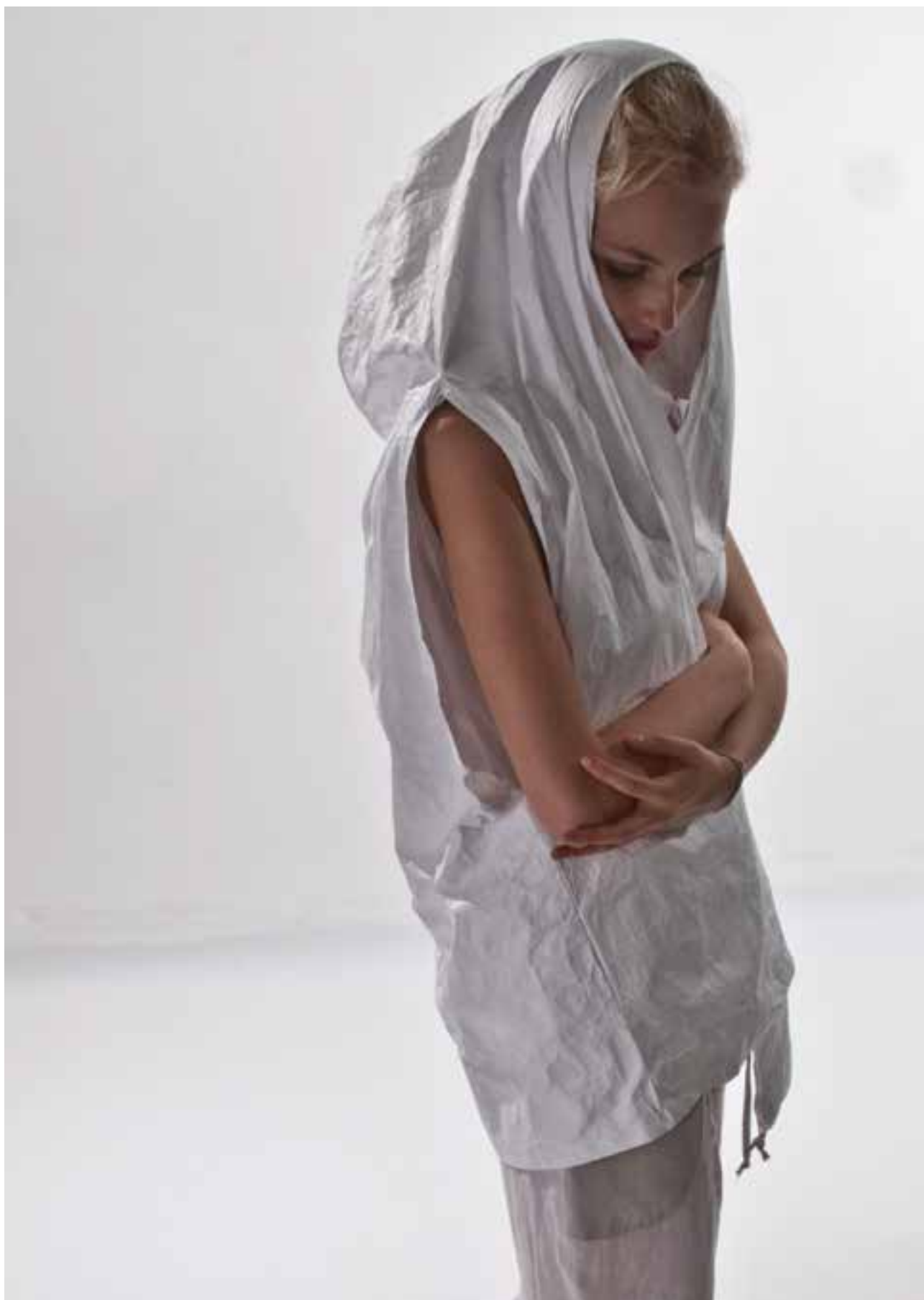
PAPP-VID Dóra: Auraruha Gamma 3a | Dóra PAPP-VID: Aura dress Gamma 3a | 2019 Fotó: Beregi Edina