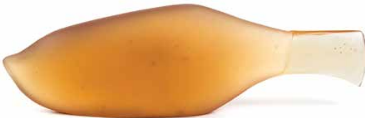
BÁNÓ Rita: Bárdhal | Rita BÁNÓ: Hatchetfish | 2018, formába olvasztott, csiszolt, savazott üveg, 9x28x 5 cm