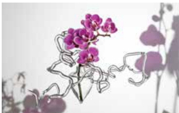
FARKAS Diána: Egy epifiton vázája | Diána FARKAS: Vase of an epiphyte 2017, üvegtechnika