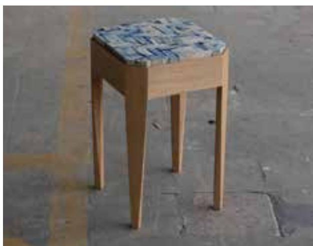
TEMESI Apol: Stoki No. 2 Apol TEMESI: Stool No. 2 2019, ülóbútor, ipari gyapjú