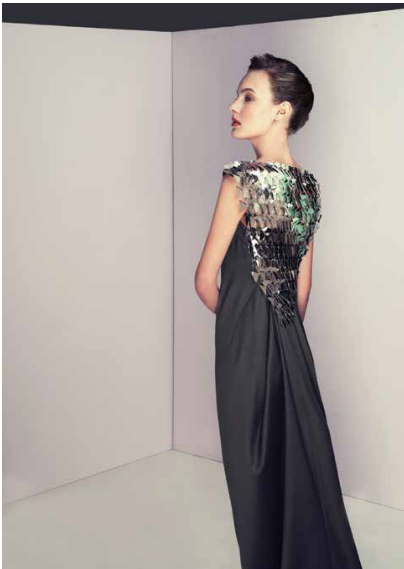
HEGEDŰS Zsanett: Oxalis 6 | Zsanett HEGEDŰS: Oxalis 6 | 2013, formán drapériázott ruha, moduláris struktúrájú háttal