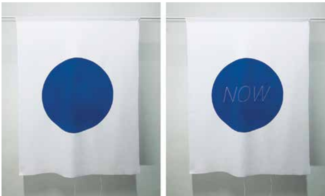
KÁRPÁTI Judit Eszter: NOW | Judit Eszter KÁRPÁTI: NOW | 2020, textil, reagens festék, egyedi elektronika, 100x75 cm