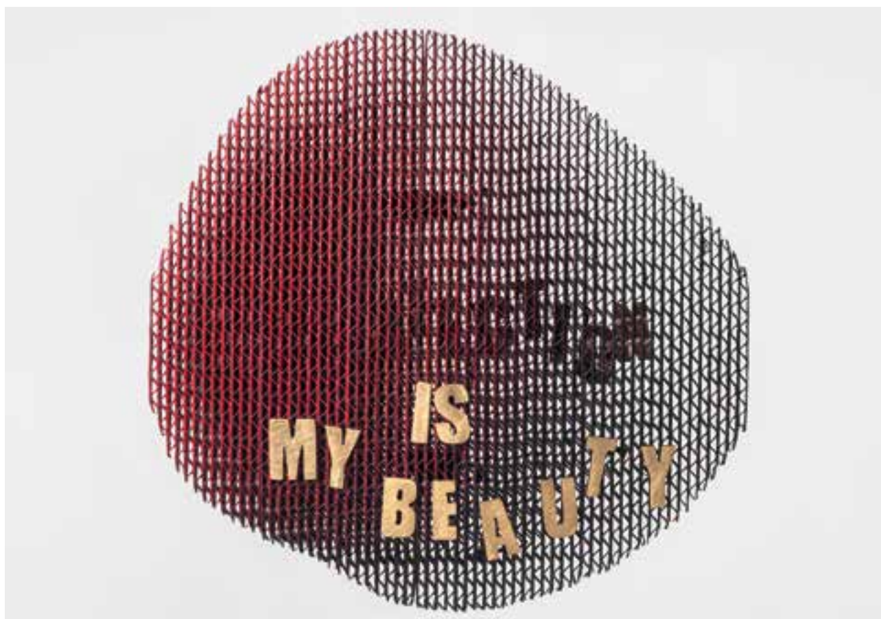
FAZEKAS Veronika: Imperfection (Veronika Coelho sorozat), brass | Veronika FAZEKAS: Imperfection (Veronika Coelho series), brooch 2019, alumínium, papír, 9x10,6x4,6 cm