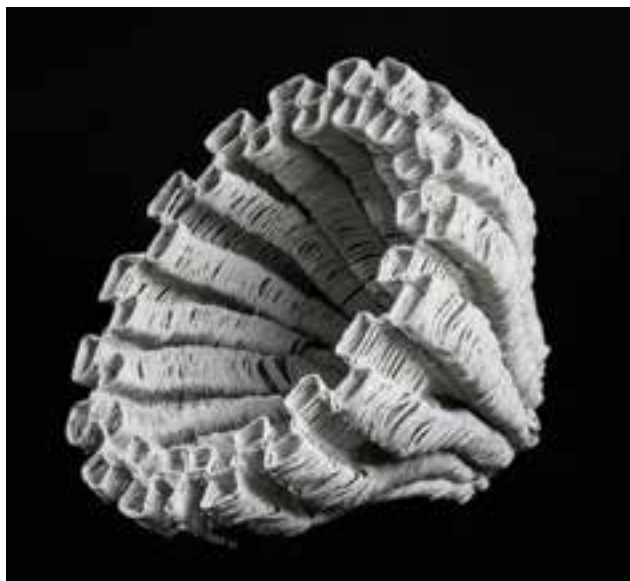
MARÓTI Viktória: Shelter No. 3 Viktória MARÓTI: Shelter No. 3 2019, porcelán, 28 x Ø 30 cm