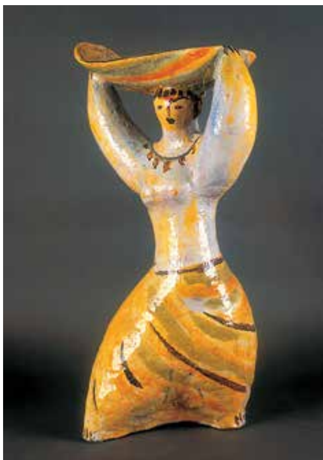
CSEKOVSZKY ÁRPÁD: Tálát tartó női figura Árpád CSEKOVSZKY: Female figure holding a dish 1958 körül, mázas kerámia, magasság: 76 cm (Csekovszky Árpád Művészeti Közalapítvány, Budapest)

Nagyon komoly, munkáiban elmélyült hallgató volt, és évfolyamában őt tartották a legjobbnak. Ekkor Gádor István volt a keramikusok tanára. A mintázást viszont Borsos Miklós vezette, s az ő szuggesztív hatása felülírta a szaktanárokét, és a hallgatók őt követték.