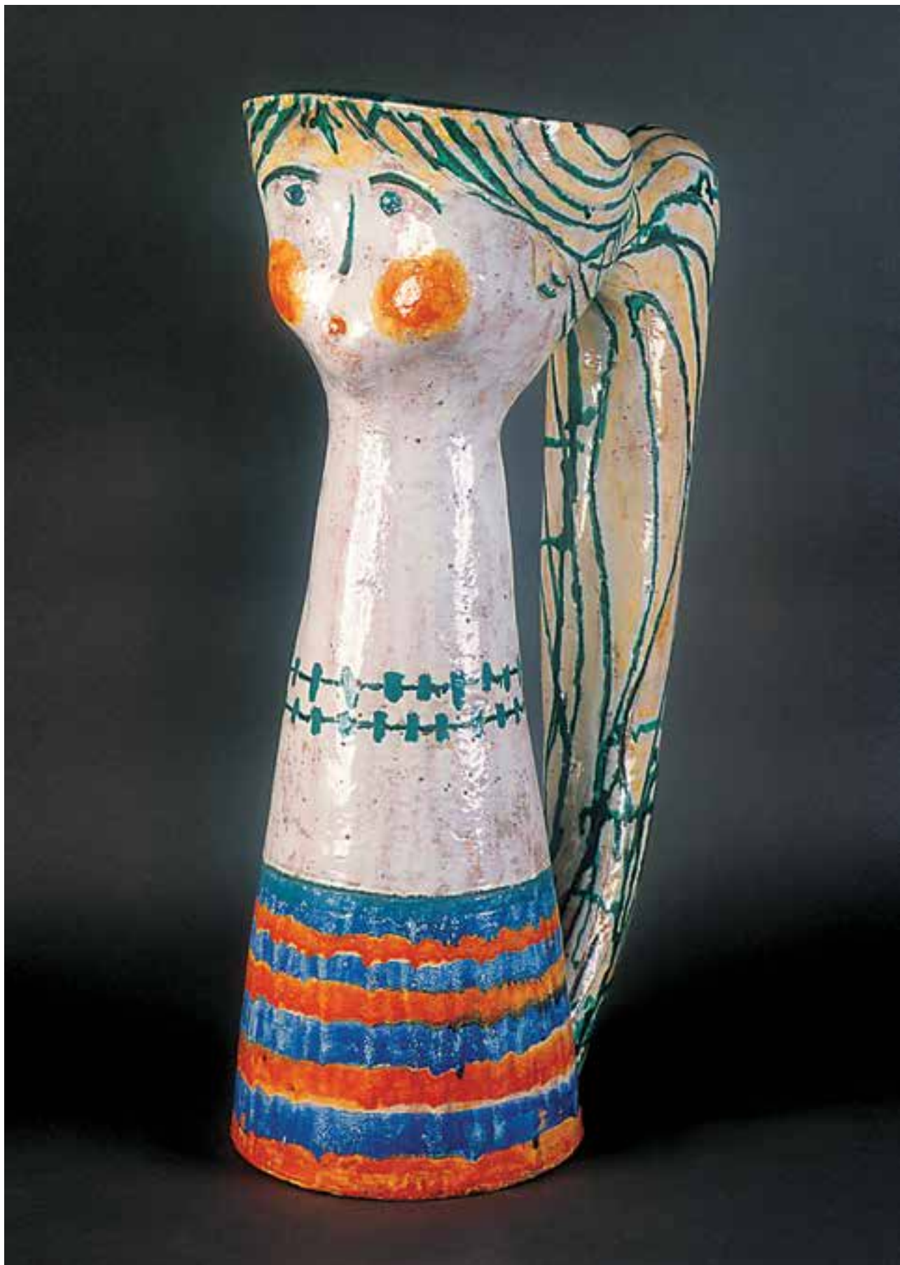
CSEKOVSKY Árpád: Virágtartó plasztika | Árpád CSEKOVSKY: Sculpted flower holder | 1965 körül, mázas kerámia, magasság: 73 cm (magántulajdon)