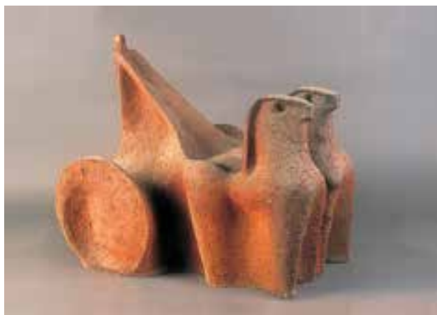
CSEKOVSZKY Árpád: Kocsihajtó | Árpád CSEKOVSZKY: Charioteer | 1970, oxiddal színezett kőcserép, magasság: 58 cm (Csekovszky Árpád Művészeti Közalapítvány, Budapest)