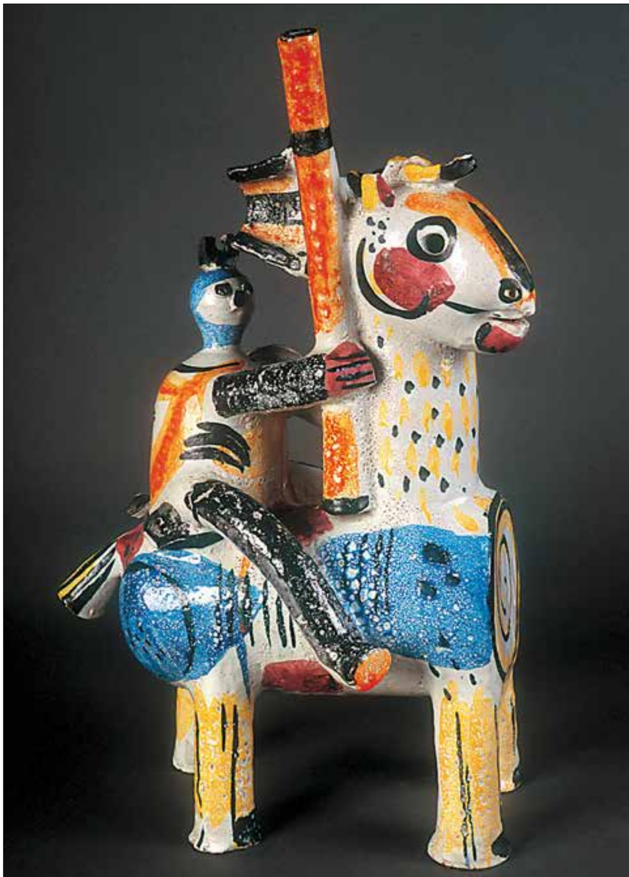
CSEKOVSZKY Árpád: Lovas harcos | Árpád CSEKOVSZKY: Mounted warrior 1966, mázas kerámia, magasság: 48 cm (Csekovszky Árpád Művészeti Közalapítvány, Budapest)