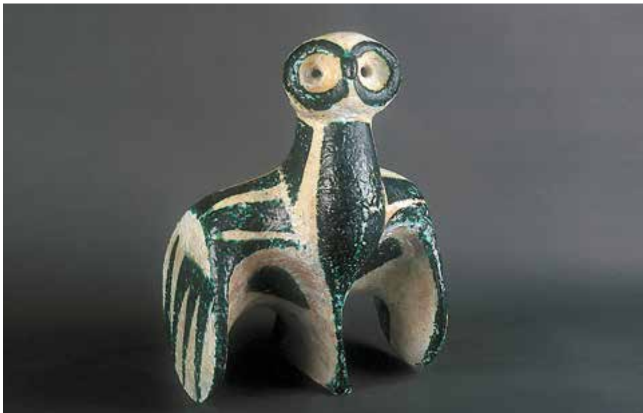
CSEKOVSZKY Árpád: Bagoly | Árpád CSEKOVSZKY: Owl | 1965, mázas kerámia, magasság: 55 cm (Csekovszky Árpád Művészeti Közalapítvány, Budapest)

Nagyon kemény évek voltak ezek. Ekkor volt a Rákosi-korszak fénykora. Ezt tetézte még, hogy a főiskolán tanult Rákosi Mátyásné a porcelán szakon, és már a diplomamunkáját készítette. El lehet képzelni, hogy ebben az időben milyen kitüntetett figyelemben volt részünk a titkosszolgálatoktól.