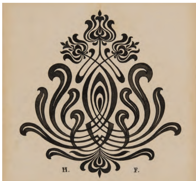
HELBING Ferenc: Záródísz a Magyar Iparművészet folyóirat részére Ferenc HELBING: Tail-piece for the periodical Magyar Iparművészet 1898, papír, tus, eredeti méret: 13,5x12,5 cm (IMM)