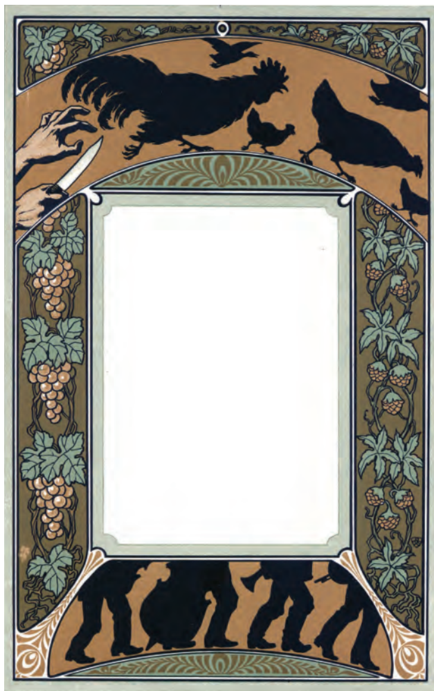
HELBBING Ferenc: Étlap terve | Ferenc HELBBING: Plan of a menu card 1910-es évek eleje, színes litográfia, 28,9x18,5 cm (IMM)

Helbingnek az első világháború után alkalmazott grafikai, iparművészeti karrierjében is új szakasz kezdődött. Pozíciójánál fogva elsősorban állami, hivatalos megrendeléseket teljesített. Ő tervezte a két háború közötti új koronás, illetve az új pengős bankjegyeket, 1919 és 1923 között huszónégyféle koronacímlet, 1926-ban és 1945–1946-ban pedig tizennyolc típusú pengőcímlet került forgalomba rajzai alapján – Helbinget mint