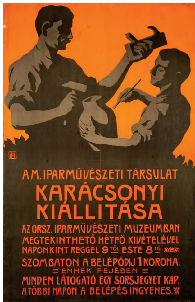
HELBBING Ferenc: A Magyar Iparművészeti Társulat karácsonyi kiállításának plakátja | Ferenc HELBBING: Poster of the Christmas showing of the Hungarian Society of Decorative Arts | 1904 körül, színes litográfia, 102x63 cm, Rigler József Ede Papírneműgyár Rt., Budapest (OSZK)