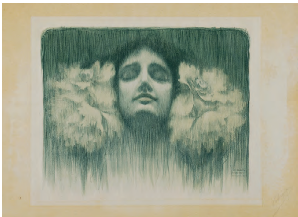
HELBING Ferenc: Álom Ferenc HELBING: Dream 1902, egyszínnyomású litográfia, 35x44 cm (Magyar Nemzeti Galéria, Budapest)