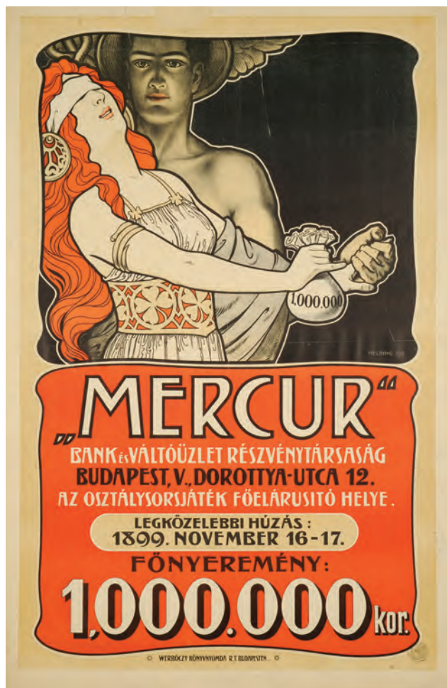
HELBBING Ferenc: A Mercur Bank és Váltóüzlet Rt. plakátja Ferenc HELBBING: Poster of the Mercur Bank and Exchange Office Co. 1899, színes litográfia, 90x60 cm, Werbőczy Könyvnyomda Rt., Budapest (Országos Széchényi Könyvtár, Kisnyomtatványtár, Budapest [OSZK])

aranykarikával a fülében. A szöveg a plakát felső harmadába került, gonddal formált, kimunkált, rajzolt szecessziós betűkkel. 1904-ben készült a Hermaneczi Papírgyár jubileumát hirdető plakátja , amelyen könyvekkel sűrűn telerakott polc előtt, írópultnál álló, munkájába mélyedő szerzetest ábrázolt. Másféle grafikai megoldást mutat egy 1905 körülre datálható, a Rigler cég fényképeseti eszközeinek hirdetéséhez készült plakátterv . Itt a sötétkamra jellegzetes fényviszonyai között, vörös és fekete színek árnyalataival jelenik meg az amatőr fényképész és neje. Hasonló fényárnyék, tónusos színkezelés jellemzi azt a szintén ez időben (1904–1905 körül) készült plakátot , amely az Iparművészeti Társulat karácsonyi kiállítását hirdette . 1904 és 1907 között Kertész József nyomdája számára is készített több naptártervet , ezek közül néhány lapon a nyomdászathoz – vagyis a céghez magához – kötődő kompozíciót láthatunk. Hasonlóképpen, a Rigler cég hirdető kártyán is személyes felhanggal alkalmazta a motívumot: saját magát ábrázolta a munka egy pillanatában.