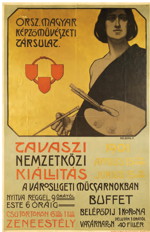
HELBBING Ferenc: Az Országos Magyar Képzőművészeti Társulat Tavaszi Nemzetközi Kiállításának plakátja Ferenc HELBBING: Poster of the International Spring Exhibition of the Hungarian Fine Arts Society 1901, színes litográfia, 93x63 cm, Kunossy Vilmos és Fia Műintézete, Budapest (OSZK)