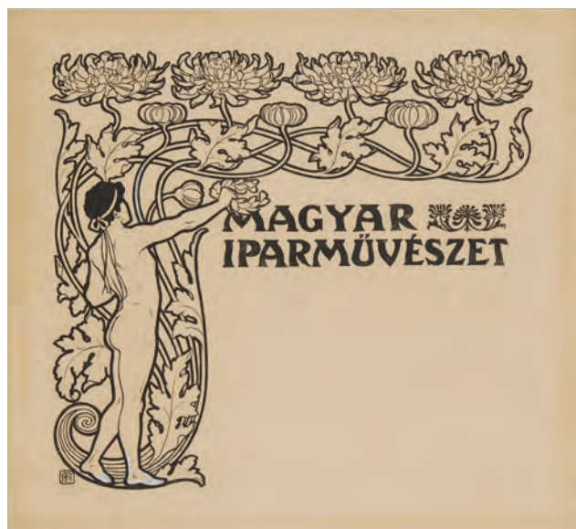
HELHING Ferenc: Fejlécterv a Magyar Iparművészet folyóirat részére Ferenc HELBING: Design of the head-band for the periodical Magyar Iparművészet 1898, papír, tus, 19,7x21,5 cm (Iparművészeti Múzeum, Adattár, Budapest [IMM])

1901-től a Rigler József Ede vezette nyomdai intézetben dolgozott vezető litográfusként, de más megrendelése is voltak. Folyóiratcímlapokat, könyvkötéseket tervezett,