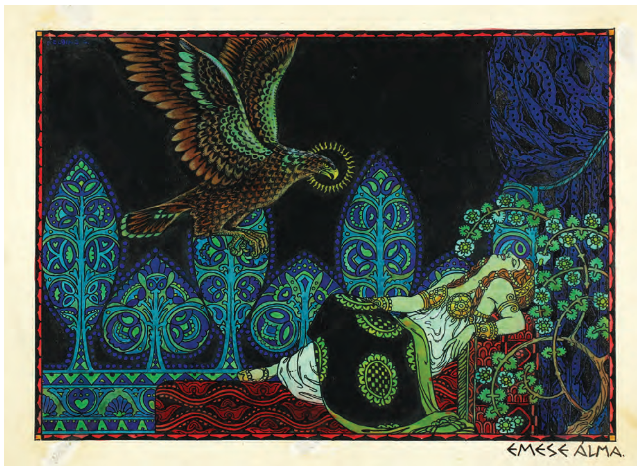
HELBING Ferenc: Emese álma. Illusztráció a Magyar hunmondák című kötetből | Ferenc HELBING: Emese's dream. Illustration for the book of Hungarian Hunnish Legends | 1920, papír, tus, tempera, 23,1x31,1 cm (IMM)

1914 és 1936 között, pályájának utolsó két évtizedében Helbing már nem elsősorban a reklám- és kereskedelmi grafikára koncentrált, tevékenysége 1936-os nyugdíjba vonulásáig három különböző területre összpontosult. Tanára, 1927-től igazgatója volt az Iparművészeti Iskolának, tervezőgrafikusként és iparművészként állami