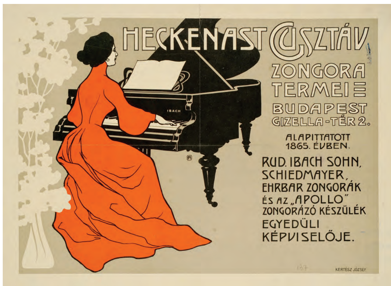
HELBING Ferenc: Heckenast Gusztáv zongoratermeit hirdető plakát | Ferenc HELBING: Poster advertising the piano rooms of Gusztáv Heckenast 1906–1907 körül, színes litográfia, 40x50 cm, Kertész József Könyvnyomdája, Budapest (OSZK)