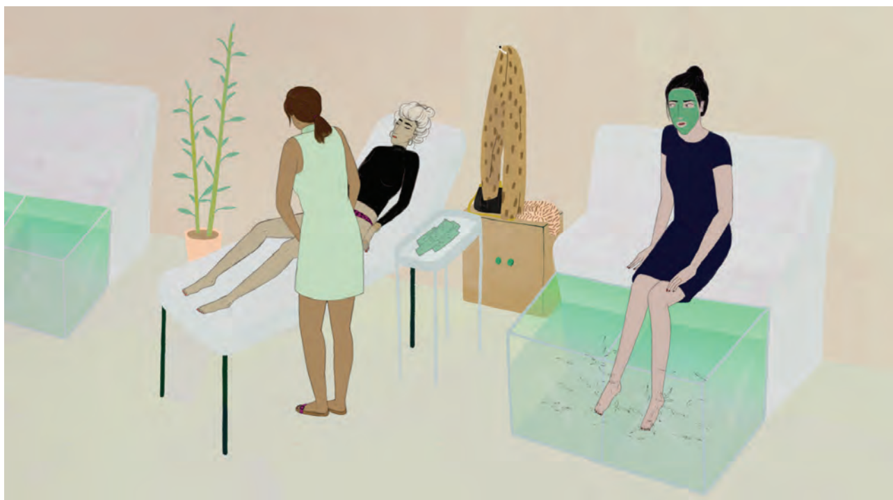
ANDRASEV Nadja: Szimbiózis (részlet) | Nadja ANDRASEV: Symbiosis (detail) 2019, francia–magyar rövidfilm, 12 perc 40 mp, technika: tárgymozgatásos animáció, pixilláció