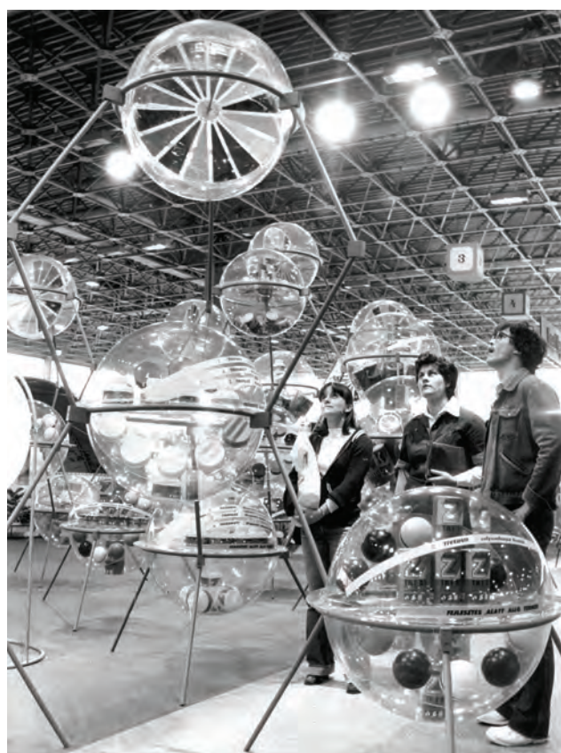
SCHERER József: A Tiszai Vegyi Kombinát kiállítása a Budapesti Nemzetközi Vásáron 1982-ben | József SCHERER: Exhibition of the Tisza Chemical Factory at the Budapest International Fair in 1982