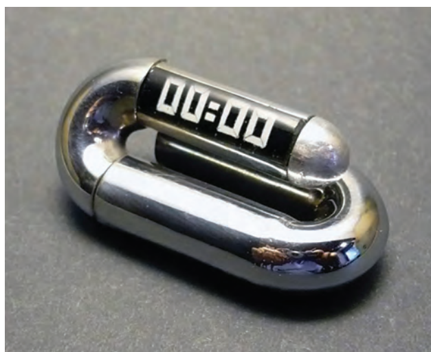
SCHERER József: Óraterv (Nemzetközi óratervezési pályázat, La Chaud-de-Fonds) | József SCHERER: Watch design (International watch designing competition, La Chaud-de-Fonds) 1974