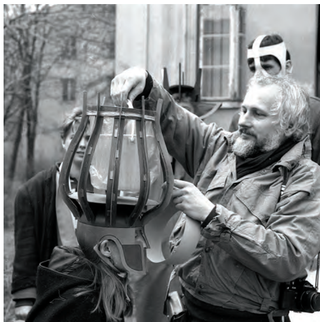
Kreatív tervezési feladat 1987-ben (Magyar Iparművészeti Főiskola, Alapképző Intézet) Creative planning task in 1987 (Hungarian College of Applied Arts, Basic Course Institute)

A rendszerváltást követően, a Schrammel Imre vezetésével visszaállított ötéves oktatási rendszerben újabb kihívásokat kapott, előbb az Alapképző Intézetnek az új helyzethez való továbbalkotását, később pedig –