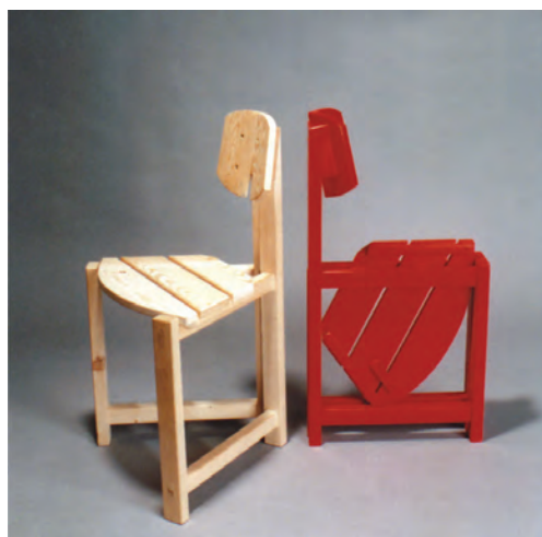
SCHERER József: Összecsupkható szék (IKEA-pályázat, első díj) József SCHERER: Folding chair (IKEA competition, first prize) 1989