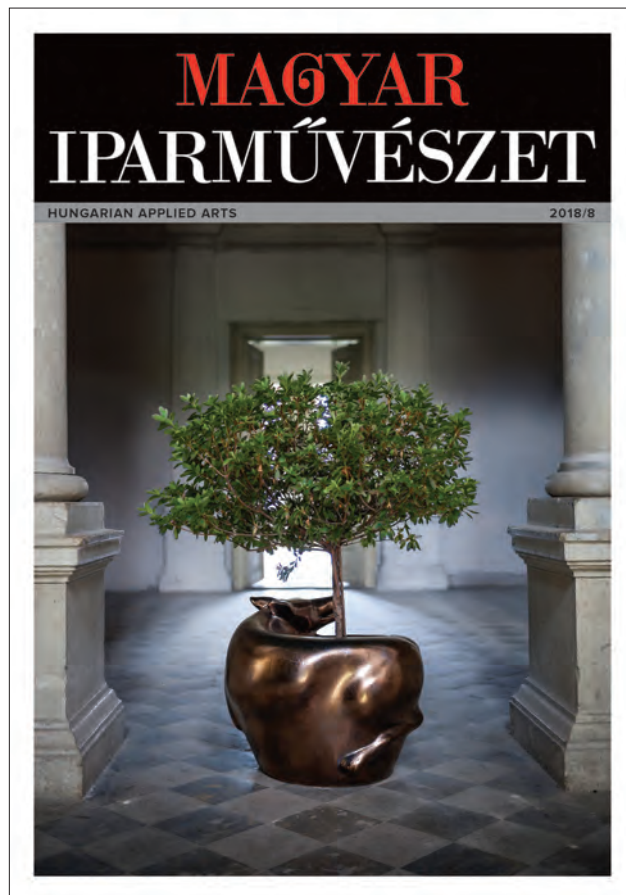
A Magyar Iparművészet 2018/8. 25 éves jubileumi számának címlapja. Arclatterv: SCHERER József. Grafikai tervezés: NAGY Norbert Front cover of Magyar Iparművészet / Hungarian Applied Arts Anniversary Issue 8/2018. Magazine identity design: József SCHERER. Graphic design: Norbert NAGY

zésével és gondozásával. A felmerülő kérdések és feladatok nem fárasztották, sőt örömmel tett eleget a rendszeres telefonhívásoknak. Ezek a hívások április közepétől azonban válasz nélkül maradtak – szokásától eltérően. Hosszú ideje lappangó betegsége elementáris erővel tört rá, és kegyetlenül rövid időn belül végzetessé vált. Drámai küzdelme végén elaludt csendesen.