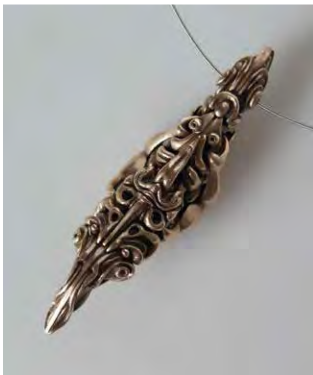
PALKOVICS Attila: Kapaszkodó – nyakék (vizsgamunka). Felkészítő tanár: KAIN TZ Regina | Attila PALKOVICS: Clinging – necklace (work for examination). Tutor: Regina KAIN TZ 2017, bronz, ezüst, viaszveszejtési öntés, hosszúság: 11 cm