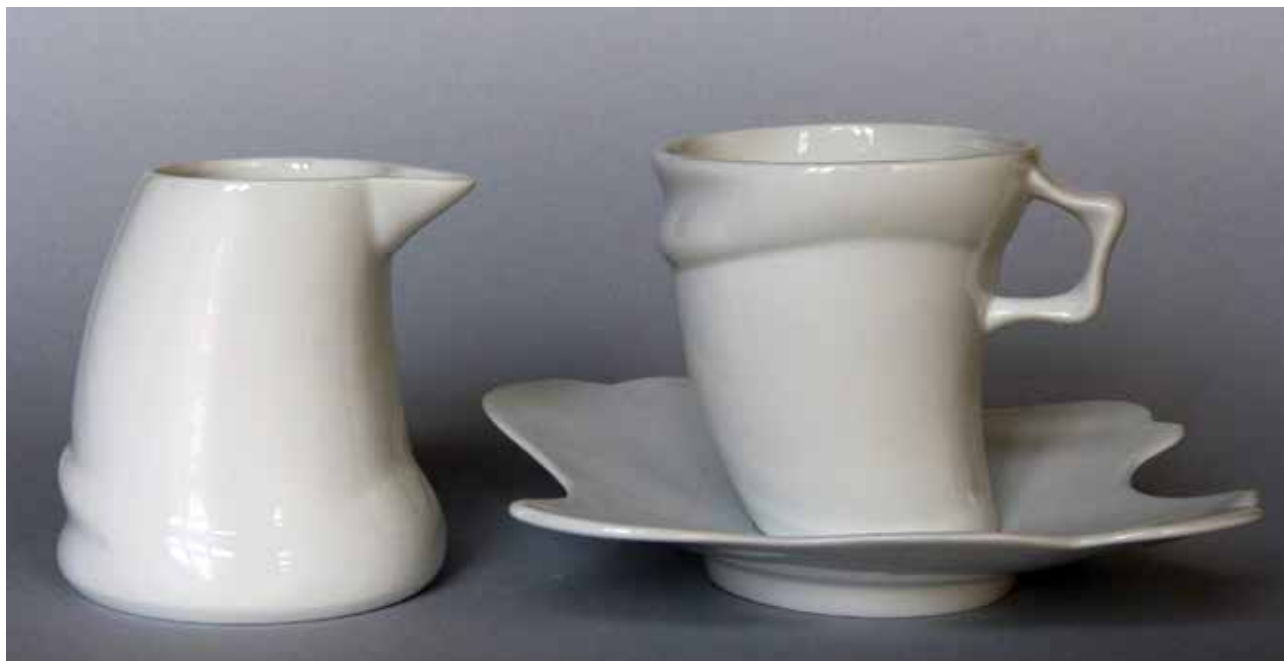
TAKÁTS Anna Júlia: Kávészakészlet. Felkészítő tanár: HABER Szilvia | Anna Júlia TAKÁTS: Coffee set. Tutor: Szilvia HABER 2019, mázas porcelán, 1360 °C; a csésze magassága: 13 cm, kistányér: 3x19x16 cm, a tejköntő magassága: 13 cm Fotó: Makáryné Fodor Éva