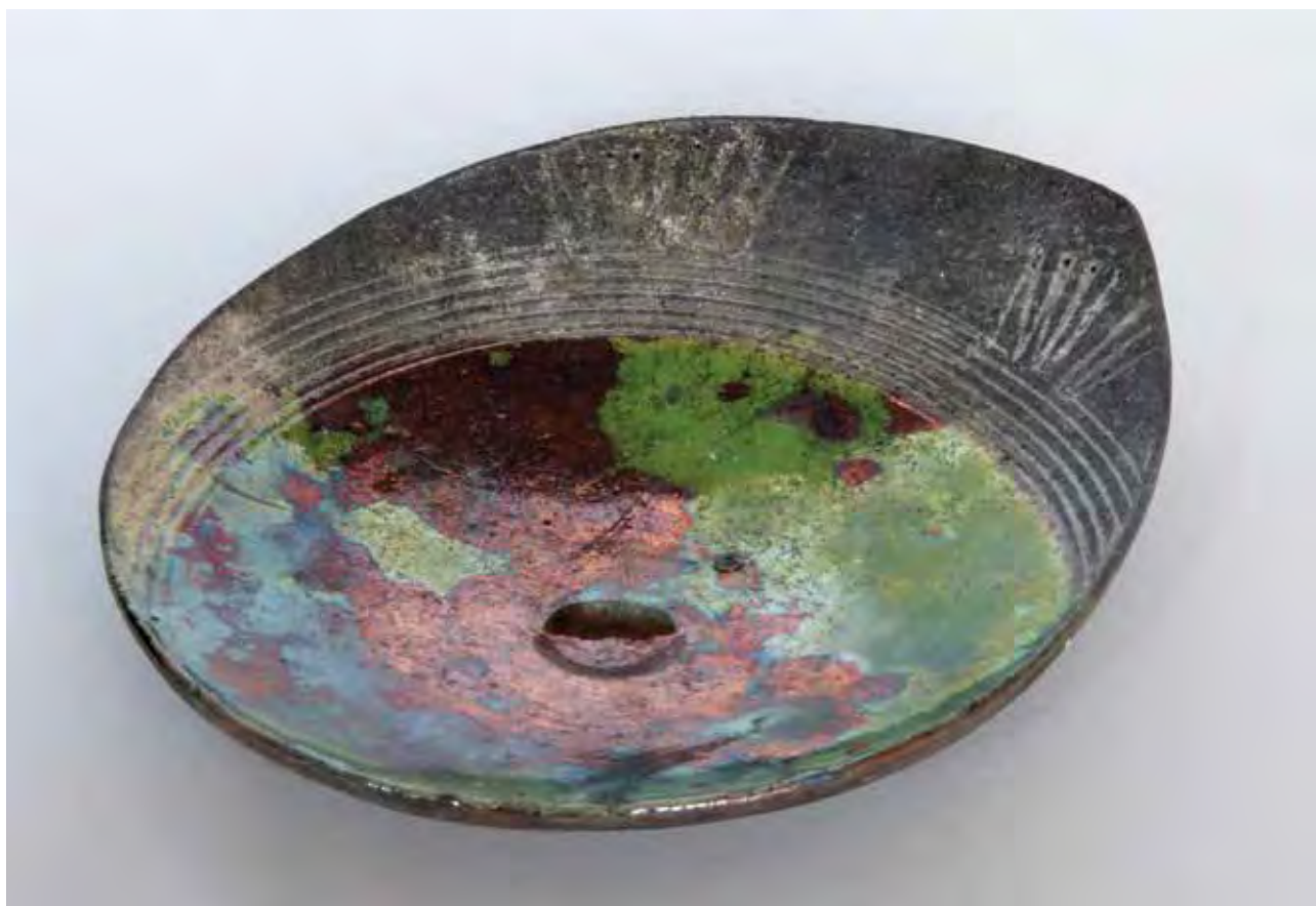
PEROSA Renáta: Kínálótálka. Felkészítő tanár: GYŐRI Anita | Renáta PEROSA: Small dish. Tutor: Anita GYŐRI 2019, mázas kerámia, rakutechnika, 4x18x15 cm