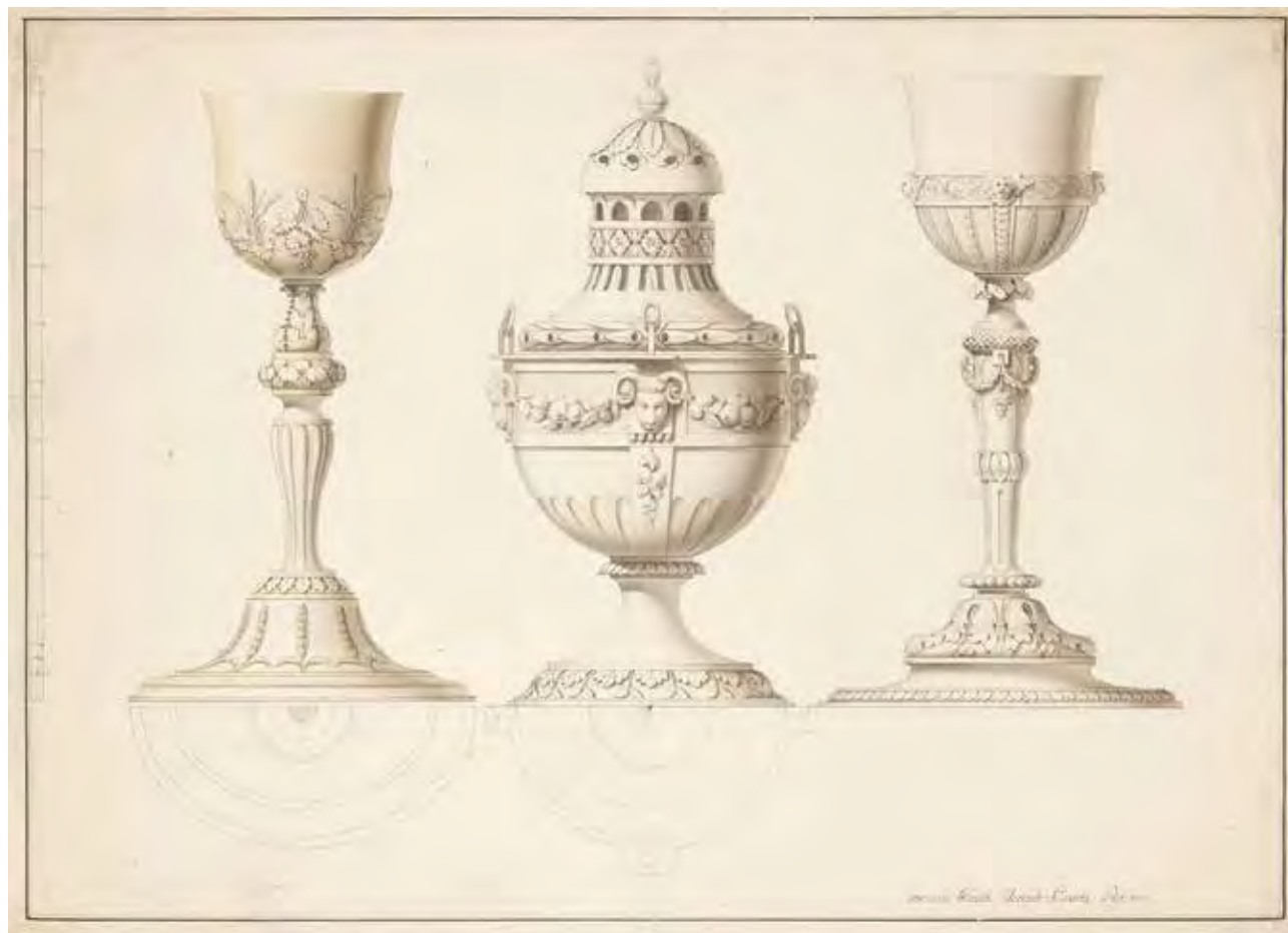
Joseph SCHWARTZ: Liturgikus tárgyak rajza | Joseph SCHWARTZ: Drawing of Liturgical Objects | 1800, papír, lavírozott tus, 42x58,5 cm (Schola Graphidis Művészeti Gyűjtemény, Magyar Képzőművészeti Egyetem [MKE] – Képző- és Iparművészeti Szakgimnázium)

Schola Graphidis Budensis (Budai Rajziskola) eredetileg az iparosok művészi szintű rajzi képzését tűzte ki célul, amely az évszázadok folyamán a funkció változásával módosult. A Schola Graphidis Művészeti Gyűjtemény a Schola Graphidis Budensishez és utódintézményeihez (1778–1886 Schola Graphidis Budensis [Budai Rajziskola], 1778–1886 Pesti Rajzoló Oskola, 1886–1946 Budapest Székesfővárosi Iparrajziskola, 1946–1950 Szépműves Líceum) köthető,