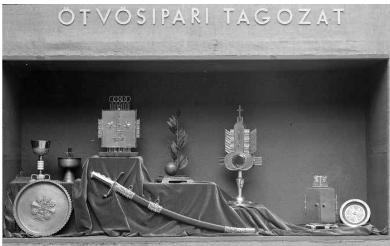
Fényképezési Osztály, Budapest Székesfővárosi Iparrajziskola: Az 1941-es Nemzeti Szalon kiállítás enteriőrje. Fotódokumentáció a Budapest Székesfővárosi Iparrajziskola kiállítási enteriőrjéről az 1941-es budapesti Nemzeti Szalon kiállításon | Interior of the Budapest National Salon Exhibition in 1941. Photographic documentation of the exhibition interior of the Metropolitan Municipal Technical Drawing School (Budapest) at the Budapest National Salon Exhibition in 1941 | 20. század első fele, zselatinos szárazlemez, az eredeti lemez mérete: 13x18 cm (Schola Graphidis Művészeti Gyűjtemény, MKE – Képző- és Iparművészeti Szakgimnázium)