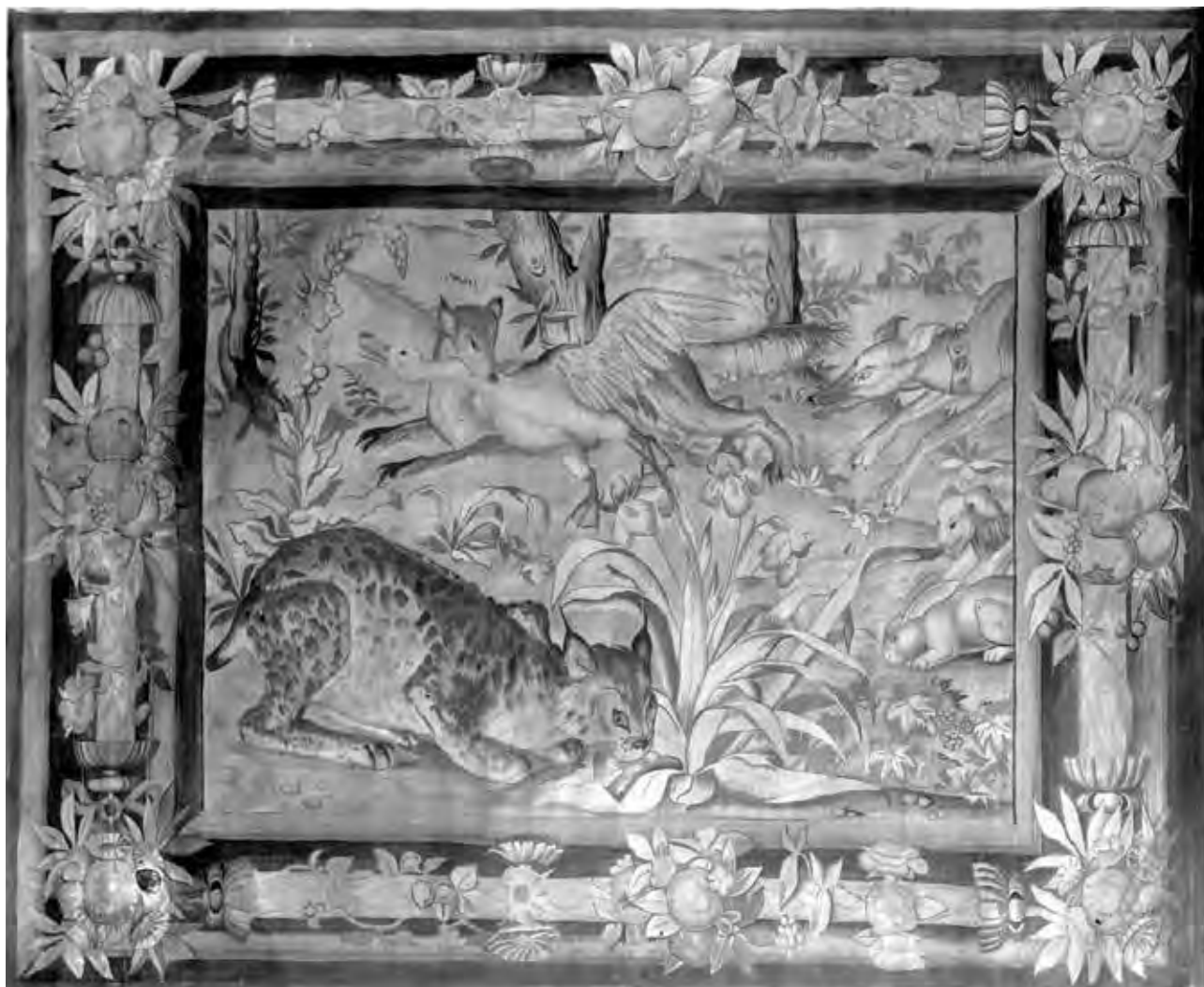
Fényképészeti Osztály, Budapest Székesfővárosi Iparrajziskola: Gobelin. Fotódokumentáció a Budapest Székesfővárosi Iparrajziskola textilműhelyében készült műtárgyról | Gobelin. Photographic documentation of the art object made in the Textile Atelier of the Metropolitan Municipal Technical Drawing School, Budapest | 20. század első fele, zselatinos szárazlemez, az eredeti lemez mérete: 18x24 cm (Schola Graphidis Művészeti Gyűjtemény, MKE – Képző- és Iparművészeti Szakgimnázium)

A gyűjtemény muzeológiai szempontú feldolgozása meglehetősen szerteágazó feladat, hiszen a múzeumi szakanyag mellett könyvtári és levéltári állományok is feldolgozásra várnak. 2015-ben a Grafikai Gyűjtemény, a Gipszmásolat- és Szoborgyűjtemény, valamint a Régi Könyvgyűjtemény muzeológiai szempontú feldolgozása kezdődött el, a tárgyleíró adatoknak online is elérhető adatbázisban ( www.scholagraphidis.omek.net ) történő rögzítésével és a műtárgyfotózással. Ugyanebben az évben indult el a gyűjtemény magyar és angol nyelvű weboldala ( www.scholagraphidis.hu ), valamint ekkor rendeztük az első bemutatkozó gyűjteményi kiállítást a FUGA Budapesti Építészeti Központban Akik Budapestet építették címmel. Ez utóbbi a gyűjteményben őrzött muzeális tárgyakon (építészeti könyvek és műlapok, gipszmodellek, építészeti tárgyú hallgatói rajzok) keresztül mutatta be az első hazai állami művészetoktatási intézmény, a Budai