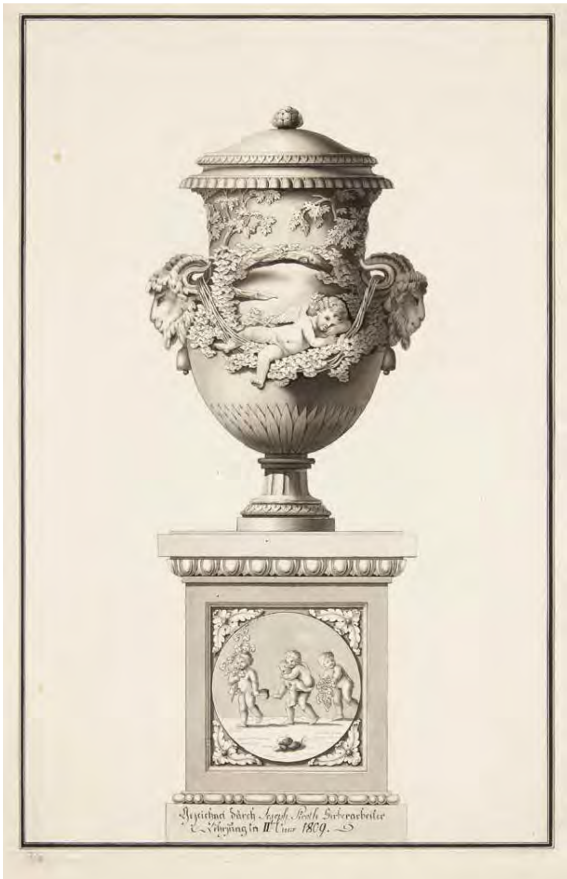
Joseph PIROTH: Urna rajza puttókkal | Joseph PIROTH: Drawing of an Urn with Puttos 1809, papír, lavírozott tus, 46,7x29,7 cm (Schola Graphidis Művészeti Gyűjtemény, MKE – Képző- és Iparművészeti Szakgimnázium)