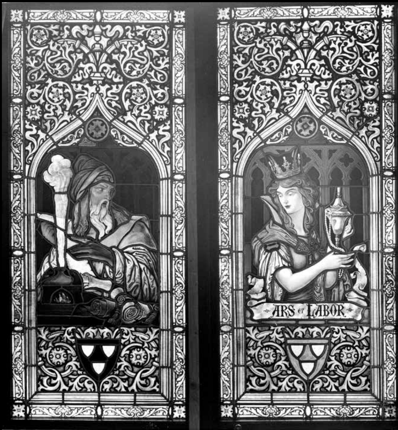
Fényképészeti Osztály, Budapest Székesfővárosi Iparrajziskola: Ars et Labor. Üvegablak. Fotódokumentáció a Budapest Székesfővárosi Iparrajziskola üvegművesműhelyében készült műtárgyról | Ars et Labor. Stained Glass. Photographic documentation of the art object made in the Glass Atelier of the Metropolitan Municipal Technical Drawing School, Budapest | 20. század első fele, zselatinos szárazlemez, az eredeti lemez mérete: 18x13 cm (Schola Graphidis Művészeti Gyűjtemény, MKE – Képző- és Iparművészeti Szakgimnázium)