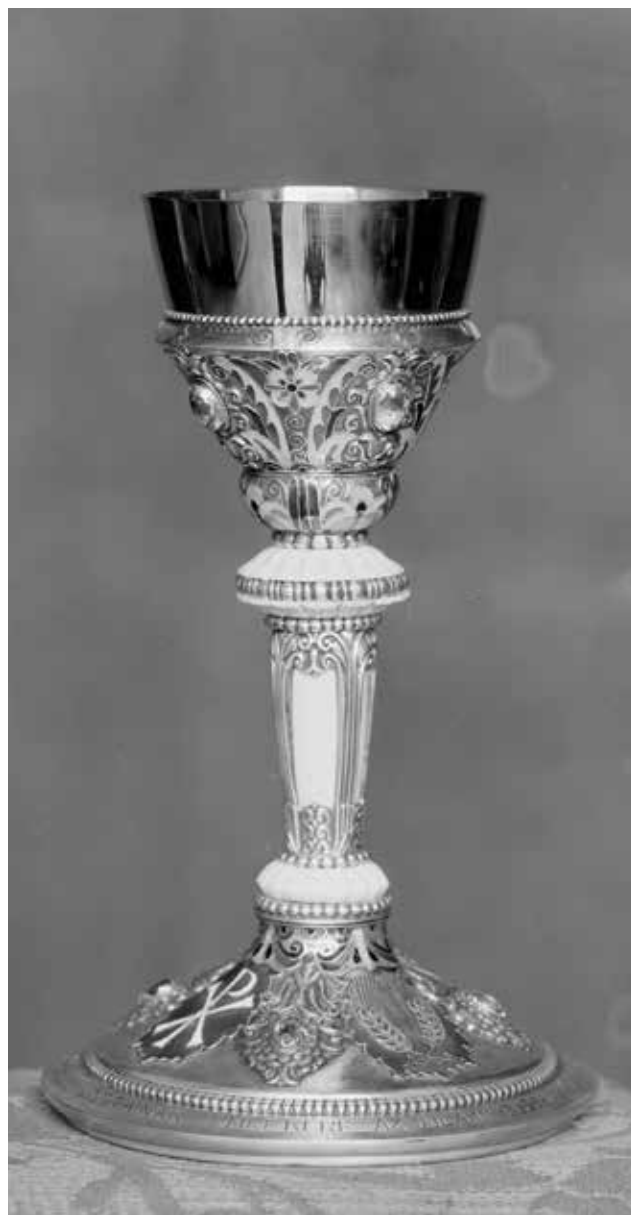
Fényképészeti Osztály, Budapest Székesfővárosi Iparrajziskola: Serleg. Fotódokumentáció a Budapest Székesfővárosi Iparrajziskola ötvösműhelyében készült műtárgyról

A gyűjteményi feltárás mellett fontos szempont volt a speciális műtárgyállomány kiállításokon és online történő bemutatása, amelynek kiemelkedő eredménye volt, hogy a gyűjtemény az intézmény képviseletében 2015 és 2017 között részt vett az AthenaPlus nevű európai