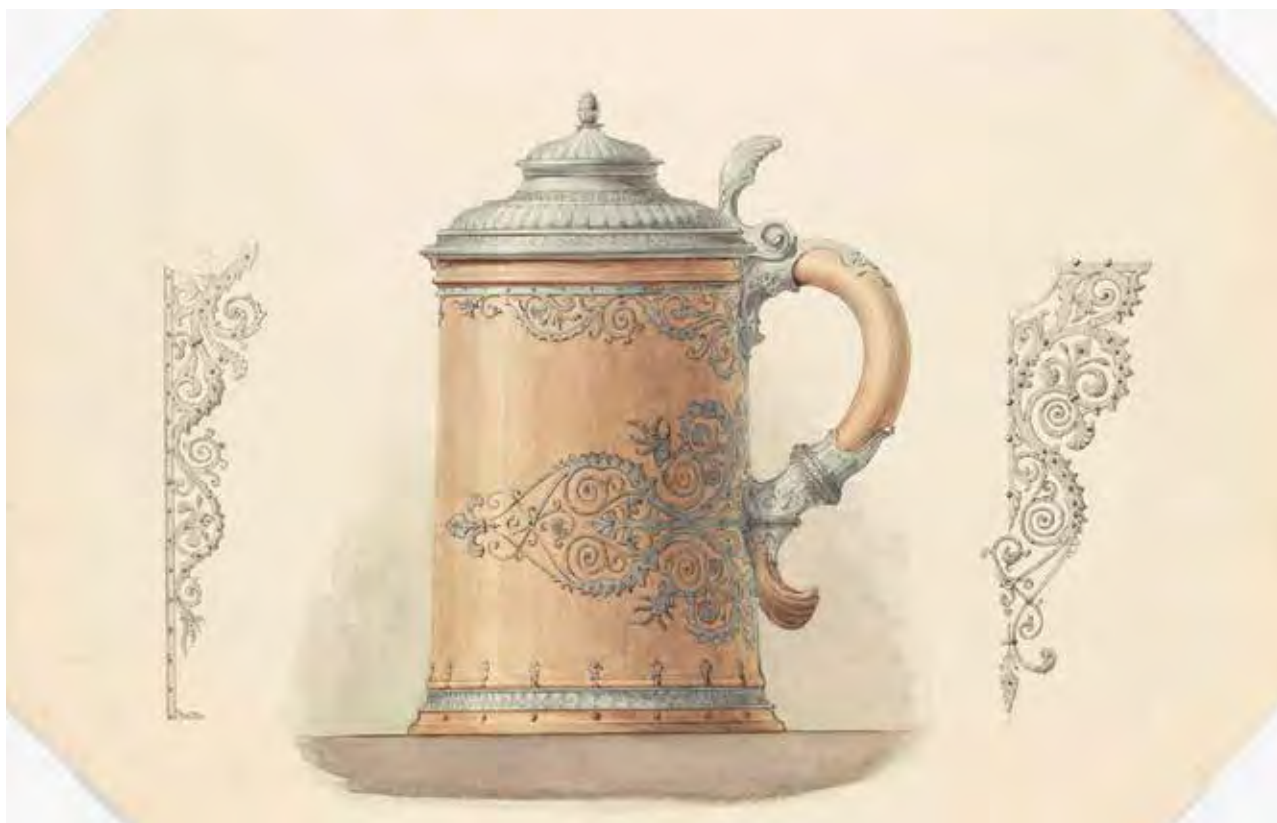
Ismeretlen: Fedeles kupa | Unknown: Beaker with cover | 19. század közepe, papír, tus, akvarell, 28x40 cm (Schola Graphidis Művészeti Gyűjtemény, MKE – Képző- és Iparművészeti Szakgimnázium)