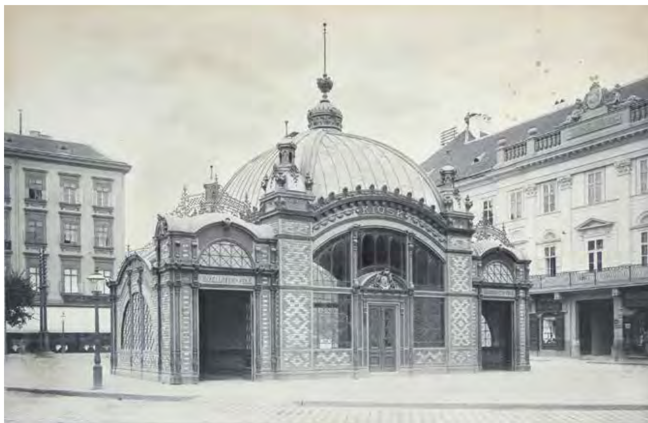
KLÖSZ György: A Deák Ferencz-téri lejárócsarnok és kiosk nézete. Tervező: BRUGGEMANN György

A Gipszmásolat- és Szoborgyűjtemény az iskolának egy olyan speciális és ritkaságszámba menő, bár kis darabszámú gyűjteményi egysége, amely a gipszminták oktatási célú felhasználásának keresztmetszetét reprezentálja a századforduló időszakából. Az évkönyvek 1900-ban több mint 1600 darab gipszmintáról számolnak