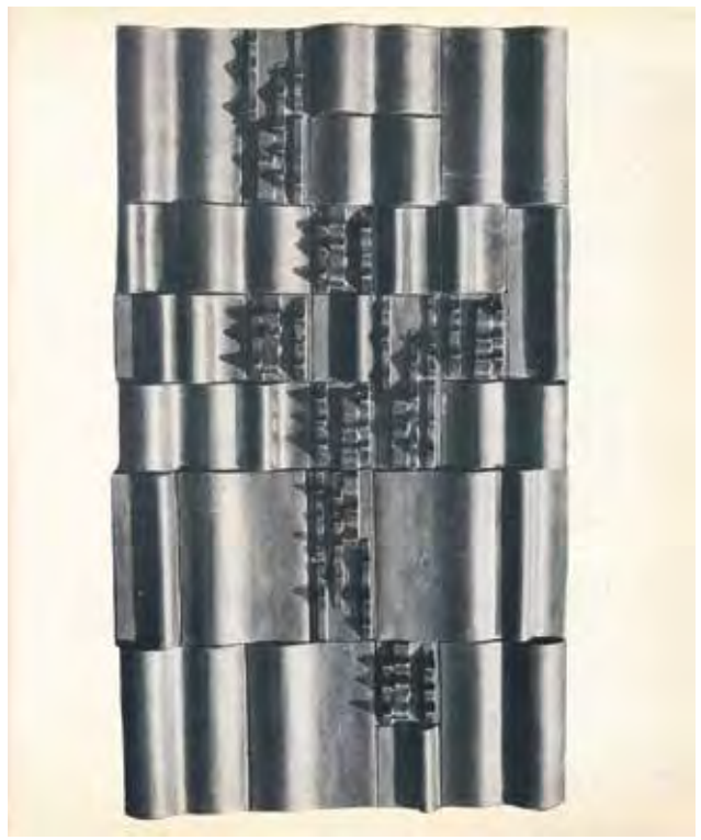
A pécsi II. Országos Kerámia Biennálé katalógusának oldala SZEKERES Károly magastűzű mázas kerámia falburkolatával.

A page in the catalogue of the II nd National Ceramics Biennale in Pécs with Katalin SZÁVOSZT's semi-porcelain wall-tiling. Design: Sándor PINCZEHELYI. 1970