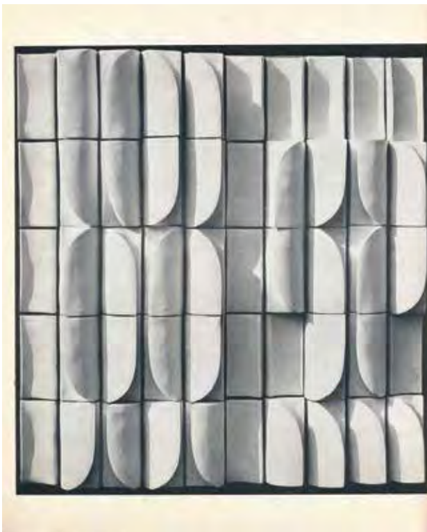
A pécsi II. Országos Kerámia Biennálé katalógusának oldala SZÁVOSZT Katalin félporelán falburkolatával.

A page in the catalogue of the II nd National Ceramics Biennale in Pécs with Hedvig MAJOROS' glazed chamotte wall picture. Design: Sándor PINCZEHELYI. 1970