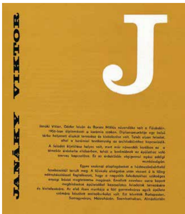
JANÁKY Viktor és MARIK Eszter Csók István Galériában rendezett kiállításához készült katalógus borítója. Terv: MURAY Róbert Cover of the catalogue of Viktor JANÁKY's and Eszter MARIK's exhibition in the Csók István Gallery. Design: Róbert MURAY | 1965