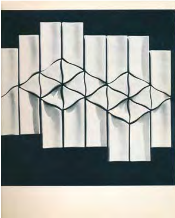
A pécsi II. Országos Kerámia Biennálé katalógusának oldala AMBRUS Éva mázas félporelán falburkolatával.

Terv: PINCZEHELYI Sándor.