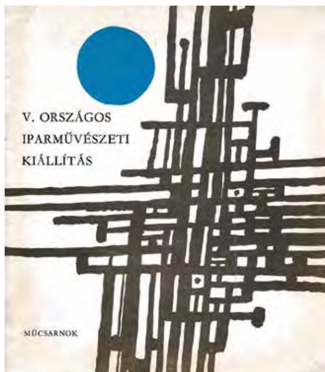
A Műcsarnokban 1965–1966-ban megrendezett V. Országos Iparművészeti Kiállítás katalógusának borítója. Terv: SZILVÁSY Nándor Cover of the catalogue of the V th National Applied Arts Show in the Műcsarnok/Kunsthalle in 1965–1966. Design: Nándor SZILVÁSY

ember környezetére irányul és a mindennapi élet hasznos tárgyait formálja, alakítja. A szépség igényét terjeszti ki az otthonok, a közületi helyiségek, az utcák képére [...]. Az iparművészet hatósugarába vonja szinte az életet – művészi kapcsolatot teremtve az ember és környezete között . A tárgy és környezetalakítás művészi szintre emelése szerves részét képezi társadalmunk kulturális programjának” – olvashatók a ruszini eszme szocialista átíratoként ható, a művészetekbe vetett hitet és optimizmust sugalló mondatok a Magyar Képzőművészek Szövetsége Elnökségének a kinyilatkoztatásaként a hatvanas évek derekán megrendezett V. Országos Iparművészeti Kiállítás katalógusának előszavában. 2