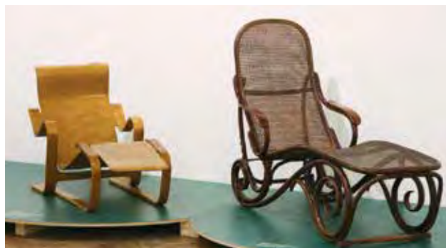
Bugholz, vielschichtig. Thonet und das moderne Möbeldesign című kiállítás (részlet). BREUER Marcell: Plywood fekvőszék, kivitelezés: Isokon-Luterma (balra); és August THONET: Állítható fekvőszék, kivitelezés: Gebrüder THONET | Bentwood and Beyond. Thonet and Modern Furniture Design (exhibition photo). Marcel BREUER: Plywood deckchair, manufacturer: Isokon-Luterma (left); and August THONET: Adjustable deckchair, manufacturer: Gebrüder THONET London, 1935–1936, tömör és rétegelt nyírfá; Bécs, 1875, természetes bükk, nádazva

legelegánsabb üzletház Budapest belvárosában. A Váci utcában ma is megtalálható, reprezentatív épületet a korszak jeles magyar építészei tervezték, és 1889-ben nyitották meg. 15 Mindenesetre óriási igény volt a sokféle bútorra; 1893-ban már több mint egymillió darab készült évente belőlük gyáraikban. 16