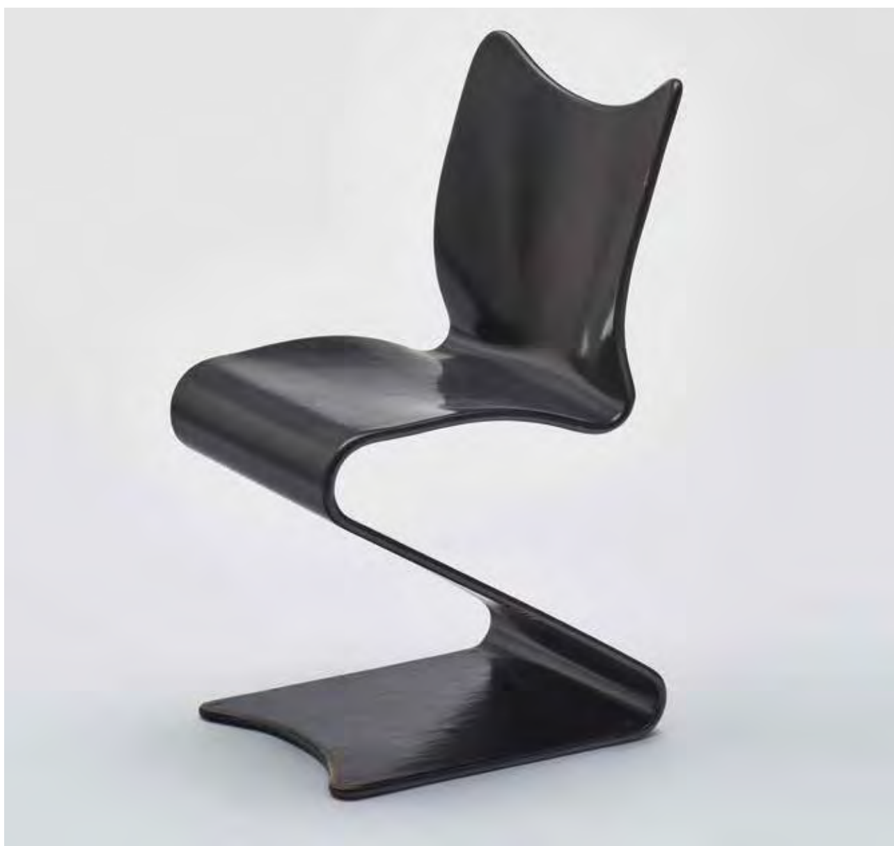
Verner PANTON: S275-ös szék | Verner PANTON: Chair S275

Az ünnepi esemény és a tárgyak összértéke a nyújtott látvánnyal aligha vethető össze; a rendezés és a kiállítás installálása több mint kérdésesre sikerült. Különösen nehezen elfogadható a székek közel azonos szintű – alacsony – egymás melletti bemutatása a magas belmagasságú térben; a többnyire kitakaratlan falak a vakablakokkal és a gazdagon elhelyezett tűzpiros tűzoltókészülékekkel. Ezek kifejezetten zavaróak, teljességgel megoldatlanok maradtak mindvégig. Kor- és téridéző képek, rajzok, fotók, videók sehol, pedig e székek mindenkor, mindenhol valamilyen situációban funkcionáltak. Félreértés ne essék, nem makarti kiállításstervezést és rendezést hiányolok (bár éppen a 19. század végi anyagnál az is lehetett volna), de értelmező megoldásokat igen. Így egy megszállott szakembernek (tervezőnek, művészettörténésznek) nagy