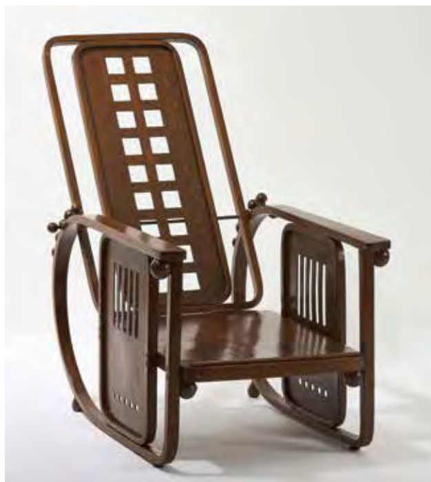
Josef HOFFMANN: 670-es számú állítható klubfotel, népszerű nevén „Ülőgép” Josef HOFFMANN: Reclining armchair No. 670 nicknamed ‘Sitting machine’ Bécs, 1905, kivitelezés: 1906 körül, gyártó: J. & J. Kohn, bükk, tölgyfa hajlítva, plywood, sárgaréz

több szálból összeállt – sikeres vállalat-történetének végigkísérése nem célunk e helyütt, és nem is lehetne megnyugtató módon bemutatni a 22 gyártóhelyen folytatott tevékenységét. 19