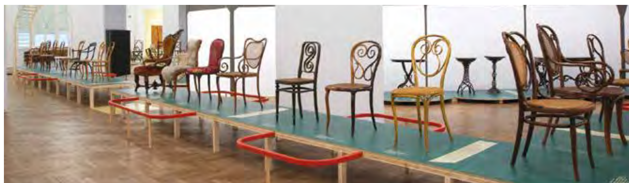
Bugholz, vielschichtig. Thonet und das moderne Möbeldesign című kiállítás (részlet). Az előtérben balról jobbra: karosszék (kiállítva az 1851-es londoni világkiállításon), 39-es szék (1887–1888), 4-es számú szék (1849), 13-as számú szék (1860–1865) Bentwood and Beyond. Thonet and Modern Furniture Design (exhibition photo). In the foreground left to right: armchair (on display in the 1851 London World Fair), chair No. 39 (1887–1888), chair No. 4 (1849), chair No. 13 (1860–1865) | Museum für angewandte Kunst, Bécs, 2019–2020

A cikk az előző lapszámunkban (2020/3, 40–45. oldal) a Museum für angewandte Kunst (MAK) kiállításáról megjelent, a Gebrüder Thonet cég történetének kezdeteit bemutató írás folytatása.