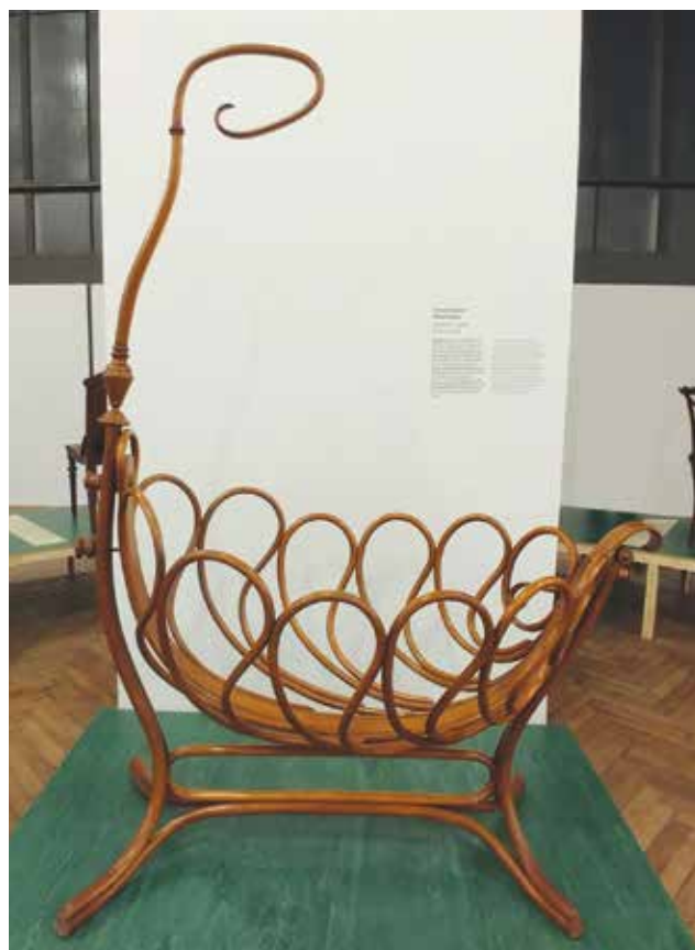
J. & J. Kohn: 3-as számú bölcső | J. & J. Kohn: Cradle No. 3 Bécs, 1898, kivitelezés: 1900 körül, tömör bükkfa, hajlítva (Museum für angewandte Kunst, Bécs)

1900 körül azonban világossá vált, hogy a fejlődés ezen az úton már nem folytatható tovább. A korszellem változása, a Gesamtkunstwerk ideájának megerősödése módosította a piaci keresletet. A hazugnak tartott historizmussal és eklektikával szemben jelentkezett a bécsi iskola, a szecesszió és a premodern tisztító új szelleme és formakultúrája. Fellépésük változást hozott az építészetben és belsőépítészetben és velük együtt a bútortervezésben is: az eddigi használati tárgyak művészeti együttesek részévé váltak maguk is. Eszmei megalapozója a Monarchia nagy tekintélyű építésze és építészeinek nevelője, Otto Wagner (1841–1918) volt racionális tervezésméletével (Nutzstil). 17 Az első lépés megtevője pedig a minden díszítés dühödt ellenfele: Adolf Loos (1870–1933), aki az általa kialakított bécsi Café Museum belsejébe megtervezte az ergonomikus, és szerkezeti elemeinek tökéletes optimalizálása által elegáns 255. számú modellt a változásokra érzékeny J. & J. Kohn számára. A Kohn cég nagy sikerei, különösképpen Gustav Siegelnek (1880–1970) az 1900. évi párizsi világkiállításon bemutatott, négyszögletes keresztmetszetű elemekből épített bútoraival, az irodák, vendéglők és kávéházak használati tárgyaiból a művészeti szalonok nagyra becsült műtárgyai közé emelték a hajlított bútort. A „szabad” és „alkalmazott” művészetek közötti határok átlépéséhez további „művész-építészek” kellett, a bécsi Secession nagy alakjai: Josef Hoffmann (1870–1956),