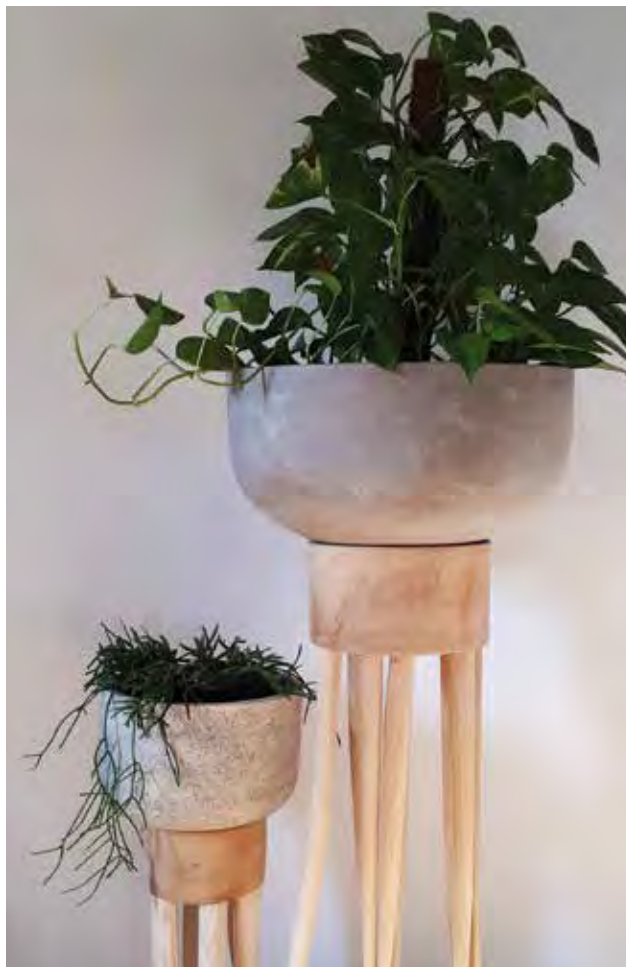
HERTER Katalin Júlia: Kerámia növénytartók falábakon Katalin Júlia HERTER: Ceramic flower pots on wooden legs 2019, kerámia, fa, magasság: 60 cm és 120 cm