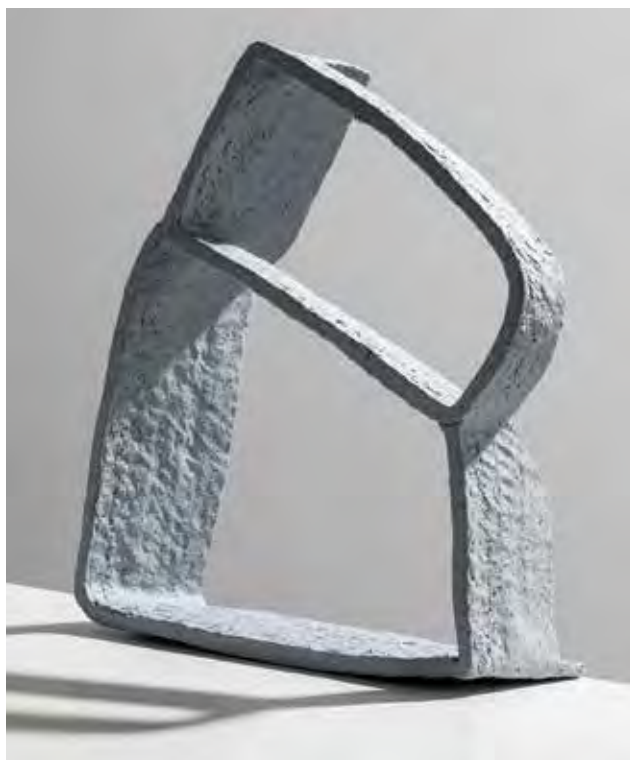
RUZICKSA Tünde: Genius loci No. 2 | Tünde RUZICKSA: Genius loci No. 2 2019, kézzel épített, magas hőfokon égetett speciális kőedény, 50x50 cm

javítható a minősége. Gspann Zsuzsanna divat- és textiltervező, valamint design- és vizuálművészet-tanár, a MOME-n végzett, előtte a Képző- és Iparművészeti Szakközépiskolában bőrműves szakon tanult. Mindig is érdekelték a mintatervezés anyag- és funkciójavító lehetőségei.