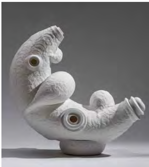
ANDRÁSI Edina: Telepesek a Holdon | Edina ANDRÁSI: Settlers on the Moon 2019, porcelán, 60x55x30 cm

Ösztöndíjas munkái vékony falú, átlátszó, változatos alakú és testű lámpaszobrok, melyeket papír és porcelán egymásra rétegezésével hoz létre. A porcelán égetése során a papír elég, eltűnik az anyagból, a helye azonban érdekes tereket, struktúrákat sejtet. Az eltűnések nyomai a fényben pozitív-negatív mintázatokat, lehetőleg rajzolatot és új anyagminőséget teremtenek. A sokszoros tagoltság és egymásra rétegezés, valamint a fény révén a lámpaszobrok hol kiterjedő, hol összesűrűsödő látványt adnak, a szferikus felületek homorú terekké alakulnak, s a fény árnyékokat rejt. Az eltűnés és a feltárulás, a test és a feloldott tömeg kettősségéből különleges hangulat születik.