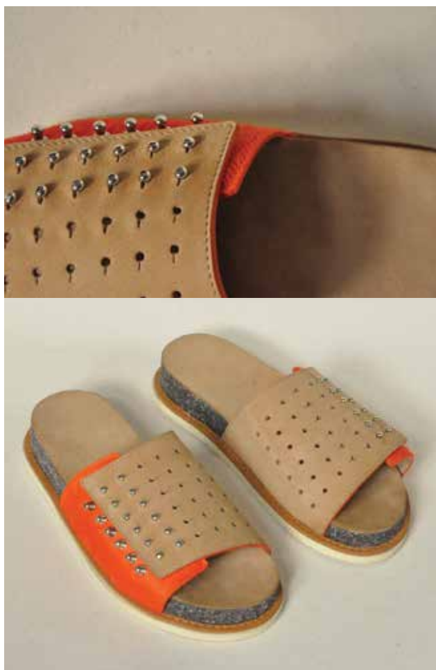
DÉNES Petra: Kauchukka | Petra DÉNES: Kauchukka 2019, felsőrész: bőr, talp: szabászati bőrhulladék és biológiai úton lebomló biopolimer kompozit, 36-os női méret

Zala Zsófia a MOME formatervező szakján végzett, és részt vett a párizsi ENSAAMA (École Nationale