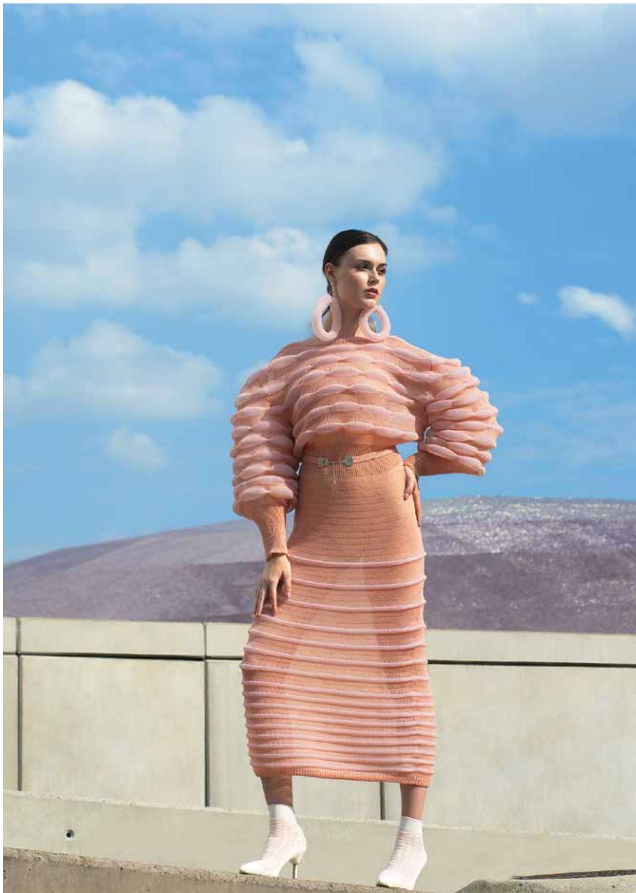
KELEMEN Dóra: Szimbiózis | Dóra KELEMEN: Symbiosis | 2019, kézzel kötött öltözék