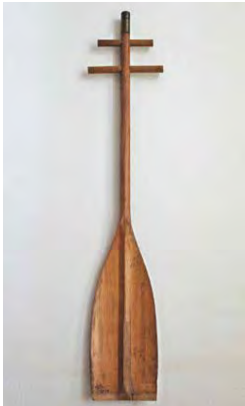
RAINER Péter: A jó kormányos – Evezőkereszt Péter RAINER: The good helmsman – Oar cross 2019, fa, fém, 132x42x14 cm