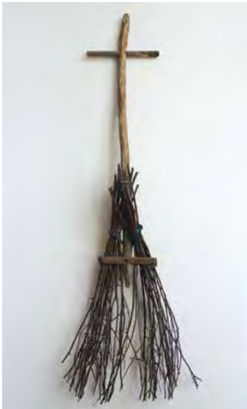
RAINER Péter: Kiűzetés – Seprőkereszt Péter RAINER: Exile – Broom cross 2019, fa, 132x42x12 cm