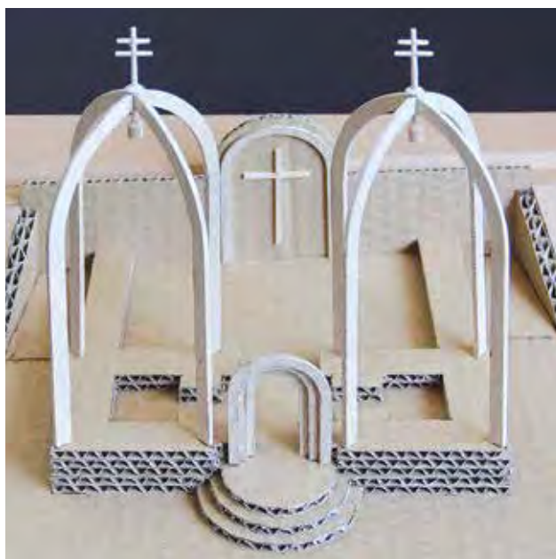
RAINER Péter: Esztergom-kovácsi bazilikom jelölése (makett) Péter RAINER: Symbol of the Esztergom-Kovácsi basilica ruin (mock-up) 2018, papír, fa, 19x30x30 cm Fotó: Rainer Péter