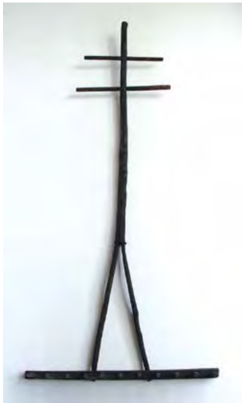
RAINER Péter: A jó pásztor – Gereblyekereszt Péter RAINER: The good shepherd – Rake cross 2019, fa, 180x80x15 cm Fotó: Rainer Péter