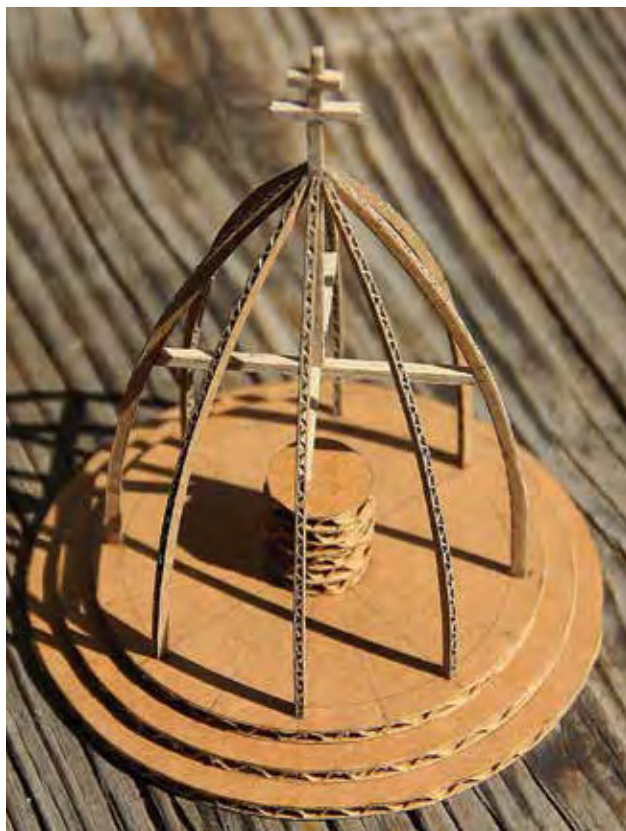
RAINER Péter: Trianon-kápolna II. (makett) Péter RAINER: Trianon chapel II (mock-up) | 2014, fa, papír, 11 x Ø 9 cm

megindult első hazai vasútvonal emlékét őrző, 160 éves történelmi értéket képviselő állomásépületek megmentéséért küzdött a város főépítészeként. S amikor a város vezetősége már nem támogatta ebbéli munkáját, lemondott állásáról, és magánemberként küzdött tovább, míg el nem bontották az állomás közel harminc (!) épületét.