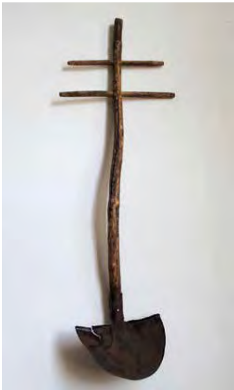
RAINER Péter: U(n)gar – Ásólapátkereszt Péter RAINER: U(n)gar – Shovel cross 2019, fa, fém, 132x42x14 cm