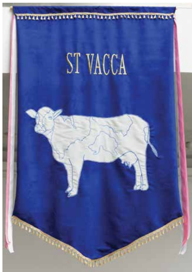
Ola KOZIOŁ: St. Vacca | Ola KOZIOŁ: St. Vacca 2017, selyem, rövidáru, hímzés, applikálás és varrás, 250x150 cm

Egyikük, Ola Kozioł három műből álló sorozattal szerepel a kiállításon: St. Vacca , St. Gallus és St. Scrofa . Mindhárom alkotás első ránézésre templomi zászlóra hasonlít. A művésznő a haszonállat-tenyésztés etikai problémáira hívja fel a figyelmet: szentként, mártírként jeleníti meg a három legnagyobb számban feldolgozott állatfajtát, a marhát, a csirkét és a sertést.