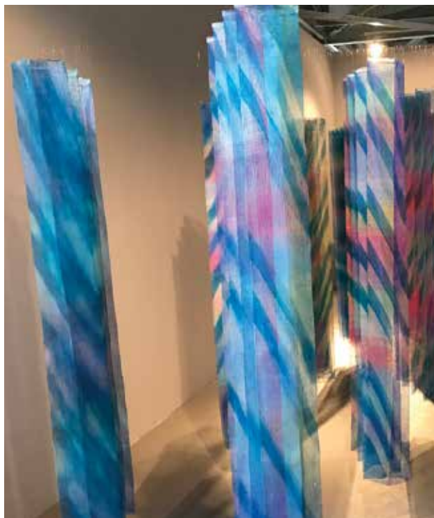
VATANABE Minako: Aqua – Tone Color of Water (részlet) Minako WATANABE: Aqua – Tone Color of Water (detail) 2018, selyem, többbrétegű szövés, itadzime-sibori technika 300x170x280 cm

A művészek egy másik rétegének a textilművészet ellenszer – ahogyan azt Marta Kowalewska hangsúlyozta. Antidótum a rohanó világunkra: lassítás. Maga a textil, annak technikája megköveteli a koncentrációt, az agy és a kéz kooperációját a hosszú alkotói folyamat alatt. Hangsúlyosan jelent meg a triennálén a környezetvédelem, és ezzel összefüggésben a fogyasztói társadalom, az állattenyésztés és az állatkísérletek kérdésköre.