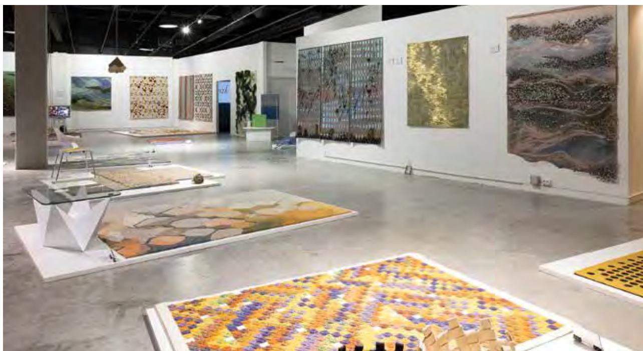
3. Rug Art Fest kiállítás (részlet) | 3rd Rug Art Fest (exhibition photo) | MaxCity, Budapest, 2019