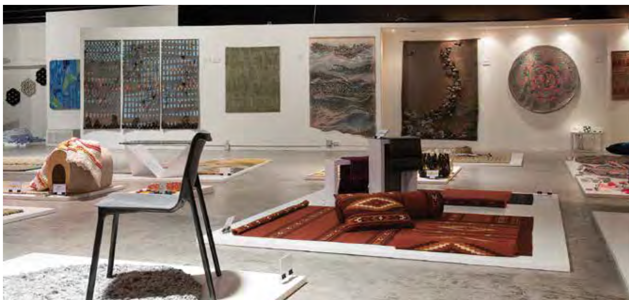
3. Rug Art Fest kiállítás (részlet). Középen KAMOCSEY Judit Álom elnevezésű lakástextil-kollekciója

3rd Rug Art Fest (exhibition photo). In the middle Judit KAMOCSEY's home textile collection titled 'Dream' | MaxCity, Budapest, 2019