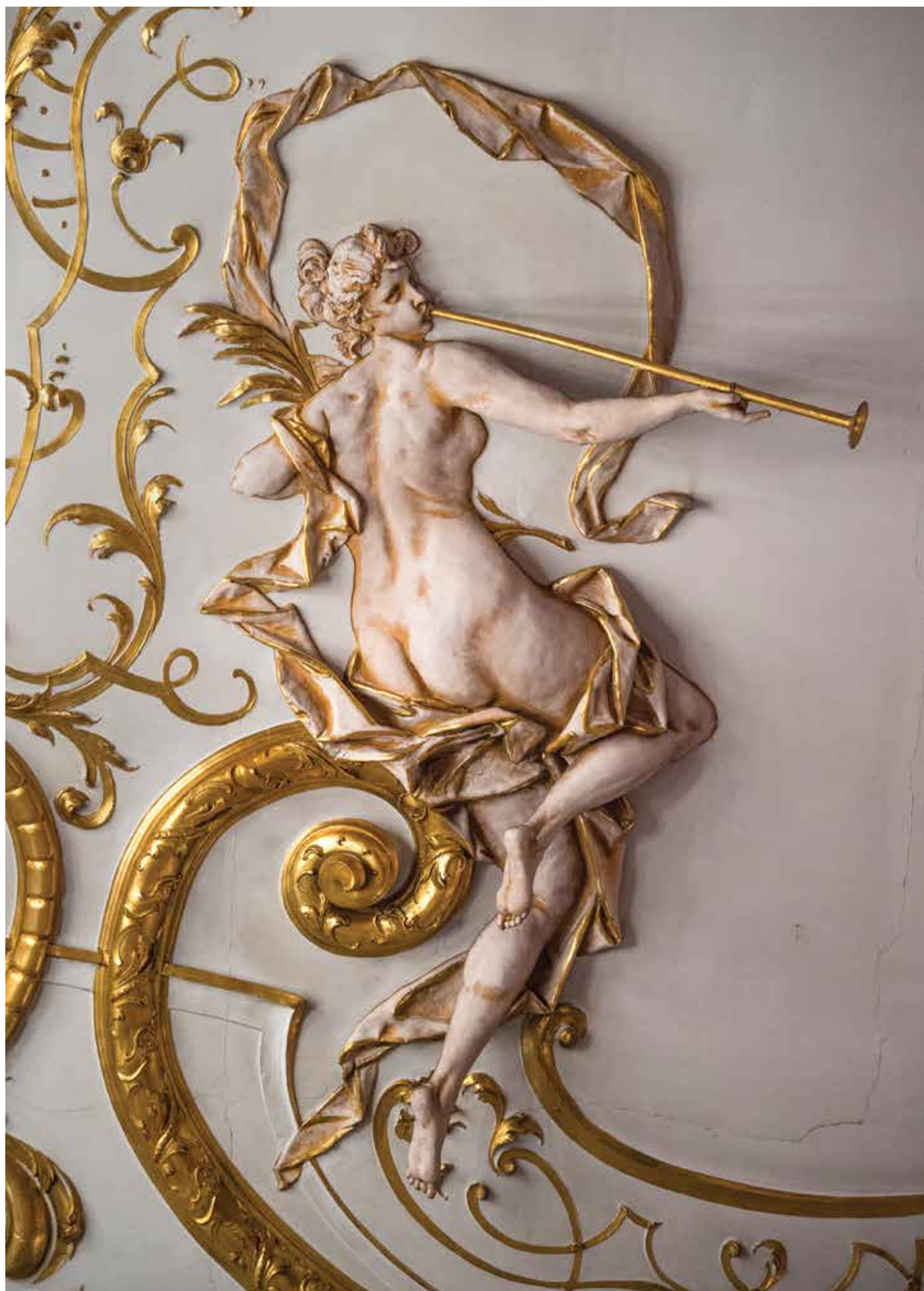
Aranyozott gipszdíszítés a kecskeméti színház nézőterének mennyezetéről Gilded plaster ornament from the auditorium ceiling of the Kecskemét theatre ( Cikkünk a 43. oldalon )