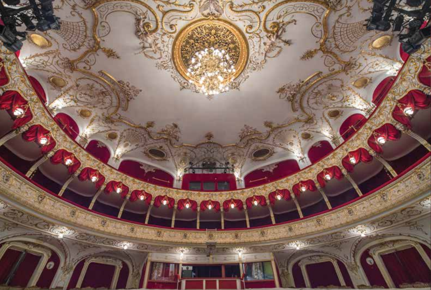
A kecskeméti színház nézőtere és mennyezete | Auditorium and ceiling of the Kecskemét theatre