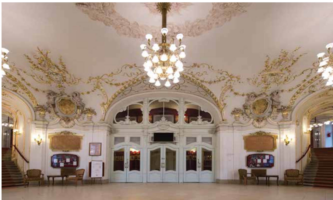
A színház előcsarnoka | The foyer of the theatre