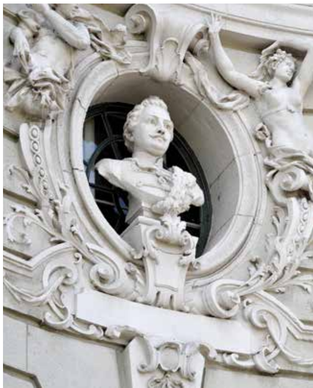
Katona József mellszobra az előcsarnok oldalsó bejárata fölött József Katona's bust above the side entrance to the foyer

műleírás 3 erre vonatkozó kijelentése: a „Tervezőket azon igyekezet vezérelte, hogy az épület külseje lehetőleg monumentális jelleggel bírjon. Mint építési stíl a barokk-stíl választatott.” Már a megnyitás évében megjelent, sőt széles körben elterjedt az a vélemény, mely szerint Kecskeméten a Vígyszínház kicsinyített mását építették fel. „A kecskeméti új színház [...] a Vígyszínház mintájára épült, kisebbitett arányokban. Ugyanaz a csinos, formás barokk-épület, ugyanazok a színek, ugyanaz a beosztás, ugyanaz a fény. Ugyanazok az építőművészek építették, mint a Vígyszínházat.” 4 A pesti épület minta mivoltát azonban egyetlen primer forrás sem támasztja alá. A nagy fokú hasonlóság elsősorban annak köszönhető, hogy a tervezési és a kivitelezési folyamatok lényegében egy időben történtek. Mindenesetre a kecskeméti nevezhetjük talán Fellner és Helmer legjobb arányú színházépületének, melyről így nyilatkozott a nyitó előadáson Gertrudist játszó Jászai Mari: „Sok színházat láttam, sokban játszottam, de higgye meg ez mindnek felette áll. Fellnerék is sok szép alkotással dicsekedhetnek, de ezzel – remekeltek! Abban az épületben minden olyan bájos öszhangban van, hogy az maga inspirálja az embert. Katona József szelleme dolgozott ott, mikor azt a színházat építették. Az egész olyan, mint egy szép zene.” 5