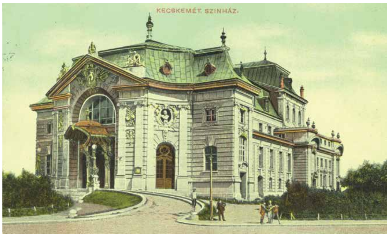
A kecskeméti színház (ma: Katona József Színház), 1909-ben feladott kézzel színezett képeslap

AZ ATELIER FELLNER & HELMER ÉS A KECSKEMÉTI SZÍNHÁZ