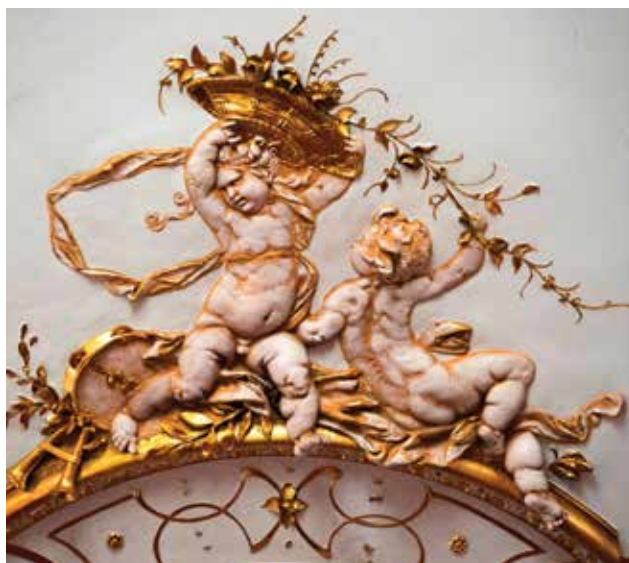
Aranyozott gipszputtók a nézőtér mennyezetéről

Gilded plaster putti from the auditorium ceiling