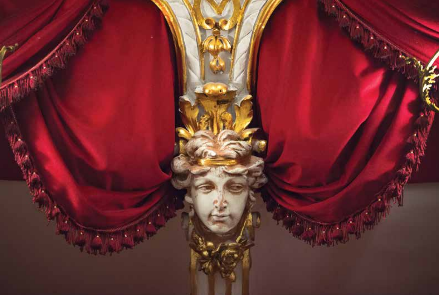
Részlet a páholysorról | Detail of the boxes