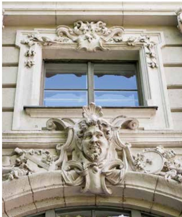
Részlet az oldalhomlokzatról | Detail of the side facade

„Az épület belsejében hasonlóképpen a vidám barokk stíl választatott, mint az egyedüli stíl, mely mellett a színházak belsejének kevés költséggel is díszes, vidám és otthonos díszítés adható. Míg az előcsarnok és a páholylépcsők világos színezést nyernek s a szín-átmenet a márvány lépcsőkön éretik el. A nézőtér architektúrája fehér és aranyszínű vörös háttérrel a szövet falakon és a drapperiákon. A foyér-k architektúrája fehér élénk szövet falakkal és drapperiákkal.” Az építészek műleírását számszerű adatokkal kiegészítve, eredetileg 6 földszinti, 23 első emeleti, 10 második emeleti páholy volt, s összesen 900 néző számára volt 621 ülő- és 279 állóhely, ezt már az átadás után egy évvel módosították azzal, hogy a második emeleten csak a két prosceniumpáholyt hagyták meg, míg a többiekből újabb karzati ülőhelyeket alakítottak ki. A páholyok és a karzat „vasvázás enyves gypsből” készült mellvédjén az épület külsejéhez